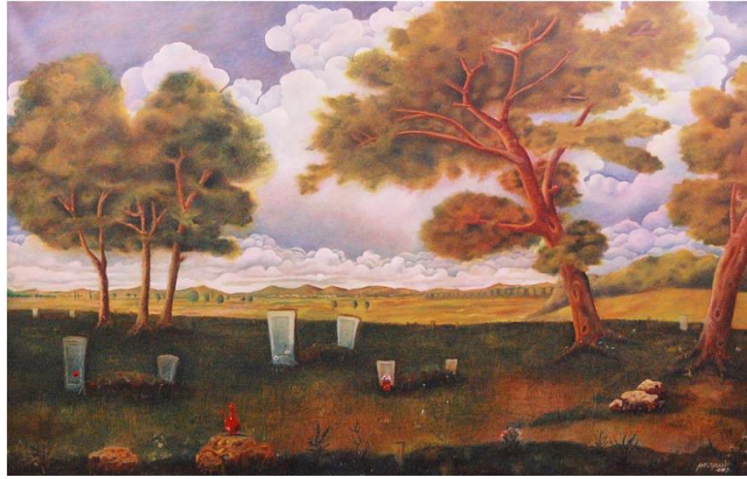
Görsel 11. Ahmet Atan, “Peyzaj”, 150x100 cm. TÜYB. 2009, (Taş,2010a, s:79).