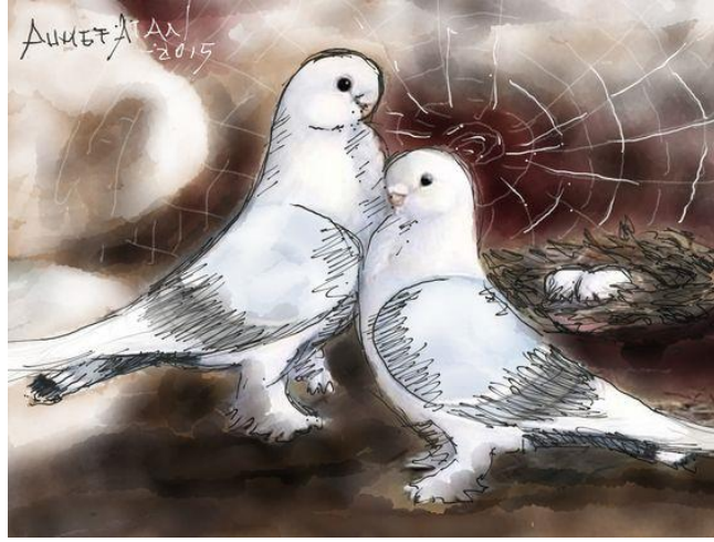
Görsel 3. Ahmet Atan, Kutsal Nöbet, Teknoart, 2015.