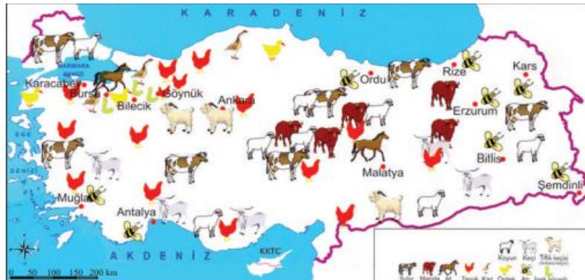
3.22: Türkiye Hayvancılık Haritası

Tablo 2'ye göre, 6. Sınıf Sosyal Bilgiler ders kitabında en çok kullanılan görsel fotoğraflardır (215). Sonrasında sırayla resimler izlemiştir (57). Diğer sıra ise şu şekilde devam etmektedir: Harita (40), haber yazıları (28), tablolar (15), grafikler (8), zaman şeritleri (2) dir. Kavram ve zihin haritaları, karikatür, minyatür ve gravürler bu kitapta hiç kullanılmamıştır. Altıncı sınıf ders kitabında Türkiye hayvancılık haritası (s.121), yatırım türleri ve yatırım sebepleri ile ilgili tablo verilmiştir (s.115). Buna göre;