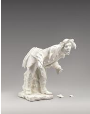
Resim 7: Chad Wys, Ode 2, 2013. C-print 30" x 24"

İçinde yaşadığımız çağ her şeyiyle akışkan ve geçişli, aynı zamanda da inanılmaz hızlı. Tüm bu akışkanlık, geçişler ve bükülmeler şekil değiştirmeye devam etmekte. Bu yüzden eserlerinde bu akışkanlık ve geçişi eriyen figürler ile ele alan sanatçı, hiç bir zaman değişimin bitmeyeceğini de ifade etmektedir.