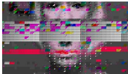
Resim 1: Rose Menkman'ın Glitch Çalışması

Glitch sanatı teknoloji çağının insan tipini anlamamıza yardımcı olacaktır. Bu sanatı sosyolojisiyle düşündüğümüzde karşımıza çıkacak anlamlar da hayatımızın içindeki anlamlardan oluşacaktır.