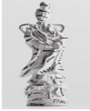
Resim 4: Fragile Geisha, Marker on Found Ceramic, 2013, 12" x 4" x 3.5" Kaynak: URL 4

Günümüzde, kitle iletişim araçlarının oluşturduğu imgeler yoluyla şeyler tanımlamakta, göstergeleri ile günlük yaşam planlanmaktadır. Bu göstergeler toplumsal değer yargılarımızı oluşturmaktadır. Gelişen endüstri ile seri üretimler sonucu ortaya konulan her türlü şey tüketim amaçlıdır. Modern toplumlar tüketim üzerinden kurgulanmaktadır. Bu tüketimden sanat dalları da payına düşeni almaktadır. Sanatçılar yaşadığı ortamdan beslenmektedirler.