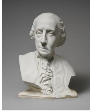
Resim 6: Chad Wys, Ode 2, 2013. C-print 30" x 24".

Wys'in eserlerinde günlük objeler mükemmellik ve uyumun aldatıcı imgesi ile alışıl gelmiş formunu kaybederek deforme olmuş görüntülere bürünmektedirler. Siyasal ve sosyal olayların değişimi ile eş zamanlı olarak adeta eriyerek şekil değiştiren formları toplumların içinde bulunduğu yozlaşmaya göndermeler yapmaktadır.