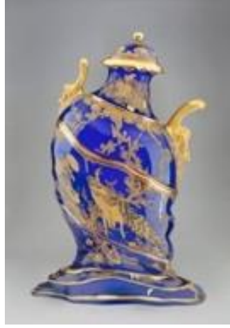
Resim 9: Chad Wys, Ode 2, 2013. C-print 30" x 24".

Sanatçının eserlerinde yer alan porselen objelerin yüzeylerindeki dijital baskılarda oluşturulan kayma, erime etkisi ile objelerin geçmişine dair izler görülse de artık onlar bambaşka sözler söylemektedirler. Geriye kalan geleneksel dekor izleri ve kulp detayları izleyiciyi gerçek güzelliğin ne olduğuna dair sorgulatmaktadır.