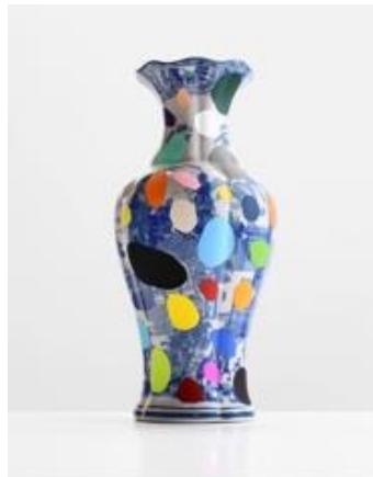
Resim 3: Chad Wys, Delft Punk, 2013. Bulunan Seramik Üzerine Boyama. 14" x 7.5" (diameter).

Kagan (1999)’a göre: “sanatsal olarak biçim verme işlemini, somut bir kişinin, somut bir olgunun, somut bir olayın, somut bir nesnenin canlandırılışına değil, birçok kişinin, olgunun, olayın ve nesnenin tikel çizgilerinin soyutlamasına, genellendirilmesine ve sanatçı tarafından yaratılmış olan imgede bir araya getirilmesine, birleştirilmesine dayandırır” sözü yapıbozum kavramının yıkıcı üslubunun günümüz seramik sanatının yaratım sürecini izleyici üzerindeki etkisi ile ilişkilendirilmektedir (1999:12-14). Wys’in bulduğu nesnelere çalışması, sahiplenme, tarih ve estetik fikirlerini taşıyan nesnellik kavramını aynı zamanda renk, kompozisyon ve biçimi incelemeyi amaçlamaktadır.