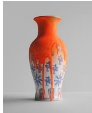
Resim 11: Chad Wys, Sprayed Chinese Vase, 2009. Spray paint on found ceramic. 12" x 6" (diameter)

Sanatçı, Japon kültürünün wabi sabi'si kusursuzluk sanatının aksine kusurlarda güzellik, estetik ve mükemmeliyet arayan glitch sanatı ile eserler üretmeye devam etmektedir.