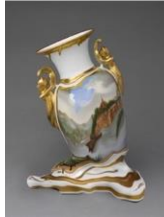
Resim 8: Chad Wys, Ode 2, 2013. C-print 30" x 24"

Sanatçı eserlerinde; fonksiyonel seramik objeleri bir yıkım yaratmak sureti ile şekillendirme aşamasında deforme etmekte, böylece işlevinden ve görüntüsünden uzaklaşan obje yeni kavramsal boyutu ile söz söylemektedir. Başka bir ifade şekli ile eserlerinde mükemmel olan yapıyı bozma süreci sonucu, seramik tarihinde yer alan kusursuz formlara yeni anlamlar yüklemek adına eriyerek kayan görüntüler oluşturmaktadır. Eriyen bu formlara bakan izleyiciler hem estetik hem de toplumsal sorgulamalar ile yüz yüze kalmaktadır. Geleneksel formlar onun çalışmalarında, yepyeni bir gerçekliğe evrilmektedir.