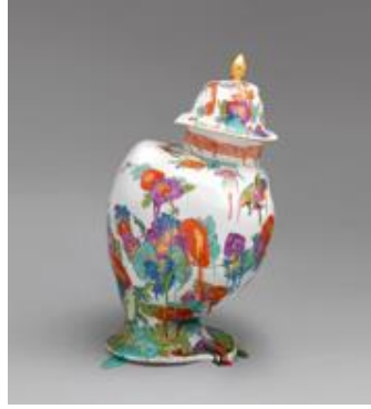
Resim 5: Ode 7, c-print, 30" X 26.7"

Günümüzde, kitle iletişim araçlarının oluşturduğu imgeler yoluyla şeyler tanımlamakta, göstergeleri ile günlük yaşam planlanmaktadır. Bu göstergeler toplumsal değer yargılarımızı oluşturmaktadır. Gelişen endüstri ile seri üretimler sonucu ortaya konulan her türlü şey tüketim amaçlıdır. Modern toplumlar tüketim üzerinden kurgulanmaktadır. Bu tüketimden sanat dalları da payına düşeni almaktadır. Sanatçılar yaşadığı ortamdan beslenmektedirler.