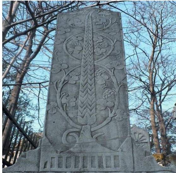
Resim 3. Servi Ağacı Motifli Mezar Taşı 4

Servi ağacının yeşilliği, ilk yıllarda yere daha yakındır. Yaşı ilerleyip ağaç büyüdükçe gövdenin alt kısımlarındaki yeşillik azalır ve üst kısma doğru kayar. Bu da servinin yere bağlılıktan sıyrılıp göklere doğru yükseldiğini ifade eder (Gülcü, 2018: s. 279).