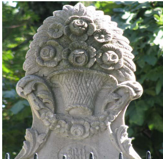
Resim 1. Gül Motifli Mezar Taşı (Yılmaz, 2010: s. 15)

(Bahçıvan gül bahçesini sulamak için uğraşsın, Bin tane gül bahçesi sulasa senin yüzün bir gül dahi açmaz.)