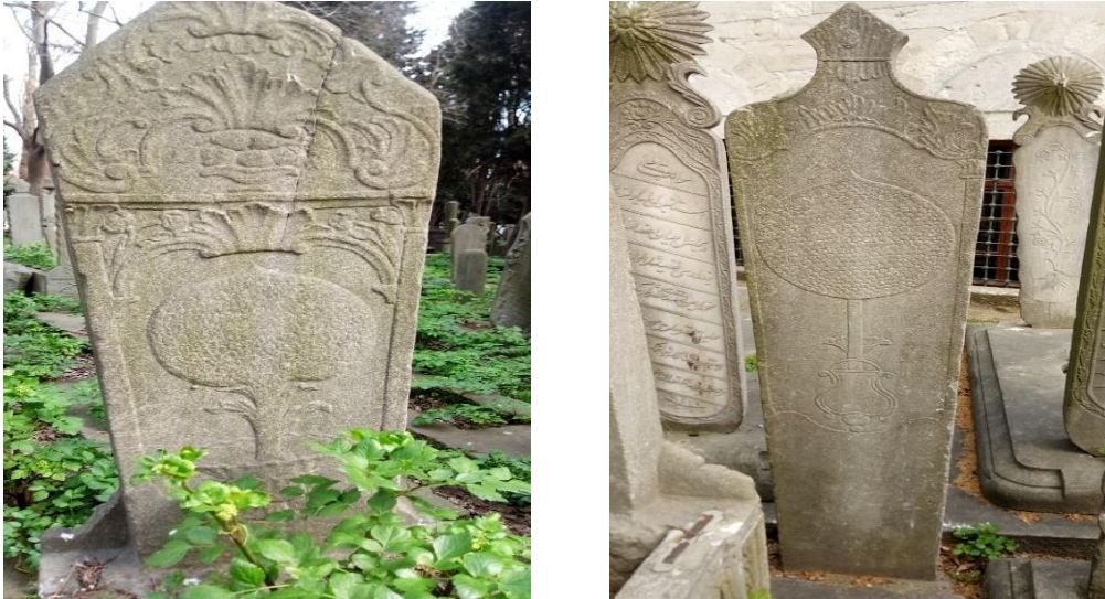
Resim 4. Hayat Ağacı Motifli Mezar Taşları (Kaynak Kişi 1)

İslam sanatında görülen hayat ağacına farklı anlamlar yüklenmiştir. Hayat ağacı Sidret'ül-Münteha (son ağaç) ile bağlantılandırılır. Bazen bir şema dâhilinde, bazen de bağımsız bir motif olarak kullanılan hayat ağacı Selçuklu ve Beylikler döneminde Cennet anlamını da kazanır. Dalları arasında yer alan narlar Cennet meyvelerini, kuşlar Cennet kuşlarını sembolize eder.