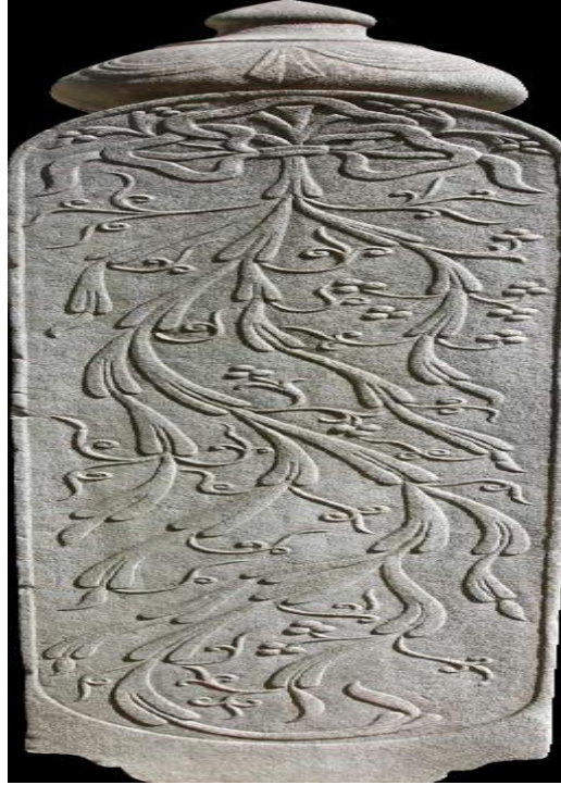
Resim 5. TûbâAğacı Motifli Mezar Taşı(Gülcü, 2018: s. 293)

Mirâciyelerdetûbâ, cennetteki ağaçların en büyüğü olarak anlatılır. Naat'larda ve mesnevilerde tûbânın dal ve yapraklarının parlaklığı, güzelliği, boyu, gövdesinin kalınlığı, azamet ve ululuğu, kurumayan dalları, dökülmeyen yaprakları, kaybolmayan tazeliği, tükenmeyen meyvesiyle teşbih, temsil ve telmih konusu olmuştur. Tasavvufta tûbâ Hak Teâlâ ile ünsiyet makamını ifade eden bir kavramdır. Allah'ın huzurunda mutluluk, sükûn ve huzur içinde bulunma halini anlatmak için de kullanılır. Türkçemizde "başı göğe ermek" deyiminden hareketle "başı tûbâyâ ermek" tabirine de rastlanır. Harika özelliklerinden dolayı Türkçede kız ismi olarak da kullanılmaktadır (Gülcü, 2018: s. 292-293).