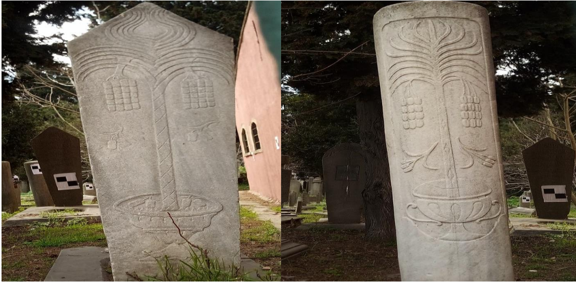
Resim 6. Hurma Ağacı Motifli Mezar Taşları (Kaynak Kişi 1)

Cennete özgü meyve ve ağaçlardan sayılan hurmanın faydalarına, Kur'an'ın Meryem Sûresi'nde (Meryem: 25) dikkat çekilmiştir. Allah, doğum sancısı çekmekte olan Hz. Meryem'e hurma yemesini salık vererek, hurmanın sağlık açısından önemli olduğuna işaret göstermiştir. Hurma İslâm dininin en kutsal meyvelerindedir. O dönemde yeni doğan bebekler Hz. Peygambere getirilir ve Hz. Peygamber bebeği kucağına alarak bebeği getiren kişiden bir hurma isterdi. Hz. Peygamber hurmayı ağzında iyice çiğneyerek ezdikten sonra, tükürüğünü bebeğin ağzına bırakır ve dua ederek bebeği hurma ile bir nevi kutsardı. Hz. Peygamber, bu kısa ayinden sonra da bebeğin adını koyardı. Böylelikle bebeğin daha sağlıklı, uzun ömürlü ve zeki olacağını belirtirdi (Erdal, 2015: s. 356).