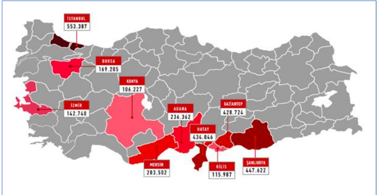
Harita 1: Türkiye'deki Şehirlerde ikamet eden Suriyeli Mülteci sayısı (2019)

Son olarak Suriyeli mültecilere ev sahipliği yapan diğer bir sınır ülkesi ise Türkiye'dir. Türkiye ve BMMYK'den alınan verilerine göre; 2012 yılında Türkiye'ye giriş yapan Suriyeli mülteci sayısı 9,500 kişiyken, bu sayı 2019 yılında 3,5 milyonun üzerine çıkmıştır (II). Krizin patlak verdiği yıllarda tıpkı Lübnan, Ürdün ve Irak gibi açık kapı politikasını izleyen Türkiye, bu ülkelerden farklı olarak sınırlarından giren Suriyeli sığınmacı sayısı BMMYK tarafından değil, AFAD başta olmak üzere devlet kurumlarınca tutulmuş ve temel ihtiyaçları giderilmiştir. Ancak her ne kadar gelen mülteciler kamplara yerleştirilse de mültecilerin büyük çoğunluğu şehirlerde ikame etmektedir. Aşağıdaki Harita 1 'de Türkiye'deki şehirlerde ikame eden mülteci sayıları verilmiştir.