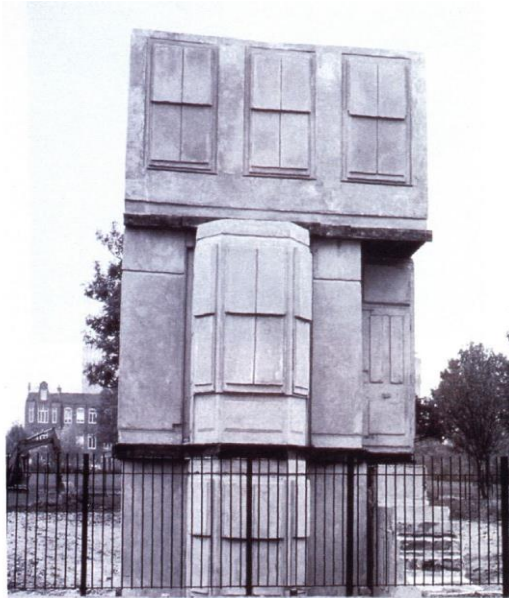
Şekil 1. “House” Rachel Whiteread, Londra, 1993.

Evin iç mekânına dair boşluğun kavranabilmesini mesele eden ve dolu-boş, iç-dış sorgusunun temsilini sağlayan bu heykel 1993 yılında Londra’da yapılmıştır. Boşluğu görememenin ya da sadece doluyu referans almanın nesnel sonuçlarını kavramak için üretilen “House” başlıklı sanatsal çalışma çarpıcı bir açıklama getirmektedir. Eser Rachel Whiteread tarafından yapılmıştır. Sanatçı çalışmalarında genellikle mekân içindeki boş alanları sanatında yoğun olarak işlemektedir. Mobilyaların arasında kalan boşluğun anlamı ve vurgusunu belirtmek sanatında ana öğe olarak karşımıza çıkmaktadır (Fer,1997: 165). Ev adlı eserinde ise her zamankinden zıt bir tutumla doluluğu ve bu doluluğun yaşamı imkânsız kılışını sert bir şekilde gözler önüne sermektedir (bkz. Şekil 1). Whiteread, bu eserinde doluluğun insanı mekansız ve kökensiz bırakışını çok sert bir şekilde işleyerek, boşun anlamını göstermektedir (Whitson, 2011:13).