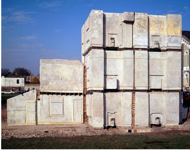
Şekil 3. “House” Rachel Whiteread, Londra, 1993.

İçe ait olan boşluk doldurulmuş, dışa dair olan nesnel beden ise bir kalıp halinde soyulup atılmıştır. O ana dek varlığı referans alınan dolu yoklaşmış, görülmez hale getirilen boşluk ise nesneleşerek varlaşmıştır. İç mimarın gerçek mekânsal muhatabı işte bu boşluktur; nesnelere odaklanmış gözlerin görmezden geldiği müdahale edilesi sessiz hacimdir. Pandemi döneminin insanlığa altını çizerek gösterdiği gibi, izole olmak adına kendilerini kapattıkları bu sessiz hacimleri ancak nesnelere mecbur kalmadan tasarlayarak konuşur hale getirmek mümkün olabilecektir.