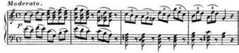
Şekil 10. C. Czerny, Von dem Vortrage, 1839, S. 21

Czerny staccato üzerine yaptığı açıklamaların arasında üzerinde bağ olan nota gruplarının son notasının biraz kısaltılarak çalınması gerektiğini belirtmektedir (Şekil 10).