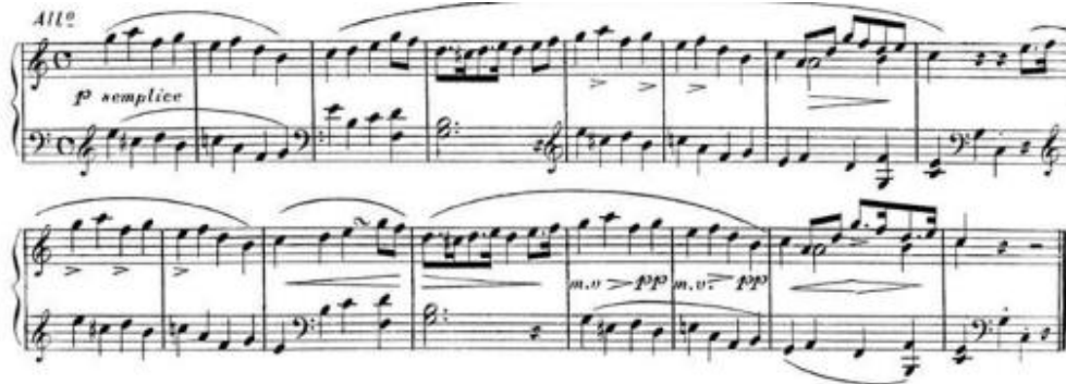
Şekil 7. C. Czerny, Von dem Vortrage, 1839, s. 9

Czerny dinleyiciyi sıkmamak için sıkça yorumu çeşitlendirme ihtiyacını dile getirir bu da tekrar edilen motiflerin nasıl çalınacağıyla ilgilidir ve Şekil 7'de görüldüğü gibi vurgulamaların ne kadar önemli olduğunu gösterir.