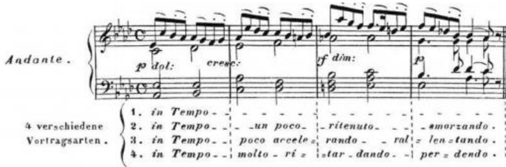
Şekil 11. C. Czerny, Von dem Vortrage, 1839, s. 25.

Bunun için Czerny, dört farklı biçimde yorumlanması gereken dört ölçülük muhteşem bir örnek oluşturmuştur (Şekil 11). Her versiyon için belirli talimatlar verir.