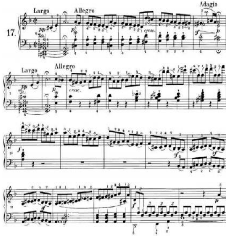
Şekil 2. L. V. Beethoven, Piyanosonati op.31/2 1. bölüm, ölçü 1-22, Universal Edisyon, Viyana.

Şekil 1’de verilen örnekte Czerny, çıkıcı ve inici bir çizgi üzerindeki crescendo işaretinin çıkıcı notaların gittikçe artarak ve her notanın bir öncekinden biraz daha kuvvetli olarak çalınması gerektiğini belirtmiştir. Aynı zamanda da her nüansın iyi bir plan dahilinde yapılması gerektiğini vurgulamıştır. Örneğin eğer ilk nota “piano” (p) olarak belirtilmiş ise crescendo en fazla “mezza voce” ye kadar çıkmalıdır. Genel olarak notada crescondo işareti görüldüğünde aniden kuvvetli çalma eğilimi vardır. Piyanistler, şancılar ve diğer enstrümcuların aksine seslerin iç içe geçtiğini unuturlar. Oysa içitmeye veya nefese bağlı olarak ses oluşturmaya çalışanların titizliği ve dikkatiyle seslerin gelişimini dinlemeyi unutmamak gerekir. Aslında ilk piyano derslerinde edinilen bu çalınan sesi dinleme olgusu, binlerce nota ve dikkat edilmesi gereken öğelerin artması yüzünden zaman içinde kaybolabilmektedir. Fakat nüans farklılıklarına dikkat etmek, bir karakter yaratmak, çeşitli yapılar arasında fark yaratabilmek için elimizdeki en önemli araçtır. Ancak bu araç sayesinde bir eseri yaşatabilecek en önemli unsurlar ve detaylar ortaya çıkabilir.