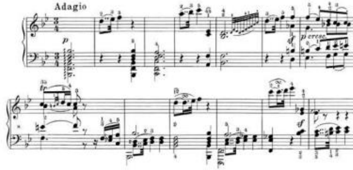
Şekil 5. L.V. Beethoven, Sonat op.31/2, 2. Bölüm. Universal Edition, Viyana

Bu tür bölümlerde aksanların yoğunlukları, süreleri ve uygulanması gereken ağırlık konuları yorumcular açısından sürekli soru ve şüphe kaynağıdır. Örneğin ikinci ve üçüncü ölçüdeki temanın üçüncü ölçüdeki üç vuruşluk notaya kadar devam etmesi gerekir mi? Temanın ilk vuruşu nasıl çalınmalıdır? Diğer iki vuruştan daha hafif çalınabilir mi? Czerny'nin daha önceki örneklerinden yola çıkarak melodinin üçüncü ölçüdeki uzun notaya kadar devam ettirilmesi gerekmiyor mu? Bu durumda birinci vuruşun her zaman güçlü zaman olma temeli prensibi kenara konulabilir mi?