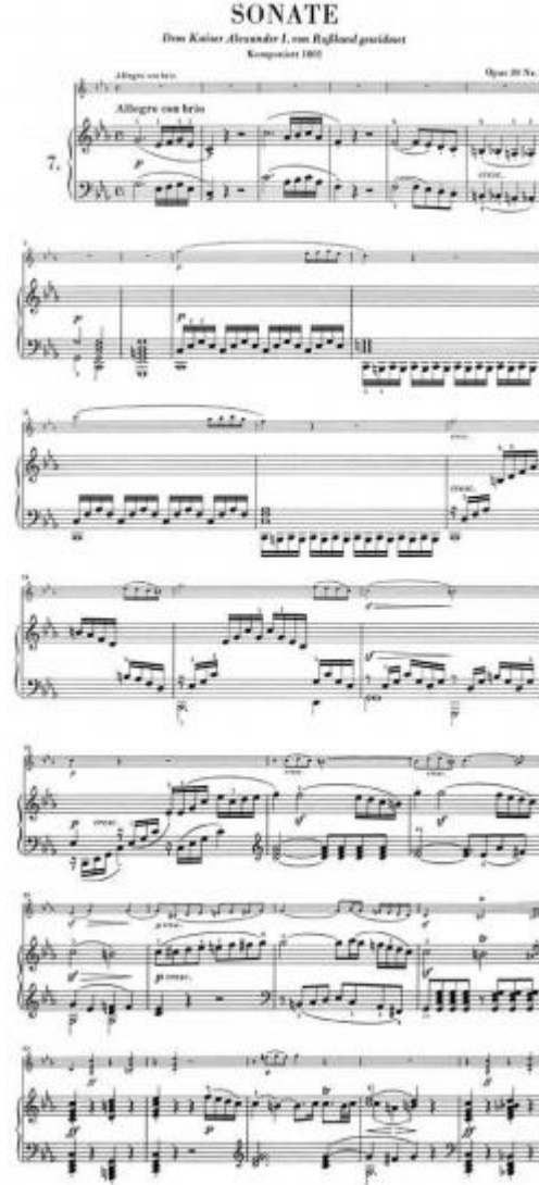
Şekil 3. L.V. Beethoven, Keman ve Piyano Sonatı op. 30/2, 1.bölüm ölçü 1-27, Universal Edisyon, Viyana.

En virtüözlük gerektiren pasajlar böylelikle farklı bir anlam kazanabilir: Daha orantılı körüklemeler her sesin jestlerle, hareketlerle değil öncelikle kulakla yönetilmesini sağlar. Şekil 3'te örnek olarak Beethoven'in op.32 no.2 do minör keman-piyano sonatı verilmiştir.