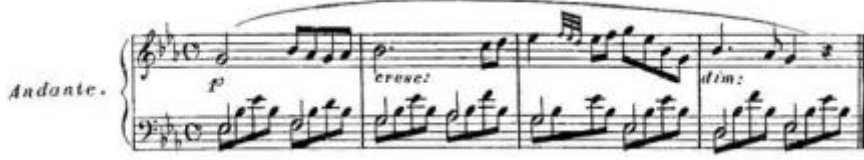
Şekil 8. C. Czerny, Von dem Vortrage, 1839, S. 13

Crescendo 'yla ilgili bölümde de belirtildiği gibi bir melodinin notalarını farklılaştırmak için yine vurgulamaya başvurulmuştur. Şekil 8'deki örnekte olduğu gibi yavaş bir melodi aynı armonide çıkıp iniyorsa besteci belirtmemiş bile olsa içinde bulunduğu nüansla bağlantılı olarak crescendo veya diminuendo ortaya çıkar (Czerny, 1839/1991, s. 13).