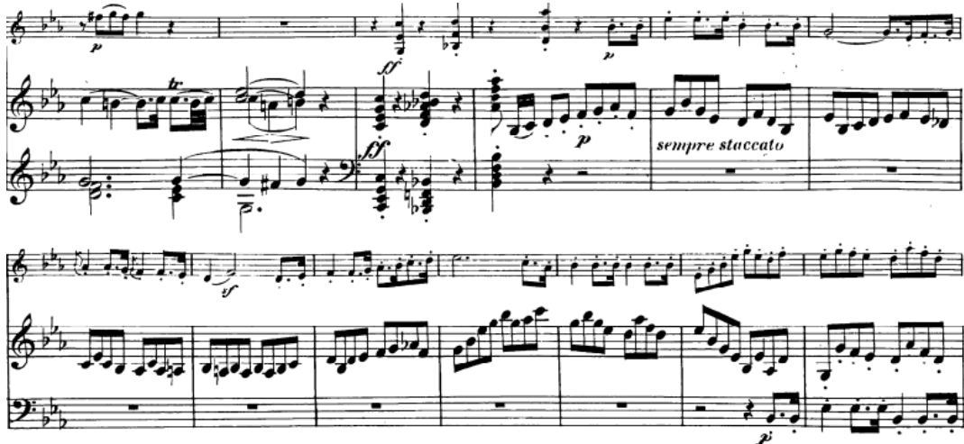
Şekil 9. L.V. Beethoven, Keman ve Piyano Sonatı op. 30/2, 1. bölüm ölçü 25-37, Universal Edisyon, Viyana.

Yukarda açıklanan bu tuşe tekniklerinden kuşkusuz günümüz anlayışından en farklı olanı staccato 'dur, zira genellikle fazla kuru bir şekilde çalınmaktadır. Bunun güzel bir örneği Şekil 9'da Beethoven'ın op. 30/2 keman – piyano sonatının 29 ile 33. ölçüleri arasındaki 2. temanın girişinde görülebilir.