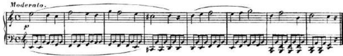
Şekil 4. C.Czerny, Von dem Vortrage, 1839, s. 5

Czerny, konuşma dilinde bazı hecelerin daha uzun bazılarının ise daha kısa olduğunu ifade etmiştir. Aynı durumun müzikte de olduğunu belirtmekle birlikte bunu kurallar çerçevesine oturtmanın güçlüğünden bahsetmiştir. İcracı da bu karakterleri açıklık, belirginlik ve ritmik olarak nasıl ifade edebileceğini bulmalıdır (Czerny, 1839/1991, s. 5).