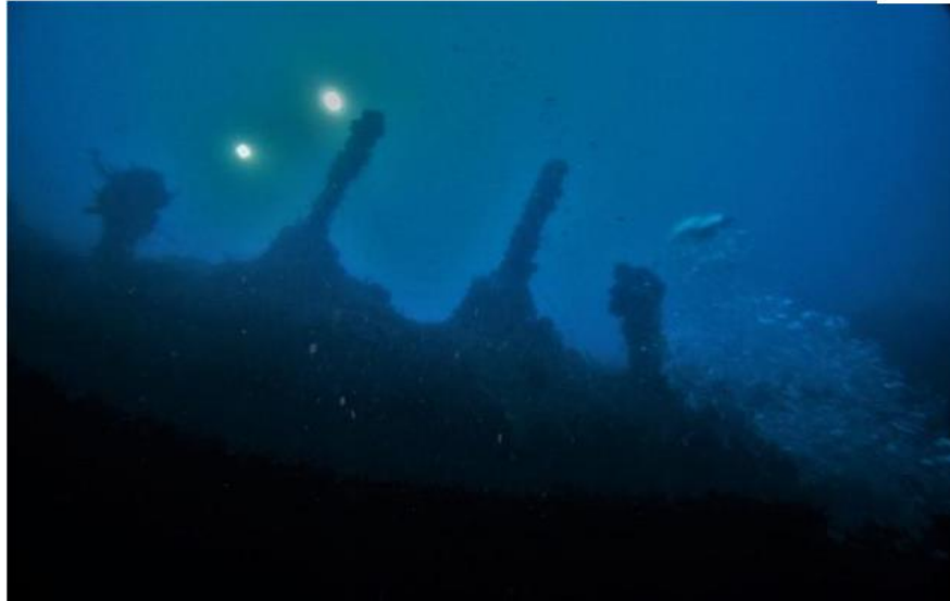
Fotoğraf.1: İskenderun Limanında yapılan su altı faaliyetler sonucu bulunan 1. Dünya Savaşına ait düşman gemisi

Bu iddiayı destekleyen başka bir bulgu ise İskenderun’da bulunan batık gemilerdir. İskenderun Teknik Üniversitesi Deniz Bilimleri ve Teknoloji Fakültesi tarafından yapılan bir arama sırasında İskenderun limanında bulunan iki savaş gemisinin 1. Dünya Savaşı’na ait olduğu doğrulanmıştır. Savaş sırasında İskenderun limanına yönelik herhangi bir çıkartmanın ya da bu bölgede herhangi bir donanma savaşının olmaması bu gemilerin nasıl battığı konusunda bir merak uyandırmaktadır. Araştırmamızda bahsettiğimiz gemi batırma hadisesiyle limanda bulunan batık gemiler birbirleriyle örtüşmektedir. Hatta bulunan gemilerden birinin İngiliz mayın arama tarama gemisi olması tamamen iddiamız doğrular niteliktedir.