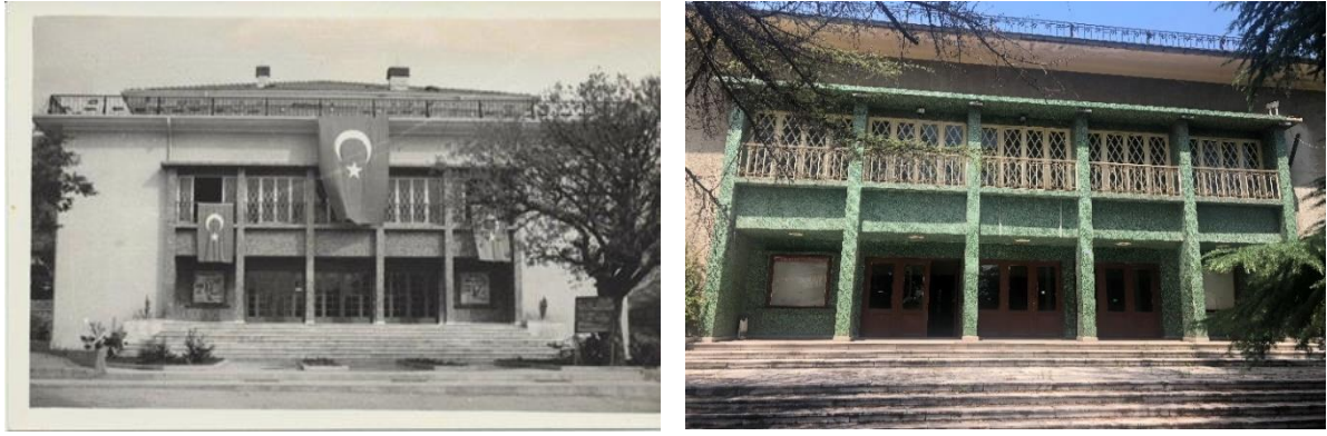
Şekil 1. Yenişehir Sinemasına Ait Görseller

Cumhuriyet Dönemi'nde modernleşmenin simgesi olan Yenişehir Sineması, Karabük Demir Çelik Fabrikası yerleşkelerinde yer almaktadır. Yapı 1953'te Münici Tangör tarafından tasarlanmış ve 1958 yılında tamamlanmıştır (Şekil1). 941m 2 'lik bir alana oturan yapı, sinemanın yanında tiyatro ve opera gibi etkinliklere imkan vermektedir (Şekil 2,3). 1960- 1990 yılları arasında ülkenin önemli salonları arasında olan sinema, 2008-2013 yılları arasında kültür merkezi olarak kullanılmış ve sonrasında ise kapatılmıştır.