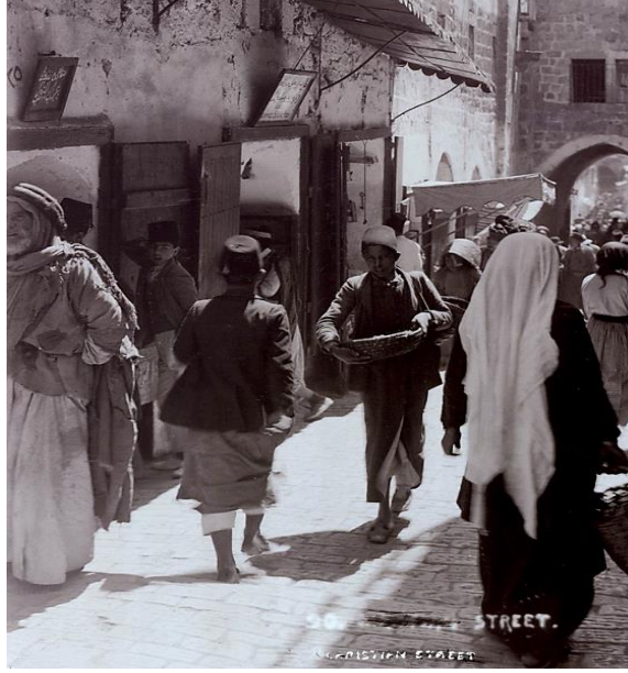
Resim 18. Çeken Fotoğrafçısı Bilinmeyen Kudüs Vilayeti Eski Şehir Sokaklarında Bulunan Çocuklar (Balcı, 2009, s. 233). Osmanlı'nın son yıllarında Kudüs

“Dikdörtgen” model formlu, sıfır yakalı, kol boyu bilekte biten takma kollu gömlek ile “Klasik” model formlu, ağı normal düşüklükte, normal genişlikte paça uygulanmış ve boyu bilekte biten pantolon giymiştir. Çocuk, başa fes takmış ve ayağa çarık giymiştir.