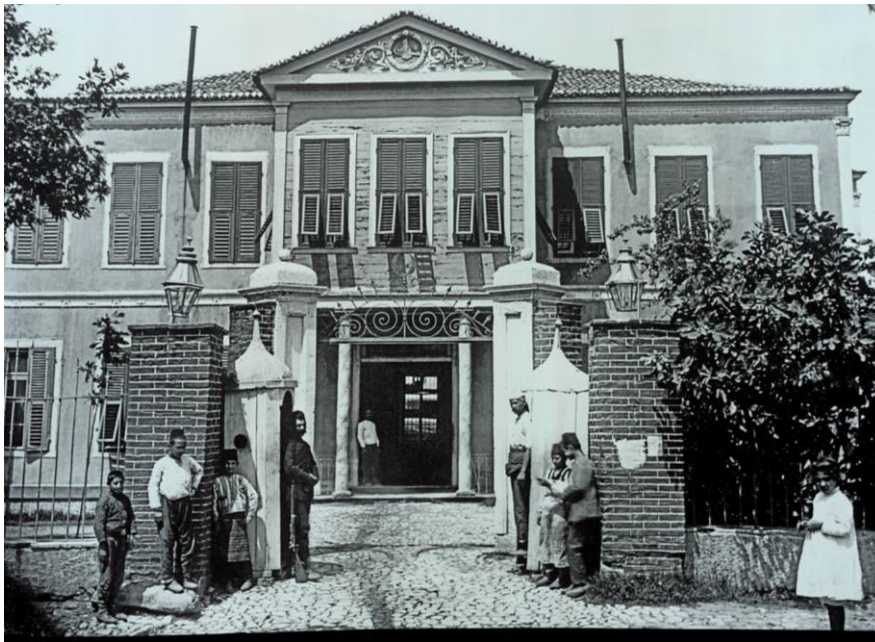
Fotoğraf 19. M. Leghparian Tarafınan 1903 Yılında Çekilmiş Manisa Vilayeti Salihli İlçesi Hükümet Konağı Önünde Bulunan Çocuklar (Çolak vd., 2013: 155).

Çocuklar; “Dikdörtgen” model formlu, boyu kalçada biten ceket giymiştir. Yüzü dönük olan çocukların giymiş olduğu ceketlerde erkek yaka ve tek sıra kapama (ilik - düğme) uygulanmıştır. Yüzü dönük olan soldaki çocuğun giymiş olduğu ceketinde kol boyu bilek ile dirsek arasında biten takma kol; diğer çocukların giymiş olduğu ceketlerde kol boyu bilekte biten takma kol uygulanmıştır. Çocuklar; “Dikdörtgen” model formlu entari giymiştir. Yüzü dönük olan çocukların giymiş olduğu entarilerde sıfır yaka uygulanmış ve entarinin boyu bilekte bitmiştir. Diğer çocuğun giymiş olduğu entarinin boyu baldırda bitmiştir. Yüzü dönük olan soldaki çocuğun giymiş olduğu entarilerde kruvaze kapama (ilik - düğme) uygulanmıştır. Yüzü dönük olan soldaki çocuğun giymiş olduğu entarinin içine; kol boyu bilekte biten gömlek giydiği görülmektedir. Bütün çocuklar, başa fes takmış ve ayağa çarık giymiştir.