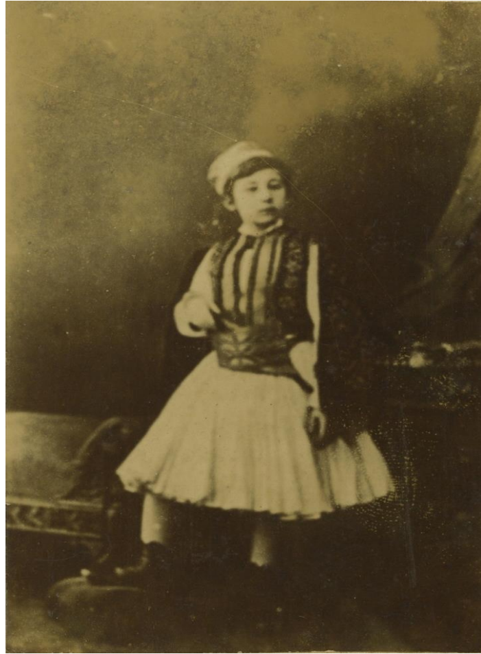
Resim 20. Çeken Fotoğrafçısı Bilinmeyen Selanik - Yanya Vilayeti Erkek Çocuğu (Ceranoğlu Özel Koleksiyonu, 2014).

Sol baştan ikinci çocuk; kol boyu bilekte biten takma kollu ve boyu belin biraz altında biten gömlek giymiştir. Çocuk, gömleğinin üzerine; “V” yakalı ve kolsuz süveter giymiştir. Çocuk aksesuar olarak başa fes; bele önlük takmış ve ayağa çarık giymiştir.