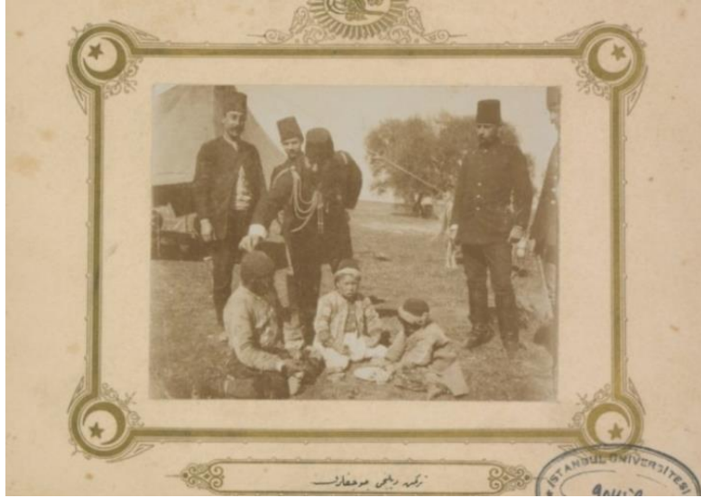
Resim 10. Çeken Fotoğrafçısı Bilinmeyen Eskişehir Vilayeti Çifteler Çiftliği'nde Bulunan Türkmen Fakir Çocuklar.

Çocuk; “Dikdörtgen” model formlu, bahriye (palet) yakalı, kol boyu bilekte biten takma kollu bluz ile “klasik” model formlu, ağı normal düşüklükte, dar paça uygulanmış ve boyu baldırda biten pantolon giymiştir. Çocuk aksesuar olarak başa fes; boynuna kolye takmış ve ayağa uzun konçlu bot ile çorap giymiştir.