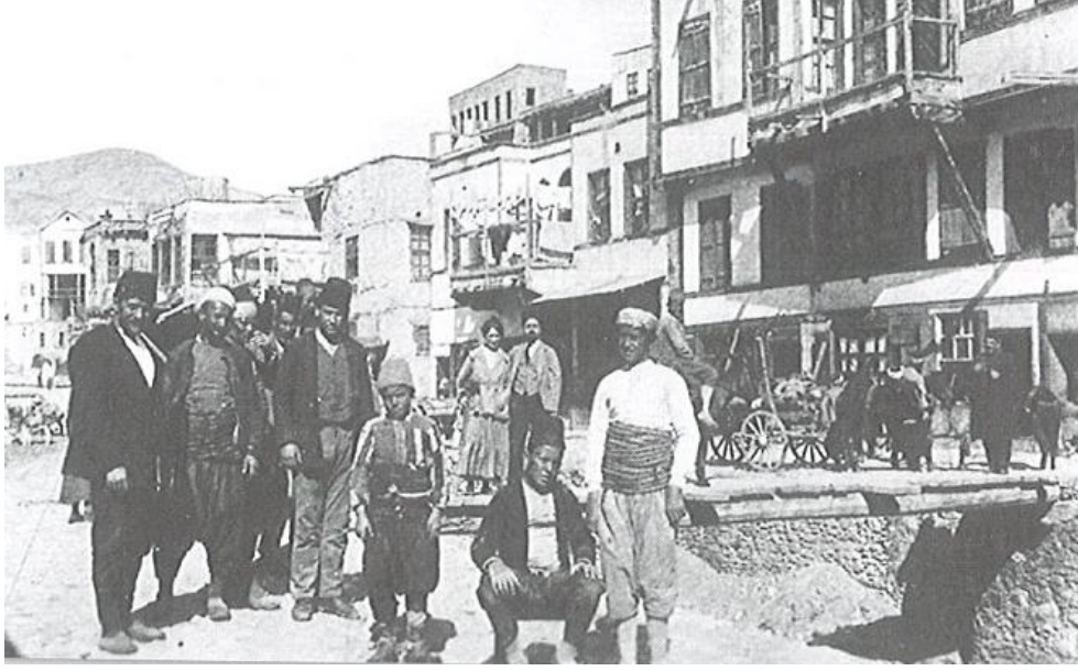
Resim 16. Çeken Fotoğrafçısı Bilinmeyen 1912 Yılında Çekilmiş Konya Vilayeti Sille Yöresinde Bulunan Çocuklar (Kapar, Çaycı ve Mimiroğlu, 2011, s. 107).

Fotoğraf, Konya vilayetinin bir dış mekânında çekilmiştir. Fotoğraftaki erkek çocukların üzerindeki kıyafetlerin günlük yaşamda giyilen sade kıyafetler olduğu görülmektedir.