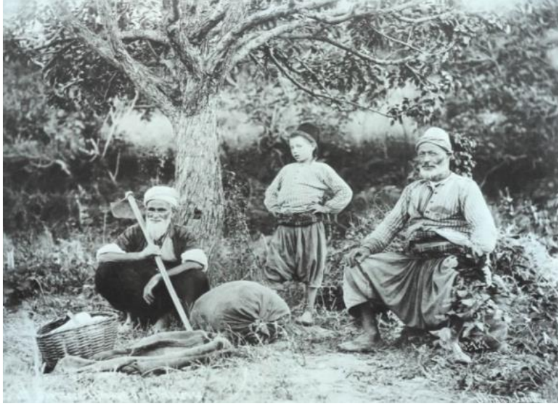
Resim 8. Sèbah & Joallier Tarafından 1894 Yılında Çekilmiş Bursa Vilayeti Köylü Çocuk (Eren, 2011, s. 427).

Sol baştan ikinci ve üçüncü çocuk; “Dikdörtgen” model formlu, “V” yakalı, kruvaze kapamalı (ilik - düğme) ve kol boyu bilek ile dirsek arasında biten takma kollu gömlek giymiştir. Diğer çocuklar; “Dikdörtgen” model formlu, sıfır yakalı, tek sıra kapamalı (ilik - düğme), manşetli ve kol boyu bileğin biraz üzerinde biten takma kollu gömlek giymiştir. Çocuklar, “V” model formlu, ağı düşük, dar paça uygulanmış pantolon giymiştir. Sol baştaki çocuğun giymiş olduğu pantolonun boyu baldırda; diğer çocukların giymiş olduğu pantolonların boyu dizin biraz altında bitmiştir. Tüm çocuklar, başa fes takmış ayrıca sağ baştan birinci çocuk ayağa çarık giymiştir. Sağ baştan üçüncü çocuk, sol omuzdan çapraz bir şekilde çanta takmış; ayrıca beline kuşak ve ayağa ise terlik giymiştir.