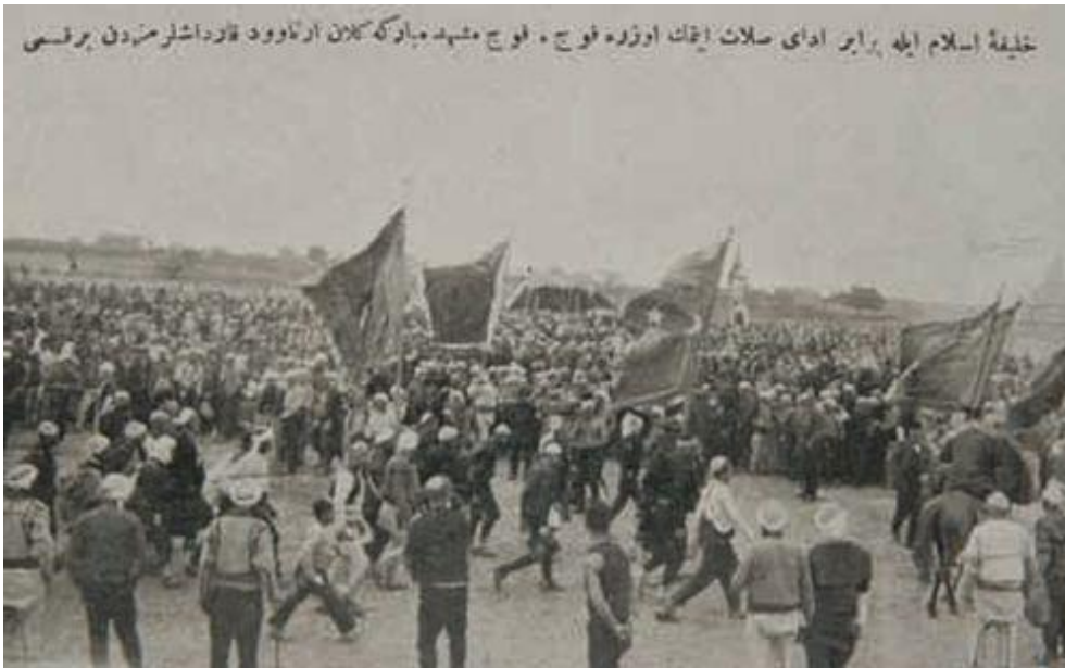
Resim 17. Çeken Fotoğrafçısı Bilinmeyen 1911 Yılında Sultan Reşad'ın Sultan Murad Hüdavendigâr Türbesi Ziyaretinde Çekilen Kosova Vilayetinde Bulunan Çocuk (İbrahimgil ve Konuk, 2006, s. 21)

Ortadaki çocuk; “Dikdörtgen” model formlu, “V” yakalı ve kol boyu bileğin biraz üzerinde biten takma kollu ceket ile “V” model formlu, ağı düşük, dar paça uygulanmış, boyu bileğin biraz üzerinde biten pantolon giymiştir. Ceketin içine; kol boyu bilekte biten gömlek giydiği görülmektedir. Çocuk, başa fes; bele kuşak takmış, ayağa çorap giymiştir.