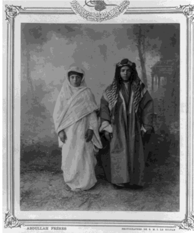
Resim 21. Abdullah Frères Tarafından Çekilmiş Trablusgarplı Çocuklar (Mansel, 1998, s. 34).

Fotoğraf, İstanbul vilayetinin bir fotoğrafhanesinde çekilmiştir ve fotoğrafta iki erkek çocuğu yer almaktadır. Çocukların Trablusgarp vilayetinin yerel kıyafetleri içinde fotoğraflandığı görülmektedir.