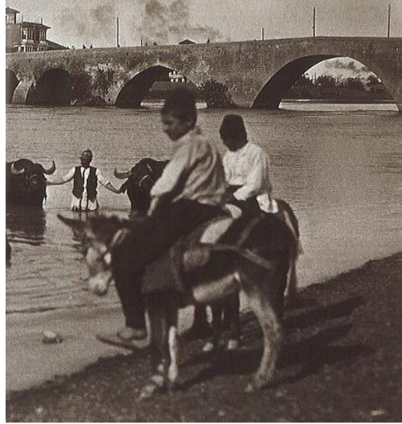
Resim 6. Gabriel Bretocq Tarafından 1923 Yılında Çekilmiş Adana Vilayeti Taşköprü'de Bulunan Çocuklar (Omay, 2003, s. 44 - 45).

1850 - 1923 yıllarında Osmanlı Devleti'nin Adana, Bursa, Edirne, Eskişehir, Giresun, Halep, İstanbul, Konya, Kudüs, Manisa, Selanik - Yanya, Trablusgarp, Yemen - Sana vilayetlerinde bulunan erkek çocukların kıyafetleri, vilayet isimlerinin baş harf sırasına göre incelenmiştir. Fotoğraflarda birden fazla sayıda bulunan çocukların kıyafetleri, çocukların duruşlarına göre sağdan sola; inceleyen insanın bakış açısına göre soldan sağa incelenmiş ve kıyafetler genel olarak betimlenmiştir.