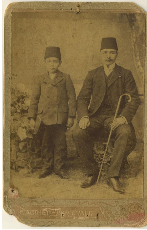
Resim 5. Osmanlı’da benzer kıyafet giyen yetişkin erkek ve erkek çocuk.

Yerasimos (1993, s. 58); Osmanlı toplumunu betimleyen görsel ve belge niteliği taşıyan gravür ve sulu boyalarda görülen çocuk giyim ve kuşamlarının tam anlamıyla bir “küçülmüş büyük” olduğunu belirtmiştir. Osmanoğlu (2003, s. 45) da Osmanlı çocuklarının gerek sarayda, konakta, köşkte; gerekse halk tabakasında yetişkinler gibi giydirildiğini gösteren pek çok kanıtın bulunduğunu belirterek bu görüşü desteklemiştir. Guillaume Martin (2007, s. 153), on sekizinci yüzyılda Osmanlı toplumunda erkeklerin erkek çocuklarla; kadınların kız çocuklarla aynı giysileri giydiğini gözlemiştir.