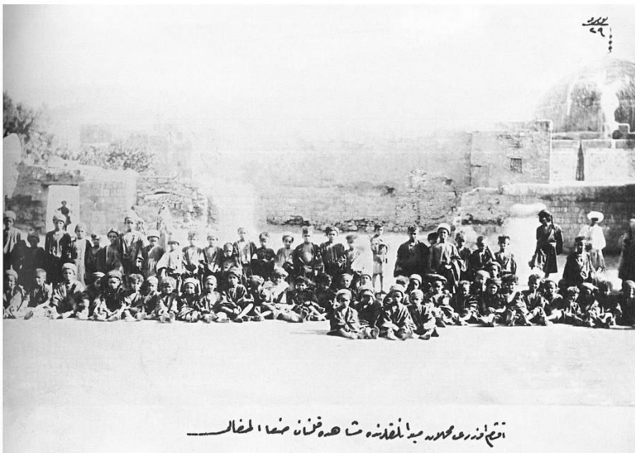
Resim 22. Yemen - Sana’lı Çocuklar (Eren, 2011, s. 8).

Solda duran çocuk; “Dikdörtgen” model formlu, “V” yakalı, kol boyu bilek ile dirsek arasında biten takma kollu ve boyu topukta biten cübbe giymiştir. Çocuk cübbenin içine; entari ve gömlek giymiştir. Gömlek; hakim yakalı, tek sıra kapamalı (ilik - düğme); entari ise “V” yakalı kol boyu bileğin biraz altında bitmiştir. Çocuk aksesuar olarak başa kefiye ve agel takmış; ayağa potin giymiştir.