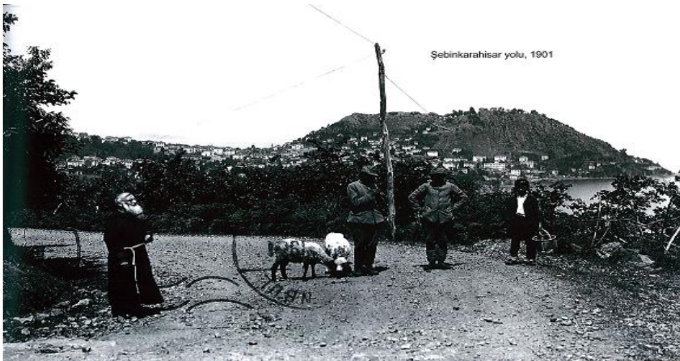
Resim 11. Çeken Fotoğrafçısı Bilinmeyen 1901 Yılında Çekilmiş Giresun Vilayeti Şebinkarahisar Yolunda Bulunan Çocuk (Derişoğlu ve Işık, 2011, s. 59).

Ortada ve sol tarafta bulunan çocuklar, “Dikdörtgen” model formlu, sıfır yakalı, tek sıra kapamalı (ilic - düğme) ve kol boyu bilekte biten takma kollu ceket ile “Şalvar” model formlu, ağı düşük, dar paça uygulanmış pantolon giymiştir. Ortadaki çocuğun giymiş olduğu pantolonun boyu dizde; soldaki çocuğun giymiş olduğu pantolonun boyu bileğin biraz üzerinde bitmiştir. Ortadaki çocuğun giymiş olduğu ceketin içine; sıfır yakalı ve tek sıra kapamalı (ilic - düğme), manşetli ve kol boyu bilekte biten takma kollu gömlekle giydiği görülmektedir. Ortada ve sol tarafta bulunan çocuklar, başa fes takmış ve fesin alt çevresine mendil yemeni dolanmıştır.