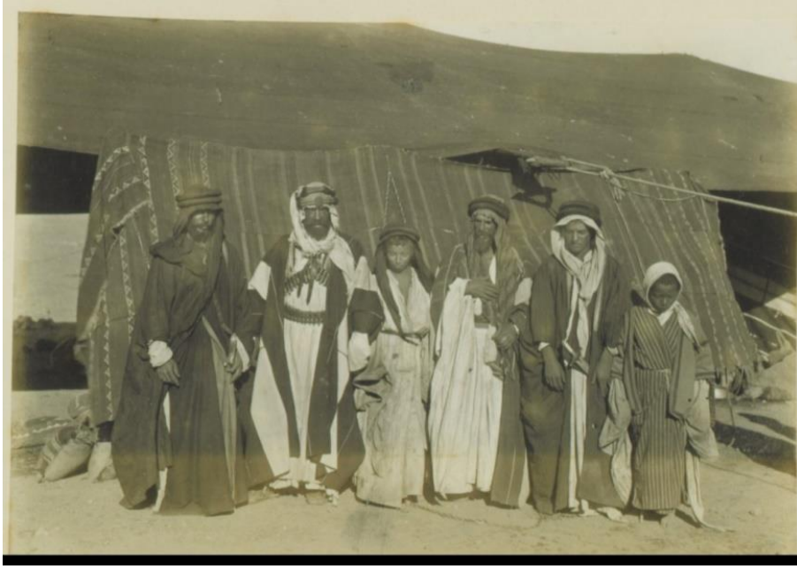
Resim 13. Sebaa Kabilesi'nin Şeyhi Butayn İbn Muşid ( Halep Vilayeti /).

Fotoğraf, Halep vilayetinin bir dış mekânında çekilmiştir. Fotoğrafta iki çocuk yer almaktadır ve çocukların birbirine benzer giysiler giydikleri ve yerel kıyafetleri içinde fotoğraflandığı görülmektedir.