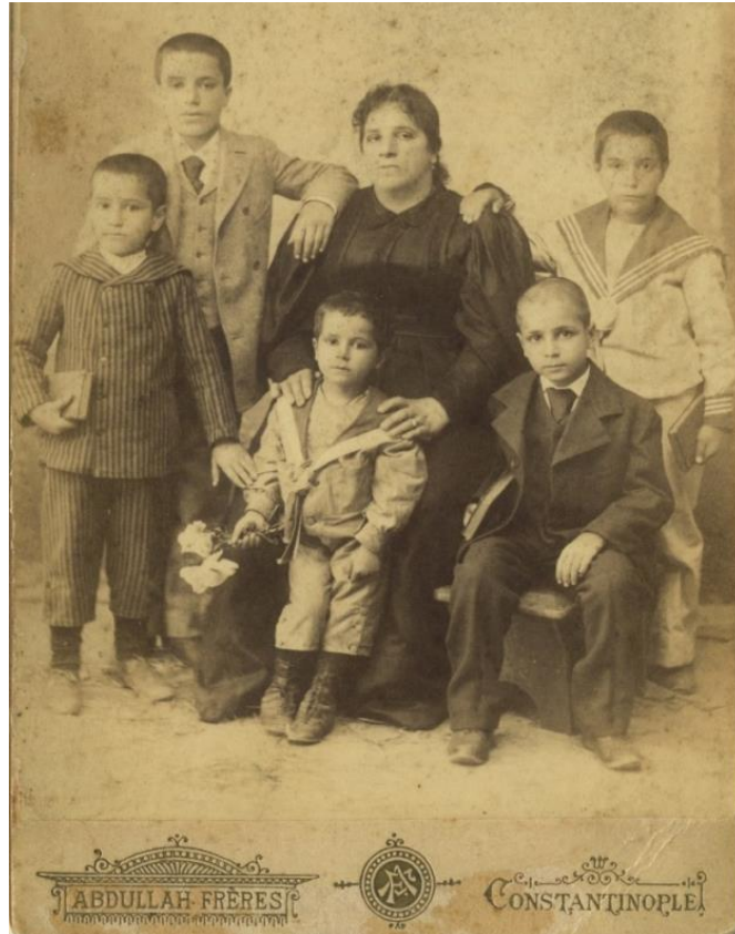
Resim 14. Abdullah Freres Tarafından Çekilmiş İstanbul Vilayeti Şehirli Çocukları (Ceranoğlu Özel Koleksiyonu, 2013).

Sağ taraftaki çocuk; “Dikdörtgen” model formlu, “V” yakalı, kol boyu yerde biten kollu, boyu yerde biten cübbe giymiştir. Çocuk aksesuar olarak başa kefiye ve agel; bele kemer takmıştır.