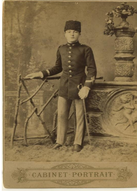
Resim 2. Setre - Pantolon giymiş çocuk.

Osmanlı Devleti'nin son zamanlarında İstanbul'daki varlıklı çevreler çocuklarının giyimine özen göstermiştir. Çocukların giyiminde; sipariş, özel seçim ya da hazır giyim söz konusudur ve "bahriyeli çocuk giysileri" moda olmuştur (Onur, 2005, s. 224). Koçu ve Akbay (1960, s. 13); 1828 doğumlu Aşçıdede Halil İbrahim'in setre - pantolon giydiğini belirtmiştir.