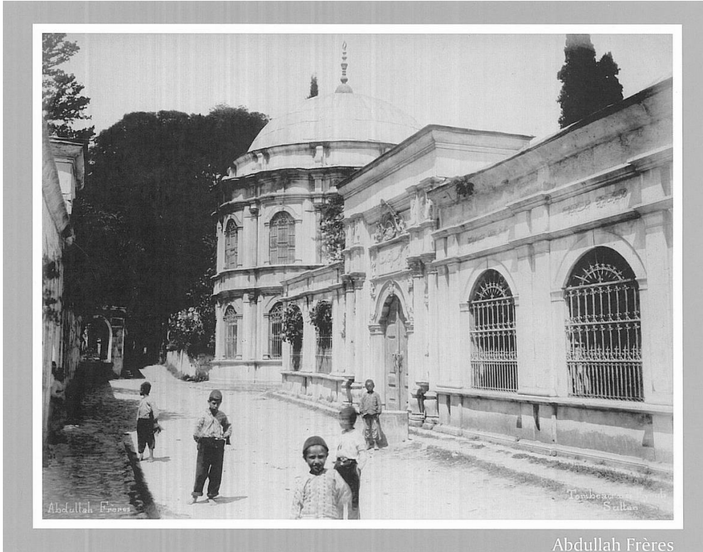
Resim 1. Sultan Türbeleri (Eyüp) Önünde Duran Çocuklar (Genç ve Çolak, 2007, s. 252).