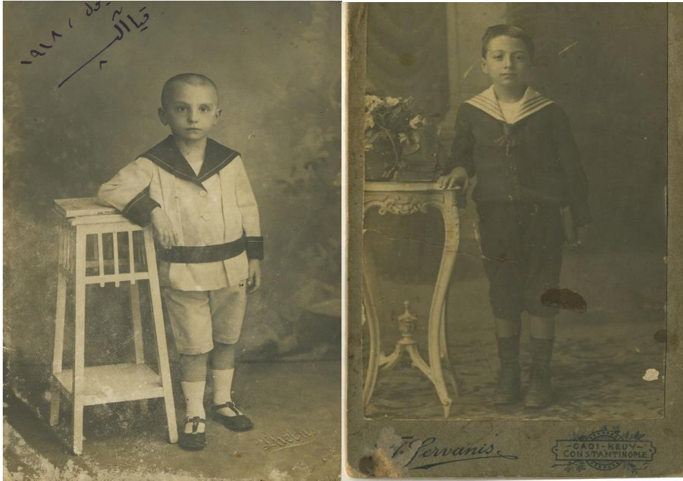
Resim 3 - 4. Bahriyeli bluz ve kısa pantolon giymiş çocuklar.

Sabah akşam bir Kürt uşağın denetim ve gözetiminde gidip geliyorum okula. Kısa pantolonluyum. İstanbul geleneğinden kalma bir alışkanlıkla. Oysa, Diyarbakır'da küçüğünden büyüğüne herkes uzun pantolonla dolaşmakta. Bana İstanbul çocuğu diyorlar.”