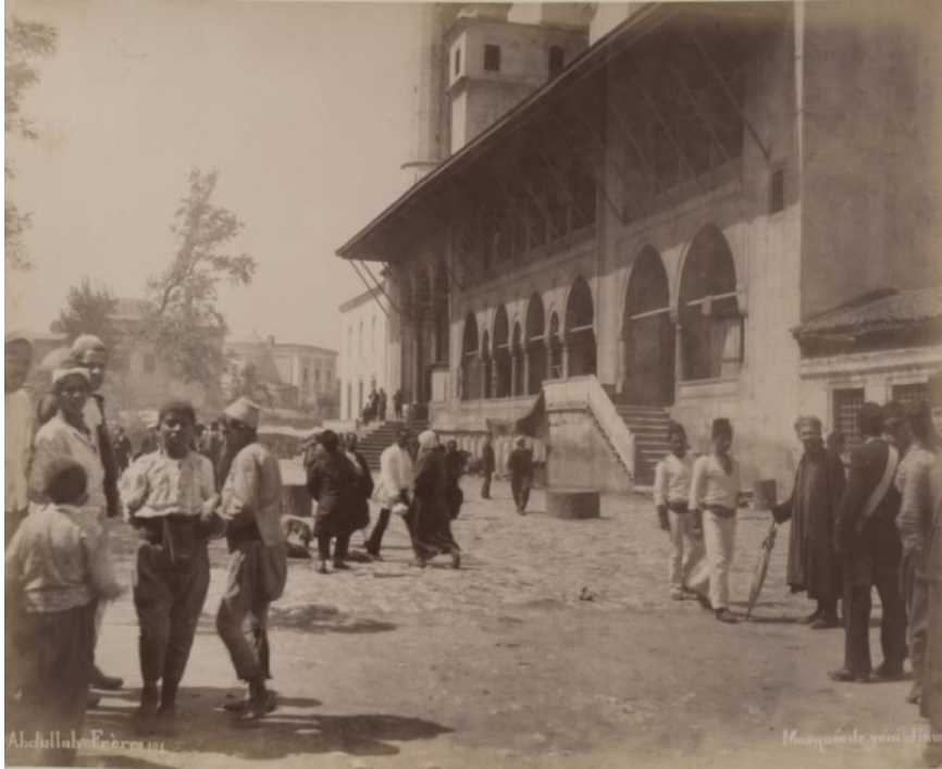
Resim 15. Abdullah Frères Tarafından Çekilmiş İstanbul Vilayeti Yeni Cami Avlusu'nda Bulunan Çocuklar.

Arkada sol tarafta duran çocuk; “Dikdörtgen” model formlu, bahriye (palet) yakalı, tek sıra (ilik - düğme) kapamalı, manşetli ve kol boyu bilekte biten takma kollar gömlek ile “Klasik” model formlu, ağı normal düşüklükte, normal genişlikte paça uygulanmış ve boyu bilekte biten pantolon giymiştir. Çocuk aksesuar olarak ayağa potin giymiştir.