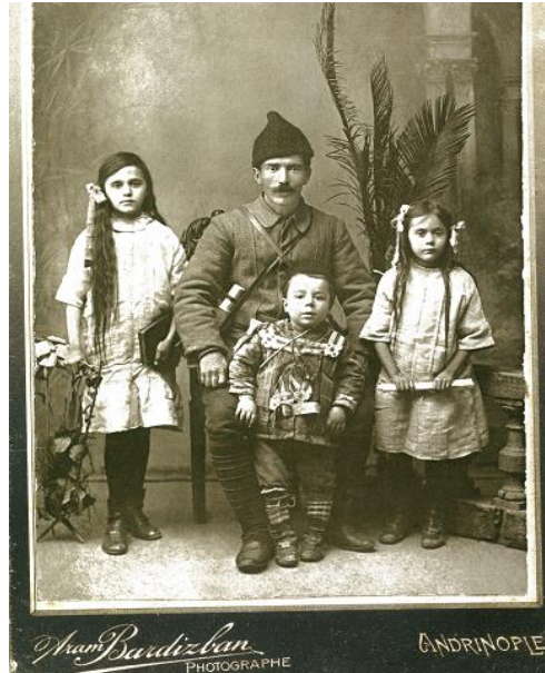
Resim 9. 1910 Yılı Edime Vilayetindeki Asker Baba ve Üç Çocuğu (Özendes, 2013: 64).

Çocuk; “Dikdörtgen” model formlu, sıfır yakalı, tek sıra kapamalı (ilik - düğme), manşetli ve kol boyu bilekte biten takma kollu gömlek ile “Şalvar” model formlu, ağı düşük, dar paça uygulanmış ve boyu dizde biten pantolon giymiştir. Çocuk başa fes; bele kuşak takmış ve ayağa çarık giymiştir. Çocuğun başına taktığı fesin alt çevresine mendil yemeni dolanmış ve mendil yemeni oya ile süslenmiştir.