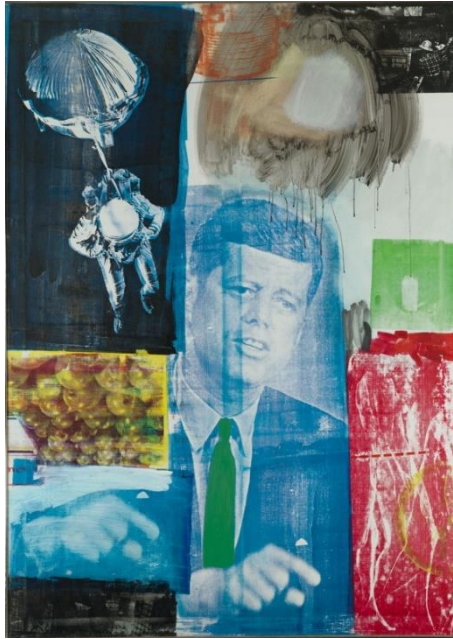
Resim 3. Robert Rauschenberg "Retroactive-I" Tuval Üzerine Yağ, Serigrafi ve Mürekkep Baskısı-1964

Rauschenberg, kariyerinin başlangıcından itibaren farklı teknikler ve her çeşit materyali kullanarak özgür ve deneysel çalışmalar yapmıştır. Örneğin; 1949'da modelini ışığa duyarlı bir proje kâğıdına yüz üstü yatırıp, dolgu ışığına boğarak etkileyici figür kompozisyonları yapmıştır. Başka bir çalışmasında John Cage'e, tekerleri mürekkeplenmiş Model A Ford'unu birbirine tutturulmuş 670 cm uzunluğundaki kâğıtların üzerinde sürdürerek 'Otomobil Tekerlek Baskısı' nı gerçekleştirmiştir. 1952'de yaptığı siyah resimlerinde, yırtık ve buruşuk gazete kâğıtlarını serip onların üzerinde yer alan yazıların gri değerlerinden yararlanarak çalışmalarını oluşturmuştur. Rauschenberg "resmin ilk fırça darbesi bile gri bir kelimeler haritasının üzerinde pozisyon alacaktır" sözleriyle kullandığı hazır nesnelere çalışmalarına yaptığı olumlu katkıyı vurgulamak istemiştir. Bunu izleyen kırmızı resimlerde, Rauschenberg kompozisyonlarında giderek daha fazla atık malzeme kullanmaya başlamıştır (Fineberg, 2014:168-169).