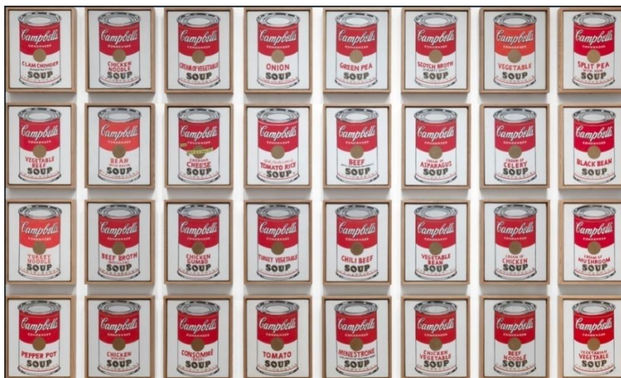
Resim 6: Andy Warhol “Campbell’s Soup” Serigrafi Baskı- 1968 (Wikiart-2019)

Andy Warhol, serigrafileri ve sayısız özgün çoklu ortam yapıtını içeren çalışmalarıyla 1960’ların Pop Art hareketine ivme kazandırmayı başarmıştır. Cesur serigrafileri, Brillo kolileri ya da Campbell konserve kutuları gibi seri üretilen bilindik ürünleri alıp birer sanat eseri olarak sunmuştur.