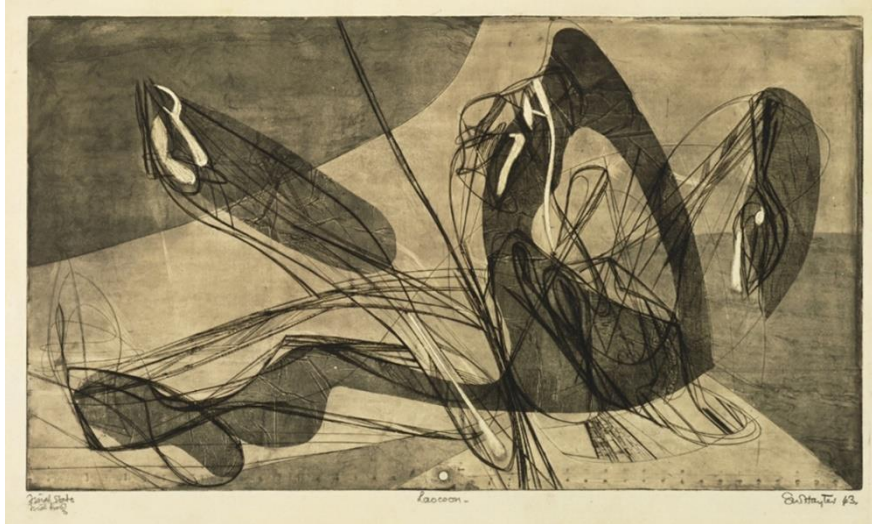
Resim 2. Stanley William Hayter “Laocoön” Engraving and Etching-1943

1920’lerde Avrupa’da ortaya çıkan gerçeküstücülük ile sanatçılar, gerçek ve bilinçdışı imgeleri bir araya getiren bir anlayış ile gerçeküstü eserler üretmişlerdir. Bu dönemde estetik kurallardan bağımsız, otomatik bir biçimde yapılan sanatsal çalışmalar görülmeye başlanmış ve İngiliz sanatçı Stanley William Hayter tarafından gravür tekniğine uyarlanmıştır (Tallman, 1996:178). Teknikler ve malzemeler üzerindeki deneysel arayışlar, baskı sanatlarındaki olanakları ve görselliği arttırmıştır. 20. yüzyılda sanattaki yenilik arayışları Avrupa’dan sonra Amerika’da da görülmüş, sanatta büyük çaplı değişimler meydana gelmiştir.