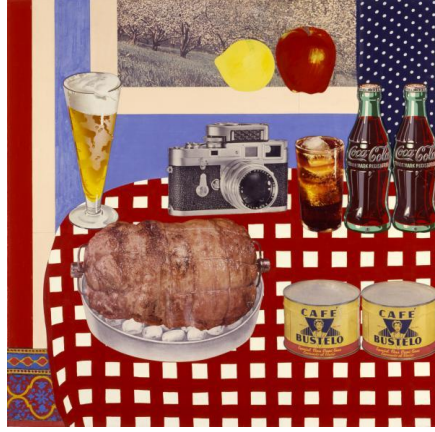
Resim 5: Tom Wesselmann “Still Life”Sunta Üzerine Akrilik, Kumaş Kolajı, Fotogravür, Metal vb. Malzemeler-1962 (americanart-2019)

Şüphesiz ki serigrafi (ipekbaskı) tekniğinin, endüstri kültürüne özgü üslubu ile dünya ülkelerine tanıtılmasında, Pop Art akımının en önemli temsilcilerinden kabul edilen ve “Herkes bir gün 15 dakikalığına ünlü olacak” sözü ile sanat literatürlerindeki yerini almış, Amerikalı sanatçı Andy Warhol’un (1928-1987) katkıları büyüktür.