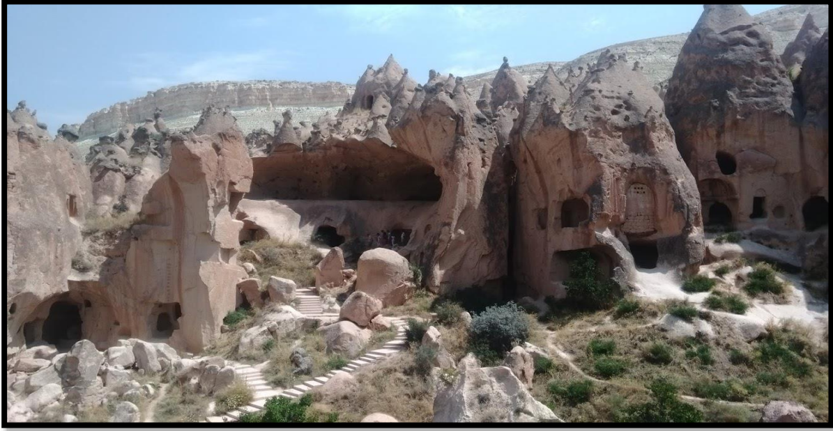
Şekil 7 Zelve Açık hava Müzesi (Orijinal, 2015)