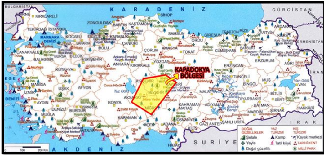
Şekil 1 Kapadokya Bölgesi (URL 1, 2018)