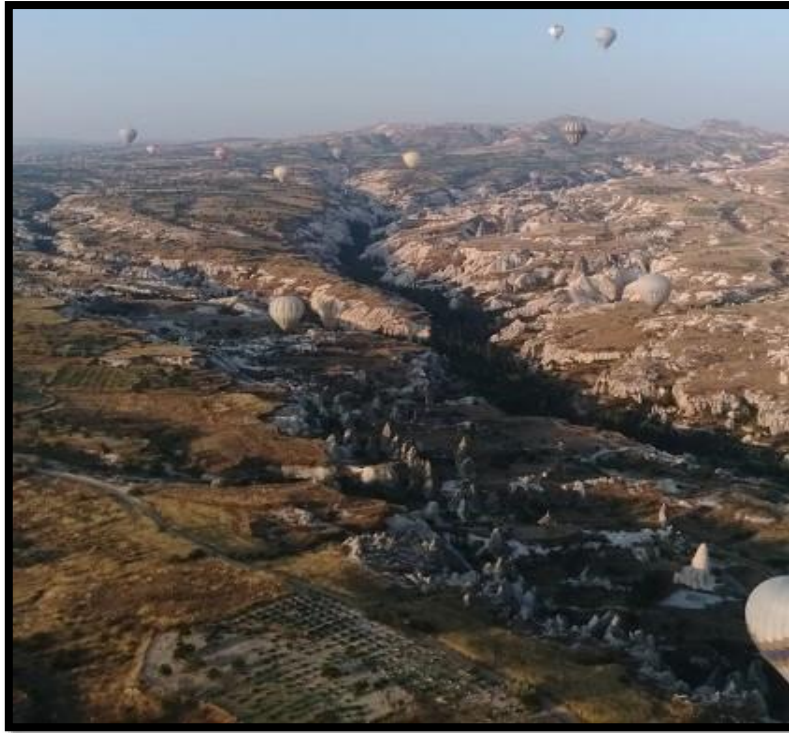
Şekil 6 Kapadokya Bölgesi -Vadi- (Orijinal, 2015).

Herhangi bir yerleşim yerinin coğrafi konumu, topografik özellikleri, kültürel yapısının yansımalarının oluşturduğu mekânsal organizasyon ile yerleşimin yerel peyzaj özellikleri ve kimliği ortaya çıkmaktadır. Kapadokya Bölgesi'nin yerel peyzajı, coğrafi konumu ve jeolojik devirlerdeki volkanik faaliyetler sebebi ile sahip olduğu fiziksel çevre üzerinde bölgede yaşamış olan farklı uygarlıkların kültürel kalıntıları ve etkileşimleri sonucu oluşmuştur (Şekil, 4-5).