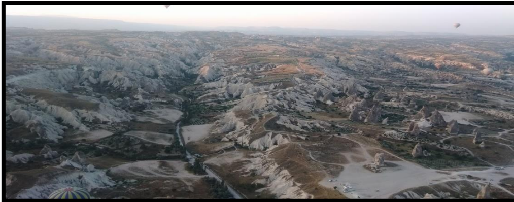
Şekil 4 Kapadokya Bölgesi (Orijinal, 2015)

Polat ve Güney (2013)’e göre; volkanik dağlar olan Erciyes, Hasan ve Melendiz dağlarının ortasında yer alan (Şekil 1) Kapadokya Bölgesi, yıllar boyunca bu dağlardan püsküren lavlar ile “Ürgüp Formasyonu” olarak adlandırılan ve tuf, tüfit ignimbrit, kumtaşı, kıltaşı, kalker ve marnlardan meydana gelen bir örtü ile kaplanmıştır. Kalınlığı 400 metreyi bulan bu örtüdeki her bir katman farklı kimyasal özelliklere sahiptir. Bu durum nehir, sel ve yağmur suları ile kar ve fırtına gibi aşınmaya neden olabilecek doğal afetlerin her bir katmanı farklı oranda aşındırmasına neden olmuş ve “peribacaları” olarak adlandırılan coğrafi şekiller ve özgün doğal değerler oluşmuştur (Macit-Erdal, 2018). Bu doğal oluşumlar bölgenin geleneksel mimari yapısının oluşumunda yönlendirici olmuş ve kaya oyma strüktür olarak inşa edilen ev, kilise, ambar, şapel gibi yapılar ve yeraltı şehirleri bölgenin yerel peyzajının mimari karakterini belirlemiştir.