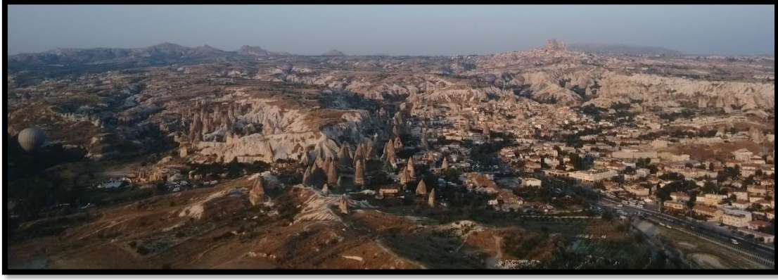
Şekil 5 Kapadokya Bölgesi (Orijinal, 2015)

Herhangi bir yerleşim yerinin coğrafi konumu, topografik özellikleri, kültürel yapısının yansımalarının oluşturduğu mekânsal organizasyon ile yerleşimin yerel peyzaj özellikleri ve kimliği ortaya çıkmaktadır. Kapadokya Bölgesi'nin yerel peyzajı, coğrafi konumu ve jeolojik devirlerdeki volkanik faaliyetler sebebi ile sahip olduğu fiziksel çevre üzerinde bölgede yaşamış olan farklı uygarlıkların kültürel kalıntıları ve etkileşimleri sonucu oluşmuştur (Şekil, 4-5).