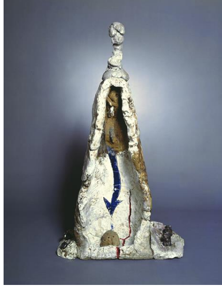
Görsel 5: Robert Arneson, Sıçılan Yer, (The Pisser), 1963, h:129.cm