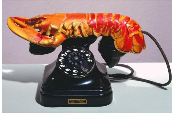
Görsel 8: Salvador Dali, Istakoz Telefon, 1936, Siyah Telefon ve Alçı, 17,8x 33x 17,8 cm.

Katalonya doğumlu sanatçı Salvador Dali (1904- 1989), farklı sanat disiplinlerinde 1500'den fazla eser üretmiştir. Sürrealist sanatçı eserlerindeki çarpıcı etkiyle tanınmaktadır ve 1936'da koleksiyoner Edvard James için ürettiği "İstakoz telefon" adlı eseri de gündelik nesnelere hem görüntüsünü hem de kendisini kullanarak yeni, farklı ve gerçeküstü bir ifade yaratmıştır. Cinsel anlamlandırmayı istakozla ifade ettiği eseri, Tate müzesi koleksiyonunda bulunmaktadır. Teknolojik ürünlerin sanatta yer alması şüphesiz kaçınılmaz bir durumdur. Salvador Dali'nin eserinde hazır nesne telefon kullanımı, adeta sanatın sonsuzluğunu sorgulatmaktadır.