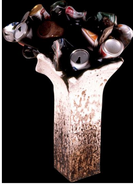
Görsel 13: Kemal Uludağ, Düşünce Diye Üretilenler, Karışık Teknik, 1990, 60x 60x 40 cm.