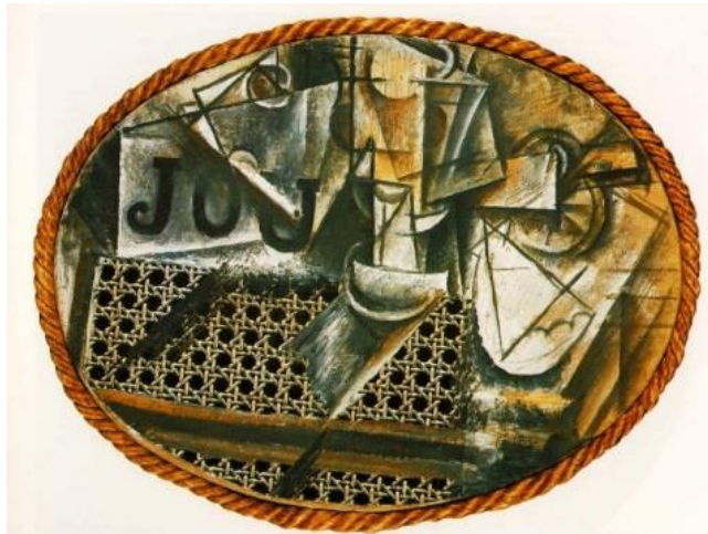
Görsel 4: Pablo Picasso, 1912, Bambu Sandalyeli Ölüdoğa, Kolaj

Sanatta alternatif malzeme kullanımı ilk olarak 1912’de Pablo Picasso ile başlamıştır. Örneğin ünlü “Bambu Sandalyeli Ölüdoğa” isimli kolaj çalışmasında, duvar kağıtları, gazete kağıtları, bambu ve halat gibi alternatif malzemeler kullanmış ve bu malzemeleri sanat eseri haline dönüştürmüştür. Kübizmin öncülerinden olan Braque’ın sonra da Picasso’nun resimlerinde dokuyu zenginleştirmek üzere boyalarına talaş ve kum kattığı da bilinmektedir. Sentetik Kübizm olarak adlandırılan bu dönemde; renk ön plana çıkmış, soyutlama artmış ve doğayı alternatif malzemelerle ifade etme serüveni başlamıştır.