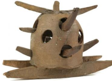
Görsel 1: Peter Voulkos, Rocking Pot, 1956