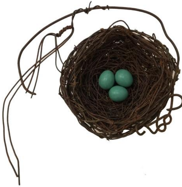
Görsel 10: Phil Lichtenhan, Yuva, Turkuaz Seramik Yumurta ve El Dokuma Tel, 41x 25x 13 cm.

Çağdaş seramik sanatçıları arasında, nesnelere asıl görevlerinden alıkoyup, seramik ile birleştirenler bulunmaktadır. Seramikte alternatif malzeme kullanımı denilince buluntu malzemeler de düşünülebilir. Phil Lichtenhan da “Yuva” temalı eserlerini üretirken seramikleri ile birlikte kullandığı metal malzemeleri buluntulardan temin etmektedir.