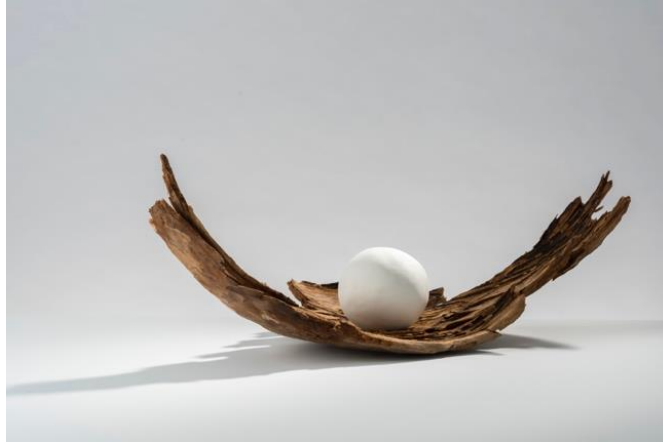
Görsel 9: Tracy Dickason