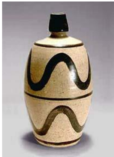
Görsel 2: Bernard Leach, Seramik Vazo