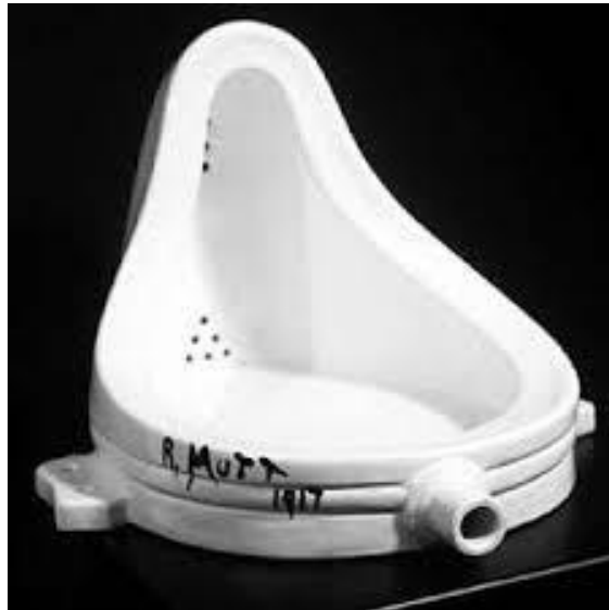
Görsel 6: Marchel Duchamp, Çeşme, (Fountain), 1964 (1917’deki orjinalin kopyası).