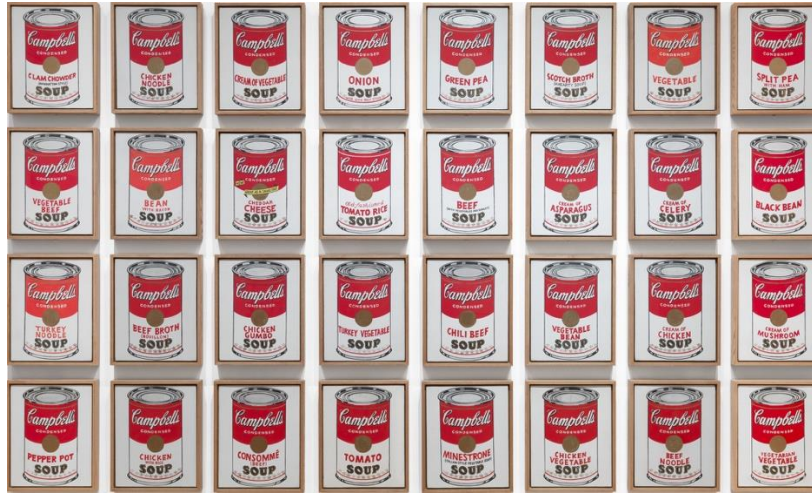
Görsel 12: Andy Warhol, (1928- 1987), Campbell's Soup Cans, 1962

Pop Art sanat anlayışı Post-Modernizm'in erken dönemi olarak görülebilmektedir. Amerikalı sanatçı Andy Warhol, 1962'de Marilyn Monroe'nun ölümünden kısa bir süre sonra ürettiği, Marilyn görsellerinin birim tekrarları ile oluşturduğu yapıtında, bireylerin kopyalanmış görüntülerinin "ölümsüzlük" ile bağlantısını sorgulamaktadır.