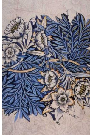
Görsel 3: William Morris, 1873, Pencil and Watercolor sketch for print design

Endüstri devrimin el sanatlarını olumsuz etkilediği dönemde, üretim piyasaları yeniden canlandırmayı hedeflenmiş, Arts and Crafts Avrupa’da ve Amerika’da da kendini göstermiştir. Fabrika üretimine karşı bu akımın öncülerinden biri William Morris’dir ve geleneksel şekillendirme yöntemleri ve teknikleri ile el sanatlarının sürekliliğine dikkat çekmeye çalışmıştır (Aslan, 2014, s.11). William Morris ve Arts and Crafts hareketini benimseyen Bernard Leach, Çağdaş seramik sanatı için bir ekoldür ve oldukça önemli bir yere sahiptir. Seramiğin günlük kullanım eşyası dışında, bir sanat eseri olarak da görülebilmesini sağlamıştır.