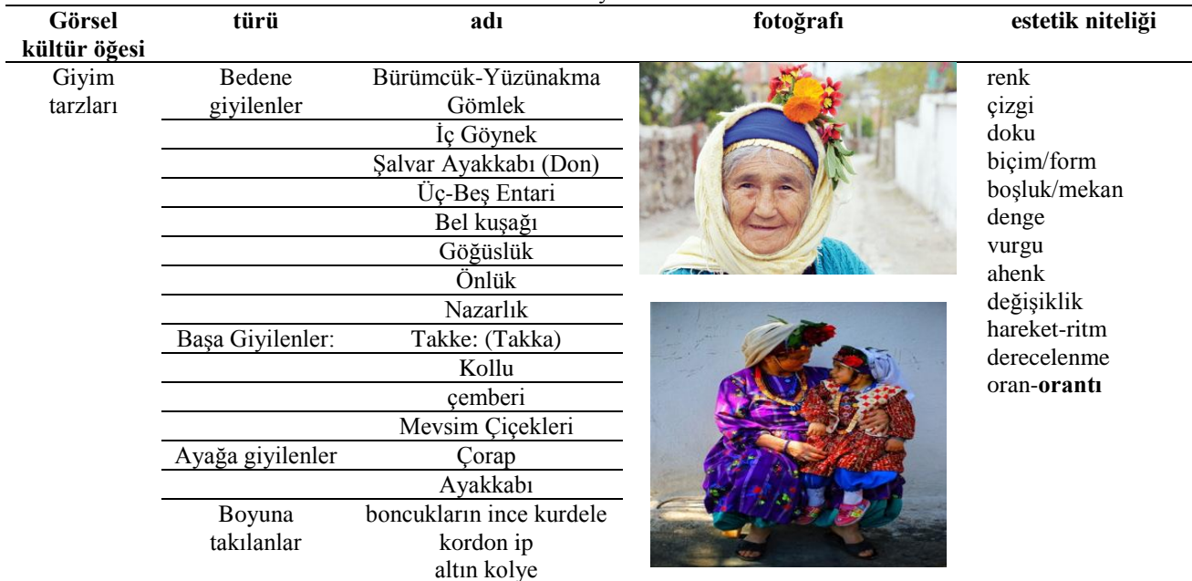
Tablo 3: Giyim Tarzları

a.“Estetik değerlerin aktarımı nasıl yapılmaktadır?” a ait olarak tablo 3,4,5 te giyim tarzları, mimari süslemeler, bezbebekler şeklinde 3 ayrı grup oluşturularak sunulmuştur.