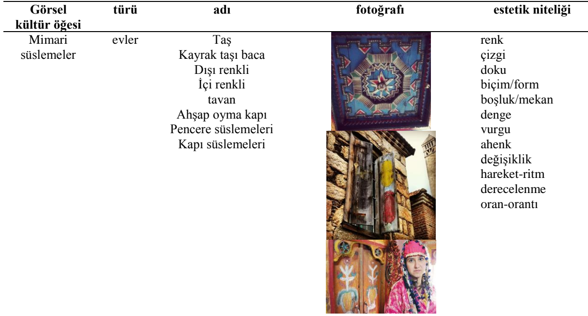
Tablo 4: Mimari süslemeler

Mimari süslemelerde de evler ön plana çıkmaktadır. Onlar da sanatsal düzenleme eleman ve ilkeleri kullanılarak düzenlenmiş ya da süslenmişlerdir. Evlerin özellikle kapıları, pencerelerin dekoratif süslemeler bulunmaktadır. Ayrıca tavan süslemeleri de belirgin ev süslemeleri içinde yer almaktadır.