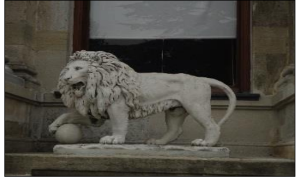
Şekil 3. Beylerbeyi Sarayı, Harem Girişi, “Top Tutan Aslan” (Orijinal 2012)