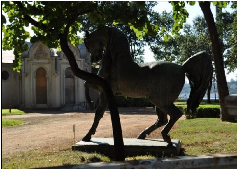
Şekil 11. Beylerbeyi Sarayı, "Şaha Kalkmış Özgürlük Atı" (Orijinal, 2012)

P. Rouillard ve çalışma arkadaşı Louis Doumas de Toulon'un imzasını taşımaktadır. Doumas'ın esere katkısı büyüktür. 1864'te Thiébaud dökümhanesinde üretilmiştir. Aynı dönemde yapılan ve saray bahçelerinde yer alan hayvan heykellerinden biri Beylerbeyi Sarayı'nda, Ahır Köşkü'nün önünde yer alan "şaha kalkmış özgürlük atı" olarak bilinen bronz döküm at heykelidir. Sultan Abdülaziz'in kendi atının model olduğu rivayet edilmektedir.