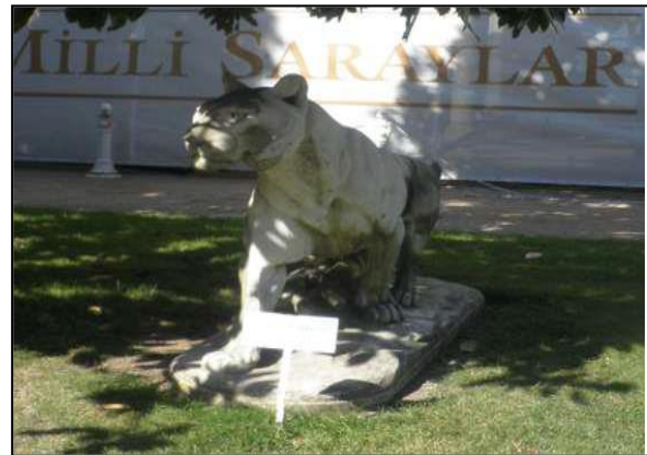
Şekil 2. Selamlık Bahçesi “Oklu Kirpi Tarafından Yaralanmış Kaplan”, “Yürüyen Kaplan Kral” heykeli (Orijinal, 2014).