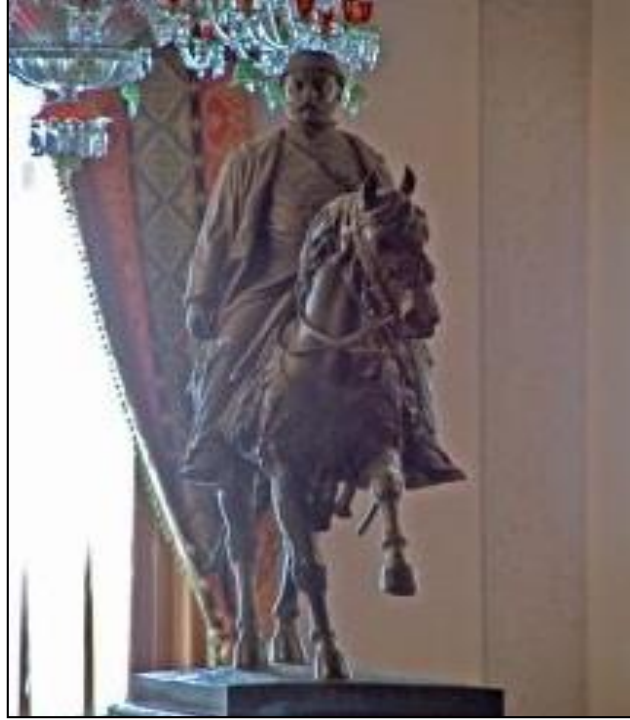
Şekil 12. Beylerbeyi Sarayı, Havuzlu Salon Sultan Abdülaziz Heykeli (Orijinal 2014).