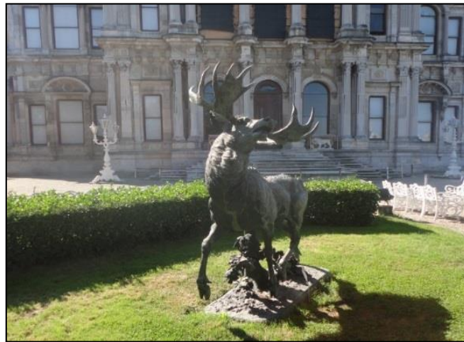
Şekil 9. Beylerbeyi Sarayı, Harem Bahçesi, Geyik Heykeli (Orijinal, 2012)

1864 tarihli ve yine Pierre Louis Roillard atölyesinde yapılan diğer geyik figürü ise kalın çatallı boynuzları ve kıvrımlı tüyleri ile tasvir edilmiştir. Heykelin üzerinde tek imza olduğu için döküm ustası ile heykeltıraşın aynı kişi olabileceği düşünülmektedir.