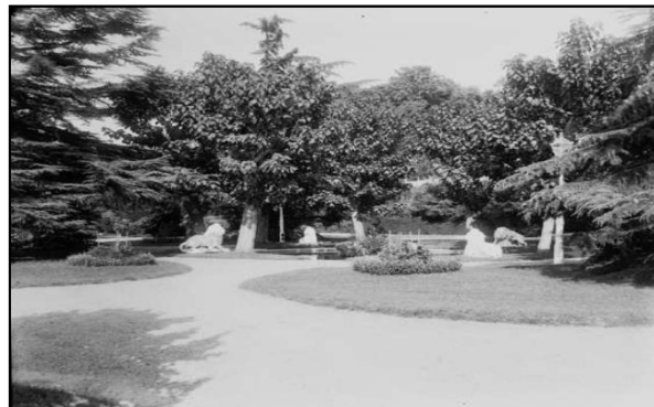
Şekil 5. 1900’lu Yılında Sebah & Joallier Çekilen Fotoğraf (Aliasghari, 2016, s.340)