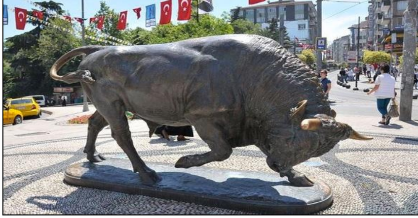
Şekil 14. Dövüşen Boğa