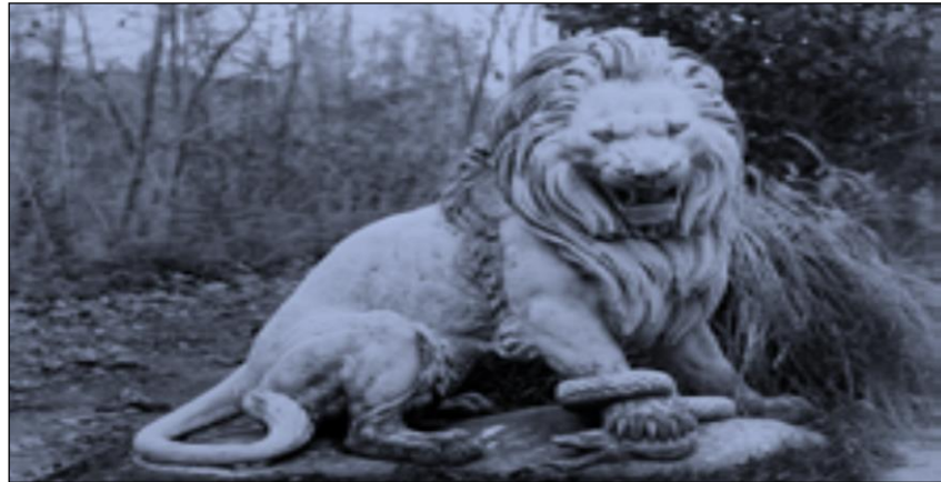
Görsel 16. Yılan Üstündeki Aslan (Atalay Seçen, 2011,s.28)

Tarihi belgelere göre; Pierre Louis Rouillard ve Delabierre imzasını taşıyan bu heykel en son Beykoz Kasrı bahçesinde yer almıştır, bugün ise nerede olduğu bilinmemektedir. Özgün bir çalışma olup diğer örneklerden farklı bir nitelik taşımaktadır.