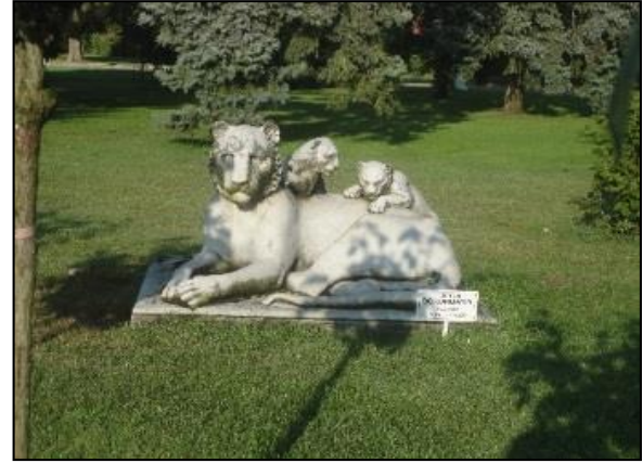
Şekil 6. Dolmabahçe Sarayında Yer Alan mermer Heykeller (Orijinal, 2015)