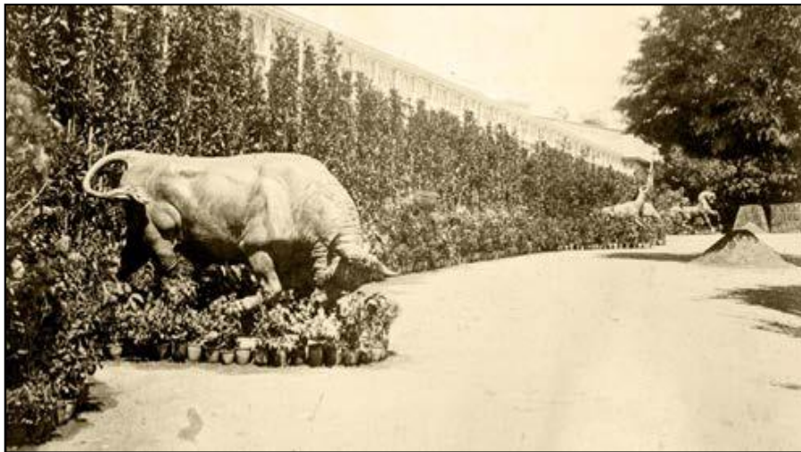
Şekil 13. Dövüşen Boğa (Atalay Seçen, 2011, s.33)

Bu heykel P. Rouillard, Isidore Bonheur ile birlikte çalışılmıştır. Bonheur'un çalışmadaki emeği ise oldukça fazladır. Heykel 1864 yılında Thiébaud dökümhanesinde üretilmiştir. 1865'te İstanbul'a getirildiğinde ilk olarak Beylerbeyi Sarayı'nın bahçesine yerleştirilmiştir. Sonraki yıllarda Yıldız Sarayı'nın bahçesine nakledilmiş, daha sonra 1969 yılında Bilezikçi Çiftliği'ne, daha sonra da Gazi Ahmet Muhtar Paşa Köşkü'nün bahçesine taşınmıştır. 1969 yılında ise Kadıköy Meydanı'nda Belediye Başkanlığı binasının önüne nakledilmiştir. Bugün, Dövüşen Boğa heykeli Kadıköy Meydanı'nda varlığını sürdürmektedir.