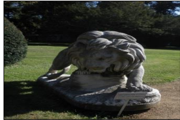
Şekil 4. Beylerbeyi Sarayı, Birinci Set, “Dinlenen Aslan”, “ Kayalıkta Pusu Kurmuş Aslan” (Orijinal, 2012)