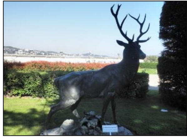
Şekil 8. Beylerbeyi Sarayı, Harem Bahçesi, “ Dinleyen Geyik” (Orijinal, 2012)