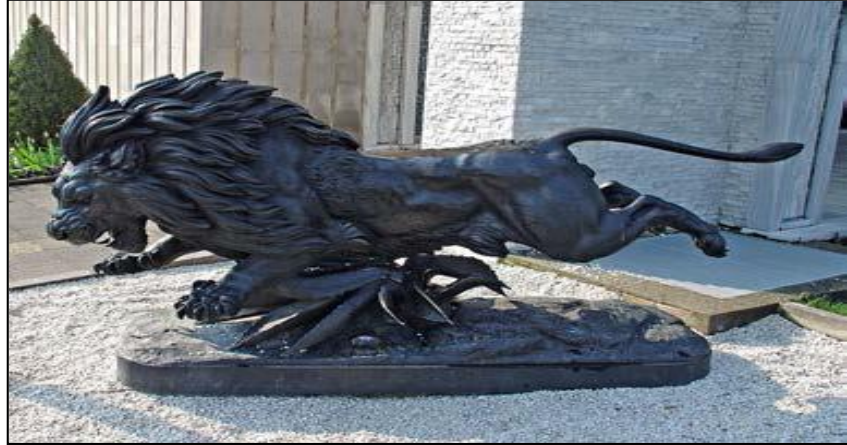
Şekil 15. Bir Kaktüs Üzerinden Zıplayan Aslan (Atalay Seçen, 2011, s.25)

1864 Thiébaud üretilmiş olan bu heykel Pierre Louis Rouillard'ın imzasını taşımaktadır. Bugün Şehzadebaşı Caddesi'nde bulunan Büyükşehir Belediyesi yanındaki parkta yer almaktadır.