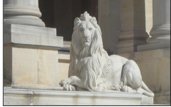
Şekil 1. Beylerbeyi Sarayı, Selamlık girişi, “Dinlenen Aslan Kafası Sağa”, “Dinlenen Aslan Kafası Sola” (Orijinal, 2012)