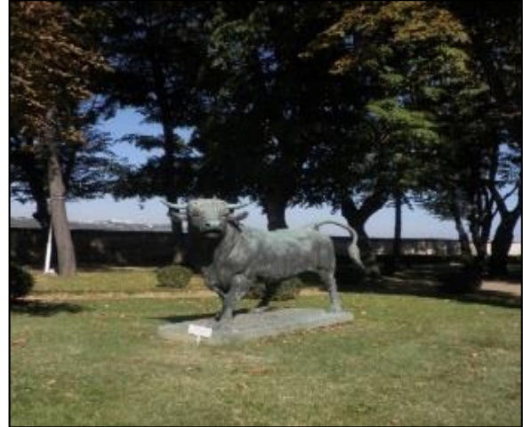
Şekil 10. Beylerbeyi Sarayı Dördüncü Set Bahçesi (Orijinal, 2015)