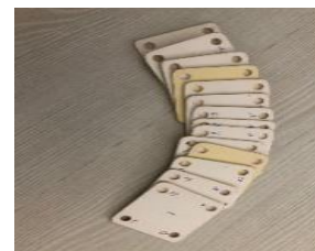
Şekil 1. Fatime Günay ve Ayşe Yıldırım'a ait çarpanalar