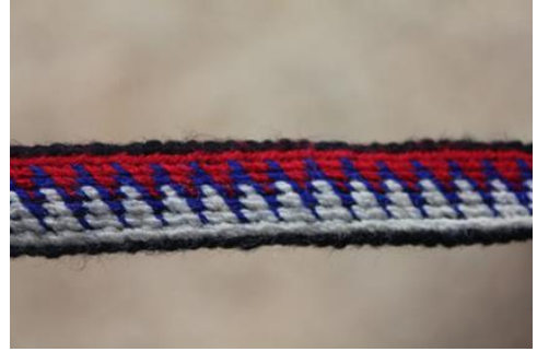
Şekil 9. Şerife Arıkan'a Ait Dişeme Motifli Kolan

Kompozisyon Özellikleri: Dokumanın kompozisyonu kırmızı ve beyaz zeminde mavi renkli ip ile oluşturulan dişeme motifinden meydana gelmektedir. Desen siyah atkı ile tamamlanmaktadır.