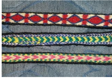
Şekil 16. Ayşe Nuray Günay'a Ait Tekli Yeleğdi Motifli Kolanlar

Kompozisyon Özellikleri: Dokumaların deseninde pembe, yeşil, sarı renkli yeleydi motifleri kullanılmıştır.