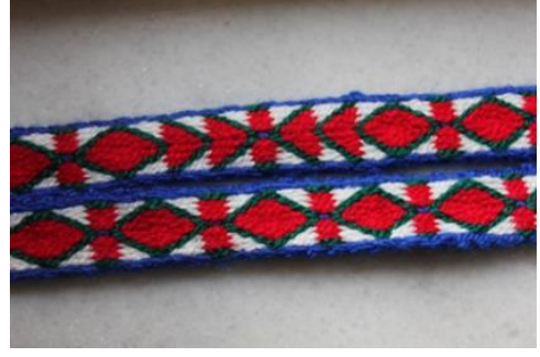
Şekil 8. Şerife Arıkan'a ait Göz motifli kolan

Kompozisyon Özellikleri: Eşkenar Dörtgenlerden oluşturulmuş göz motifleri kullanılmıştır.