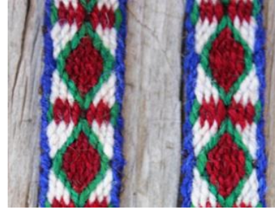
Şekil 6. Zahide Akdoğan'a Ait Göz Motifli Kolan

Kompozisyon Özellikleri: Dokumada desen art arda gelen ve kırmızı renkli eşkenar dörtgenin yeşil renkli ip ile kontürle çevrelenen göz motifiyle oluşturulmuştur. Atkı ipi olarak mavi ip kullanılarak kompozisyon tamamlanmıştır.