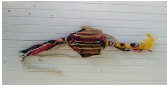
Şekil 5. Göz motifine ait dokuma fakısı

Kolanda dokunulacak olan motif örneğine fakı denilmektedir (Şekil 5).