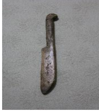
Şekil 2. Kılıç

Çözümler arasından geçen atkı ipliğini sıkıştırmak için kullanılır (Şekil 2).