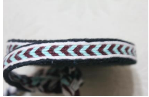
Şekil 14. Rukiye Yıldırım'a Ait Yeleydi Motifli Kolan

Kompozisyon Özellikleri: Dokumada beyaz zeminde mavi ve mor renkli yeleydi motifi kullanılarak kompozisyon oluşturulmuştur. Siyah renkli atkı ile kompozisyon tamamlanmıştır.