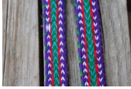
Şekil 17. Ayşe Nuray Günay'a Ait Üçlü Yeleğdi Motifli Kolan

Kompozisyon Özellikleri: Kompozisyon açık ve koyu yeşil, mavi, kırmızı renklerin kullanıldığı yeleydi motiflerinin art arda yerleştirilmesiyle oluşturulmuştur.