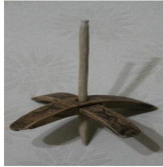
Şekil 4. Kirman

Kullanılan yüne büküm vermek, eğirmek ve iplik haline getirmek için kullanılan, orta eksen çubuğu ve buna geçirilen iki tahta kanat parçasından meydana gelen alettir (Şekil 4).