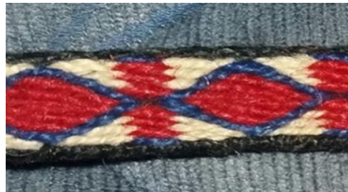
Şekil 7. Fatime Günay'a Ait Göz Motifli Kolan