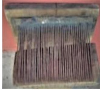
Şekil 3. Tarak

Tarama işlemi geleneksel olarak evlerde tahta bir gövdeden ve demir dişlerden oluşan tarak ile yapılır. Demir dişlere geçirilen yün iki elle karşılıklı çekilerek tekrar tekrar taranır (Şekil 3).