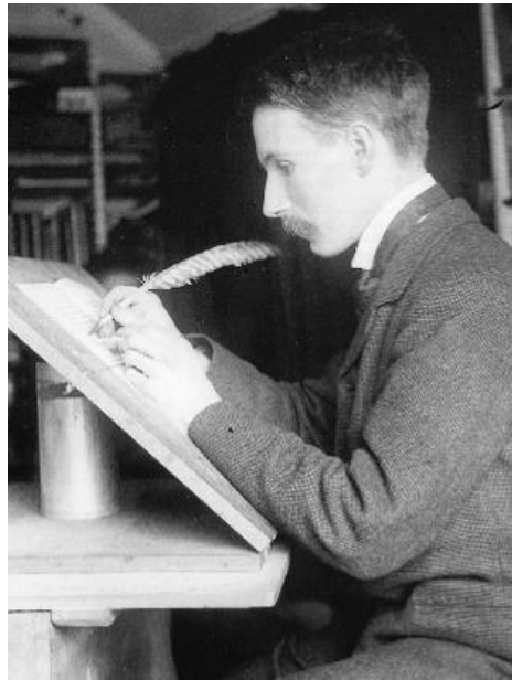
Resim 1. Edward Johnston- 1903

Edward Johnston (1872-1943), 11 Şubat 1872’de Uruguay’da doğdu. Ailesi 1873’te Amerika’ya, ardından 1874 yılında İngiltere’ye taşınmıştır. Annesi hasta olduğu için Johnston teyzesi tarafından büyütülmüştür. Bu dönemde süslü el yazmalarına ilgi duymuş birçok tasarım yapmıştır. Bu dönemde yapmış olduğu çalışmalar ileride bütün dünyayı etkileyecek bir hamlenin başlangıcı olmuştur. 1891 yılında annesinin ölümüyle birlikte Essex’de çalışan amcasının yanında çalışmaya başlamıştır. Bir süre Edinburgh Üniversitesi’nde tıp eğitimi almıştı. Ancak 1895 yılında yazı sanatı ile ilgili çalışmalar yapmak için tıp eğitimini yarıda bırakmıştır (Jackson, 1981) (URL1).