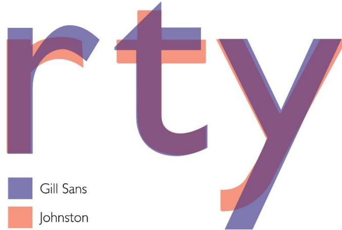
Resim 4. Jonston Sans Serif ve Gill Sans r, t, y, harflerin arasındaki farklar (URL4)