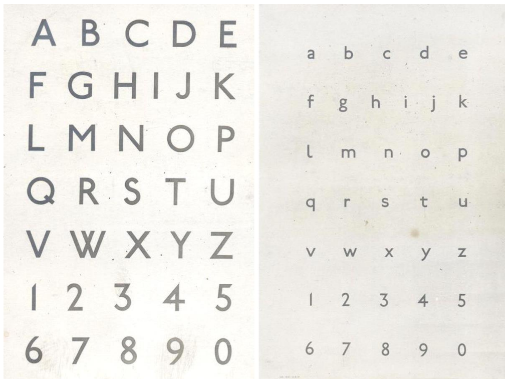
Resim 3. Johnston Type, 1917 (URL1)

Johnston, 1913 yılında Londra Metrosu Grubu Ticari Müdürü Frank Pick ile tanışmıştır. Bu buluşmada Pick, Johnston'dan Metro için standart bir blok yazı yazmasını ve Londra Metrosu'nun “bullseye” sembolünü tasarlamasını istemiştir (URL1). Johnston, tasarladığı sans serif yazı karakterinin ilk örneklerini 1916 yılında sunmuştur.