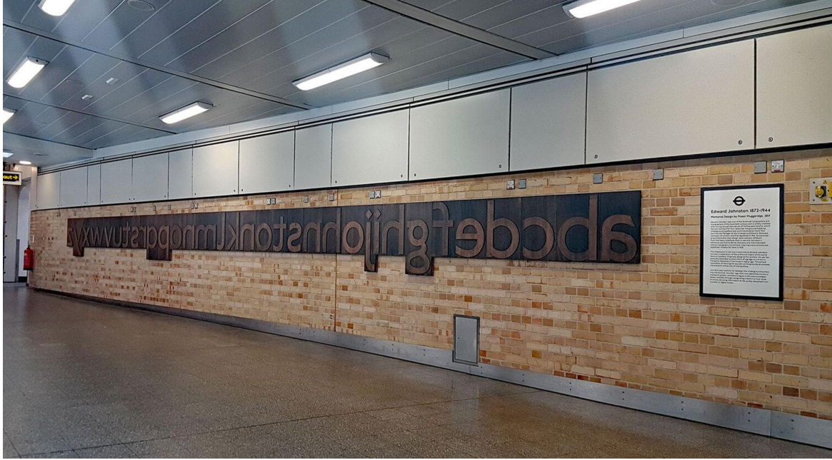
Resim 6. Edward Johnston Anıtı – Londra Farringdon Metro İstasyonu

Edward Johnston, 1943 yılında Ditchling'de öldü ve St. Margaret's Kilisesi bahçesine gömülmüştür. Ölümüne kadar yazı sanatından hiç kopmamıştır. 24 Haziran 2019 tarihinde Edward Johnston ve ürettiği sans serif yazı karakteri için Londra'da bulunan Farringdon İstasyonu'nda bir anıt dikilmiştir (Transport For London, t.y.).