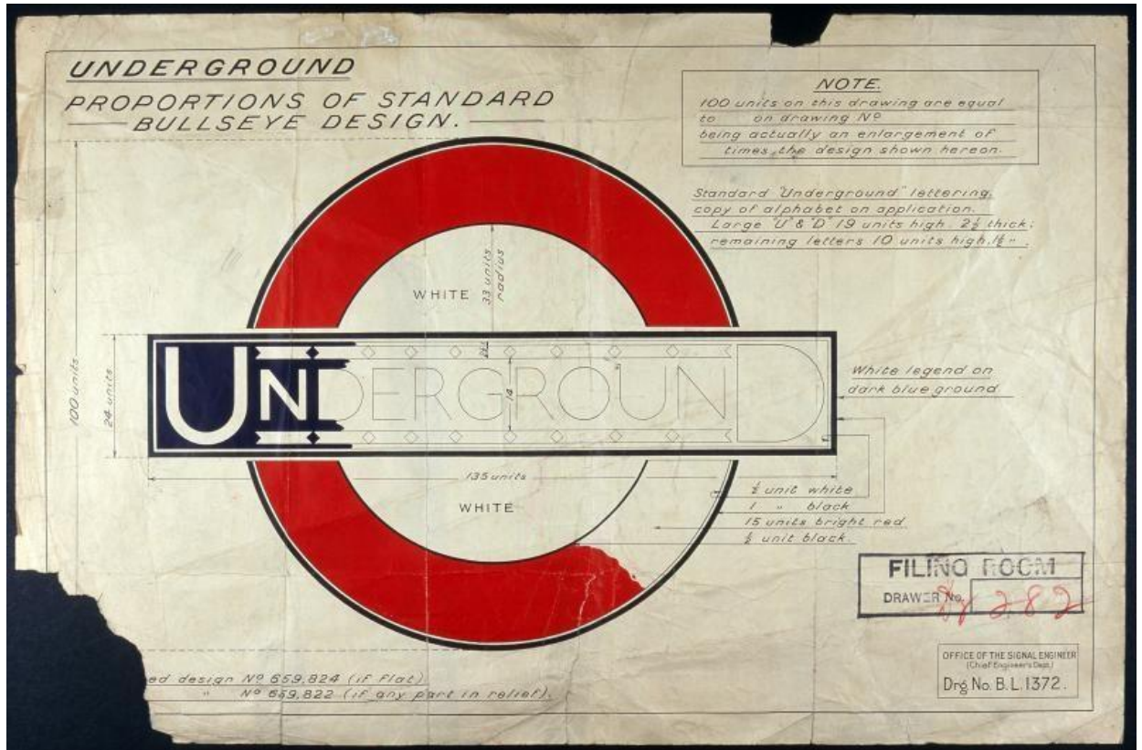
Resim 5. Edward Johnston'ın 1925'te Underground Bullseye için yaptığı tasarım (URL1)

1916-17'nin başında Pick, Johnston'dan 1908'de ilk kez yapmasını istediği "bullseye" logosu da dahil olmak üzere Yeraltı Grubu için ticari markaları yeniden tasarlamasını istemiştir. Johnston, bugün hala kullanılan tasarımları oluşturmuştur. Günümüzde Londra Metrosu tarafından kullanılan amblem ve fontlar, küçük revizyonlar yapılarak günümüze kadar gelmiştir. Farklı ulaşım araçları farklı renklerde kullanılmaktadır (Hyland ve Bateman, 2011).