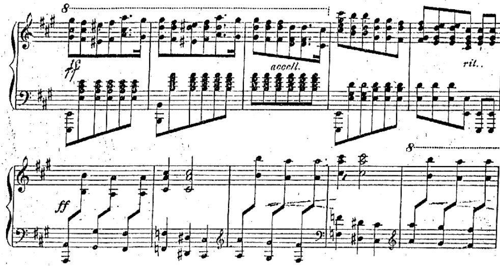
Şekil 5. Ponce, “Balada Mexicanas” ölçü 237-246.

1925 yılında Paris’e Paul Dukas’la çalışmaya giden besteci, neoklasizm, empresyonizm ve politonalite’nin etkisiyle yepyeni tekniklerle deneyler yapmaya yönelmiştir. Bu dönem Ponce’nin eserlerinden Meksika ismini silerek daha soyut bir yapılmaya gittiği bir geçiş dönemi olarak da görülebilir. Eserlerinde Meksika tınıları ve ritimlerini kullanmaya devam etse de daha küçük formlarda eserler vermeye başlamıştır.