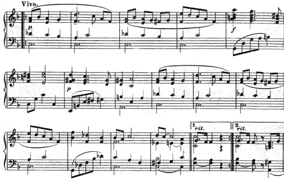
Şekil 2. Ponce, Mazurka no.6, ölçü 18-33

Eserin B bölümü Vivo (canlı) olarak belirtilmiş, kısa melodilerden oluşmaktadır. A bölümünün aksine bu bölümde net kadanslar görülür.