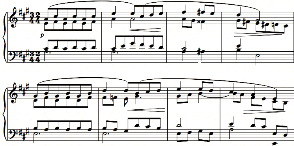
Şekil 4. Ponce, “Balada Mexicanas” ölçü 1-8.

Eser B bölümünde 4/4'lük ve Andante olarak değişir, burada “Cancion del Bajio” benzeyen lirik bir yapı görülür. Ton geçişleriyle devam eden bölüm ikinci bir gelişme bölümüyle 3/4'lük 2/4'lük düzene geri döner ve finalde bas çizgisinde tekrarlanan akorlar, oktav geçişleriyle güçlenen kadans benzeri bir yapıyla sona erer. Özellikle son bölümünde Fortissimo nüansta ve teknik zorlukları kapsayan tarzıyla eser, Ponce'nin Liszt'e olan hayranlığını yansıtmakta aynı zamanda bestecinin Avrupa romantizmiyle Meksika kültürünü sentezleme ustalığının da göstermektedir.