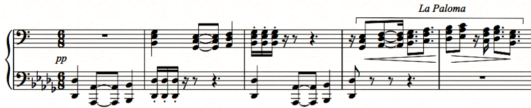
Şekil 8. Ponce, “ Quatre Pieces Pour Piano ”- “ Preludio Scherzoso ” ölçü 27-31.

İkinci bölüm “Arietta” ve üçüncü bölüm olan “Sarabande” daha geleneksel yapıdadır. Dördüncü bölüm “Gigue”de Meksika’nın geleneksel danslarında sıklıkla kullanılan 2’li ve 3’lü zamanın ritmik dönüşümü 6/8 ‘lik ve 2/4 ‘lük zaman algısını bir arada kullanımı görülmektedir.