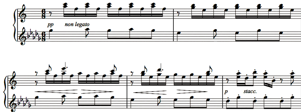
Şekil 6. Ponce, “ Quatre Pieces Pour Piano ” - “ Preludio Scherzoso ” ölçü 1-3.

İlk bölüm olan “ Preludio Scherzoso ” 6/8 ‘lik ölçüde ve “ Allegro ” olarak başlar. Bölümün ayırt edici özelliği sol elin siyah, sağ elin beyaz tuşlarda çalmasıdır. Oldukça dinamik ve tiz oktavlarda başlayan bölüm forte nüanstan yavaş yavaş piano nüansa doğru inerek ilk 26 ölçünün sonunda bas seslere ulaşır.