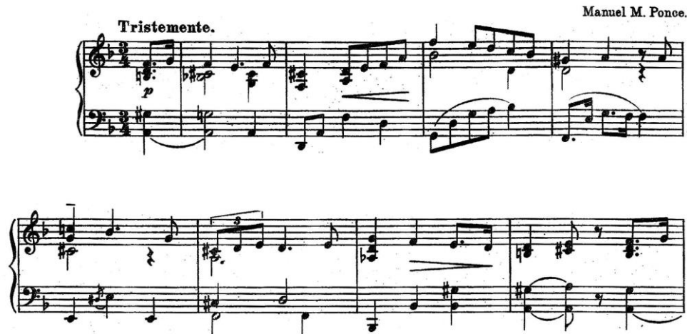
Şekil 1. Ponce, Mazurka no.6, ölçü 1-9

Ponce'nin çok kullandığı bu tezat ikili yapı re minör tonundaki mazurka no.6'da açık şekilde görülmektedir.