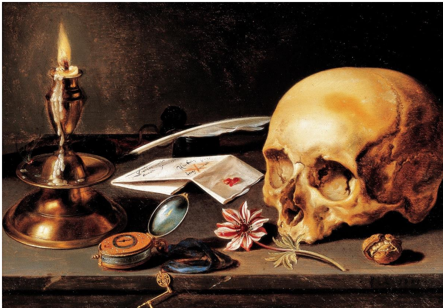
Görsel: 2. Pieter Claesz, Vanitas, 29,3 cm x 34,4 cm, Panel Üzerine Yağlıboya 1625, (Britannica, t.y.).

Vanitas nesnelere, dünya zevkleri üzerinden maddi zenginliği, bilimsel gelişmeyi ve ölüm ile hiçliği temsil etmesi bakımından üç temel temayı yansıtır. 17. Yüzyılda yapılan vanitas resimlerinde, şamdanlar, gümüş ve altın kadehler, tabaklar, mücevherler, kılıçlar, taşlar, işlemeli elbiseler, kumaşlar, meyveler, içecekler, heykeller, oyun kartları dünya evi zenginliğini ve zevklerini gösterilmesi için kullanılan nesnelere. Bilimsel temaları temsil için seçilen nesnelere, harita, cetvel, pergel, kitap, dünya küresi, terazi, kalem, pusula, çarklar, savaş zırhları gibi teknik araçlardan oluşturulur. Ölüm temasını ise, kuru kafa, mum, köpük, yaprak, çiçek, saat ya da ölü hayvanlar gibi figüratif nesnelere üzerinden metaforik bir anlatım sağlanır. Bütün bu eşyalar dünyalık mal ve eşyanın gösteriş ve anlamsızlığı konusunda uyarıcı niteliklerdeki temsillerdir. Vanitas temalı resimleriyle ünlü Hollandalı ressam Pieter Claesz'in natüremort çalışmalarında zamanın refahına ve aratan tüketime karşı uyarıcı ve derin bir eleştiriye sahip nesnelere temsiller ön plana çıkar.