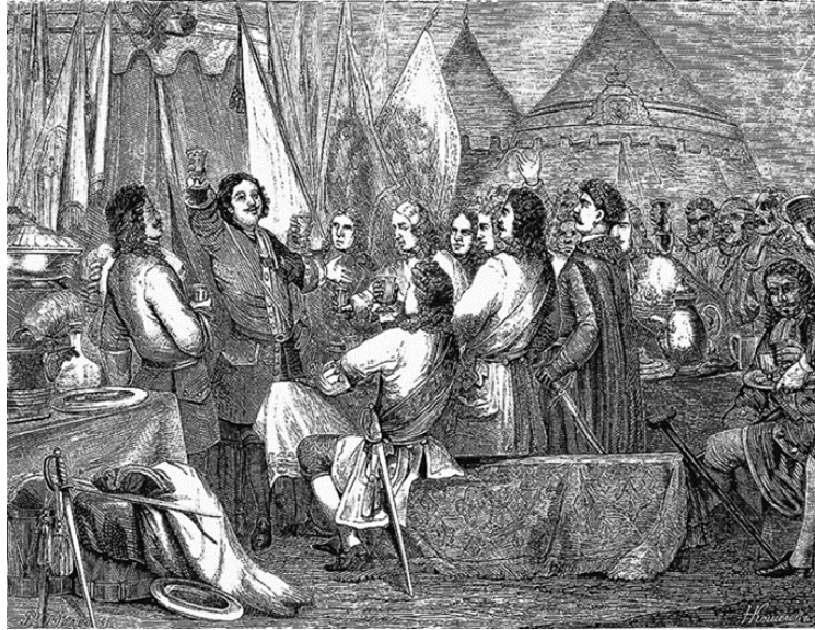
Fotoğraf 2. Çar I. Petro tarafından kurulan "Aptallar ve Soytarıların Şakacı, Sarhoş Sinodu" (Copia-Di-Arte, 2022)

Sanatçı Unbekannter Künstler'in Rusya Devlet Kütüphanesi'nden edinip, litografi tekniği kullanarak resmettiği meclisin resmi aşağıda yer almaktadır.