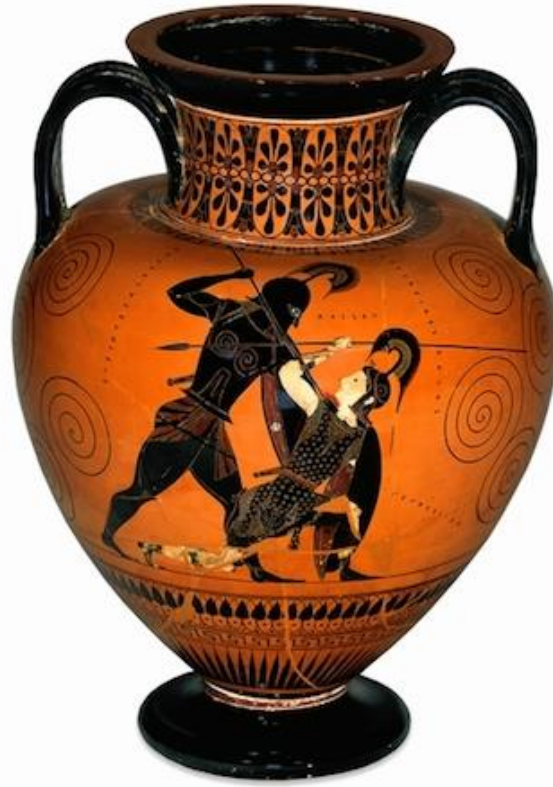
Resim 1: Aşil, Amazon Kraliçesi Penthesilea'yı öldürüyor, M.Ö. 540-530.

İlk çağlar ile endüstri çağına kadar olan süre zarfında kilin şekillendirilmesi yoluyla üretilen eşyaların süslenmesi salt ekonomik ve estetik niyetin ötesinde toplumların hassasiyetleri, kültür düzeyleri, inanç ve adetleri, sosyal ilişkileri, kısacası yaşam tarzlarını yansıtmaya eğilimi idi. Günümüzde seramik üretiminde tasarım uygulamaları, işlevsellik ve pazarlama çerçevesinde bir yön almıştır (Ayta,1976: 5).