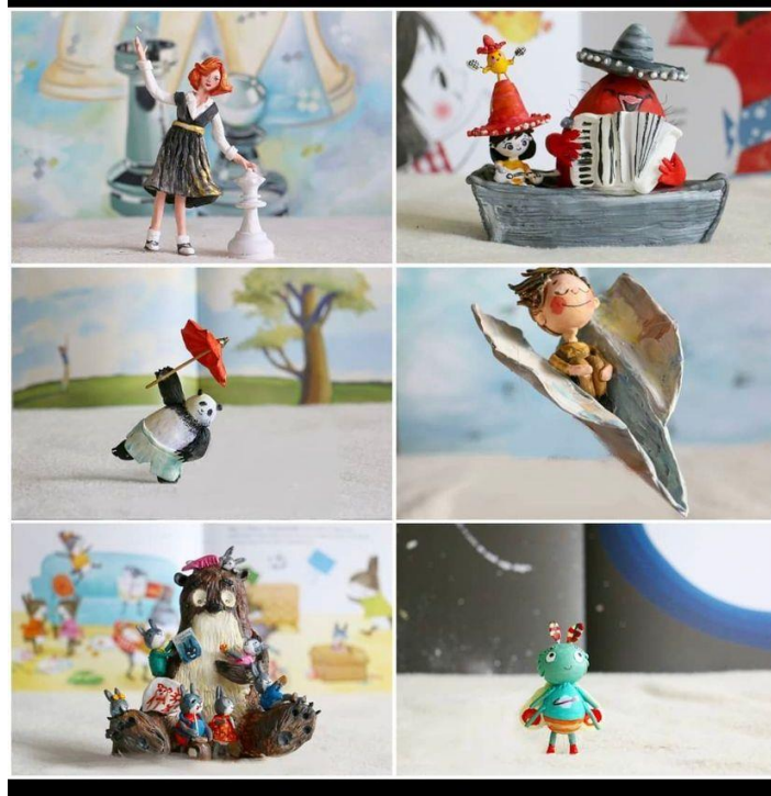
Resim 12: 3 Boyutlu Kitap Karakterleri

Göksun, 2022 yılında sanat öğretmeni olarak çalıştığı okuldan ayrılıp kendi atölyesini kurmuştu ve halen atölyesinde çocuklara yönelik 3 boyutlu karakter tasarımı üzerine eğitimler düzenlemektedir.