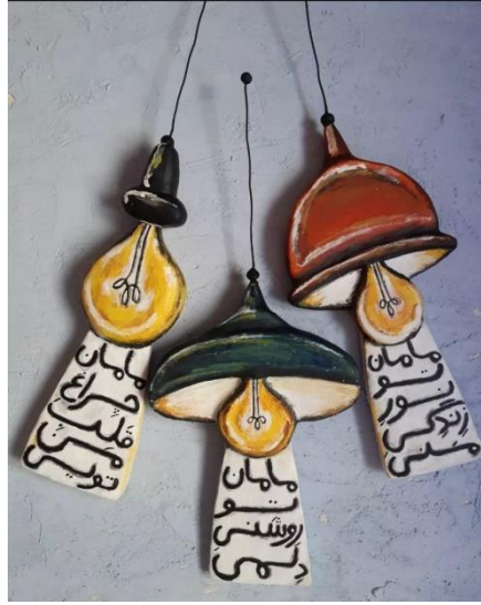
Resim 9: Lambs

Yuki Kimura, illüstratif seramik eserler üreten sanatçılara bir diğer örnektir. Kendisi yaptığı seramik heykelleriyle insan duygularını görselleştirmek istediğini ileri sürmektedir. Tasarımlarındaki insan figürlerinin gerçekdışı vücut oranları ile kendi illüstratif üslubunu yaratmıştır (Resim 10).