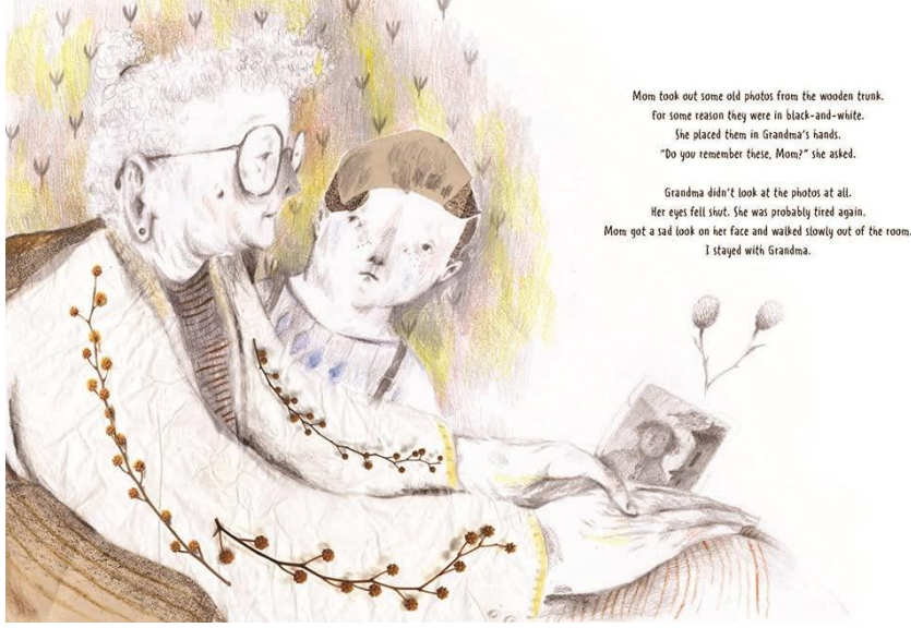
Resim 13: Anneannemin Fotoğrafları, Nesin Yayinevi

çizilmiş bir heykel pratiğinin çizgisi dışında kalmayı tercih etmiş ve hep farklı disiplin ve uygulama alanlarının izini sürmüştür.