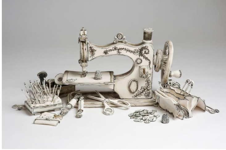
Resim 5: Stitched Up

Görsel İletişim Tasarımı ve illüstrasyon eğitimi almış Kıbrıslı sanatçı Daphne Christoforou, günlük kullanılan vazo, kase, bardak gibi seramik objeler üzerine illüstratif çalışmalar yapmaktadır. Christoforou, tek bir obje üzerinde illüstrasyon kullanımı ile tüm bir hikayeyi anlatabilmektedir (Resim 6). Sanatçı günlük konuları bile hikayeleştirme ve bu hikayeleri seramikler üzerine aktararak onlara illüstratif bir değer kazandırma konusunda yazma, çizme, şekillendirme, sunum gibi eylemlerle tamamen disiplinler arası bir çalışma yöntemi benimsemiştir.