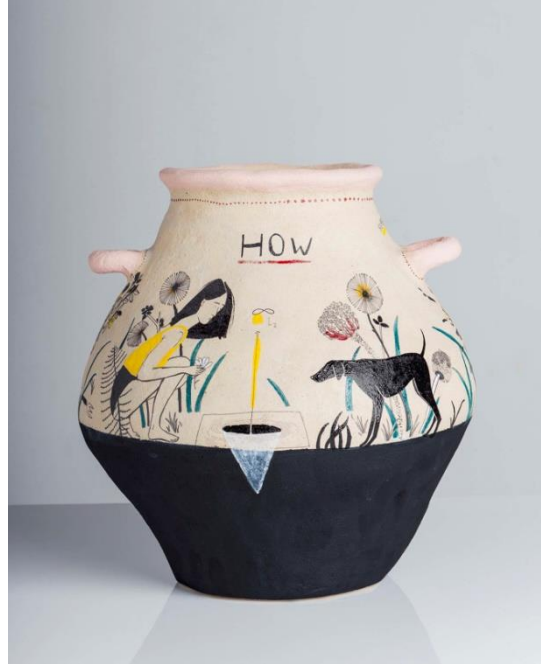
Resim 6: How Did I get Here?

Görsel İletişim Tasarımı ve illüstrasyon eğitimi almış Kıbrıslı sanatçı Daphne Christoforou, günlük kullanılan vazo, kase, bardak gibi seramik objeler üzerine illüstratif çalışmalar yapmaktadır. Christoforou, tek bir obje üzerinde illüstrasyon kullanımı ile tüm bir hikayeyi anlatabilmektedir (Resim 6). Sanatçı günlük konuları bile hikayeleştirme ve bu hikayeleri seramikler üzerine aktararak onlara illüstratif bir değer kazandırma konusunda yazma, çizme, şekillendirme, sunum gibi eylemlerle tamamen disiplinler arası bir çalışma yöntemi benimsemiştir.