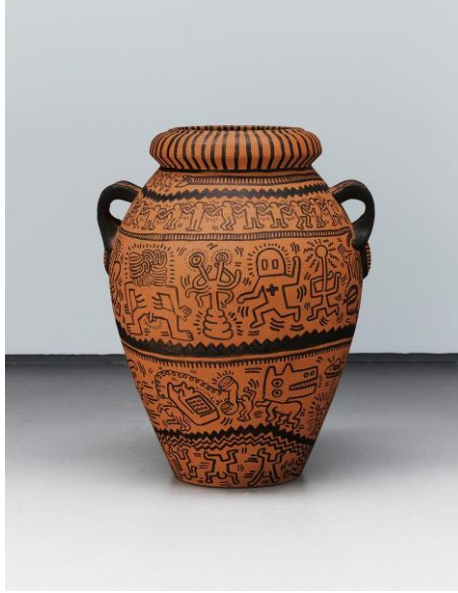
Resim 7: Marker On Terracotta

İllüstratif seramik kullanarak farklı figürler ve hikayeler oluşturmayı seven Sarah Saunders çalışmalarında illüstrasyon etkilerini fazlaca hissettirmektedir. Kullandığı biçim bozma üslubu ile figürlerinde tuhaf oranlar yakalayarak kendine has bir stil oluşturmuştur (Resim 8). Sanatçı formları sadeleştirerek kullanmaktadır.