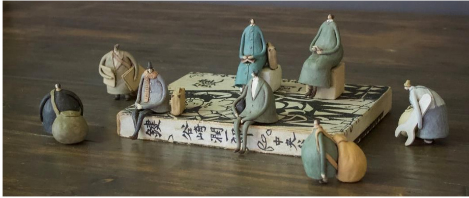
Resim 10: Tiny People at the Station, Kaynak: URL10

Yuki Kimura, illüstratif seramik eserler üreten sanatçılara bir diğer örnektir. Kendisi yaptığı seramik heykelleriyle insan duygularını görselleştirmek istediğini ileri sürmektedir. Tasarımlarındaki insan figürlerinin gerçekdışı vücut oranları ile kendi illüstratif üslubunu yaratmıştır (Resim 10).