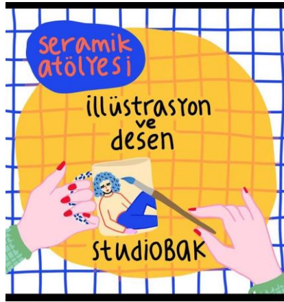
Resim 16: Yeliz Sargın Atölye Duyurusu

Sanat öğretmenliği yapan Sargın, ayrıca kendisi atölyesinde ürettiği seramik çalışmalarını kendi markası ile satışa sunmaktadır. Ayrıca çeşitli workshoplar düzenleyerek hem seramikte illüstratif uygulamalar üzerine eğitimler vermektedir (Resim 16).