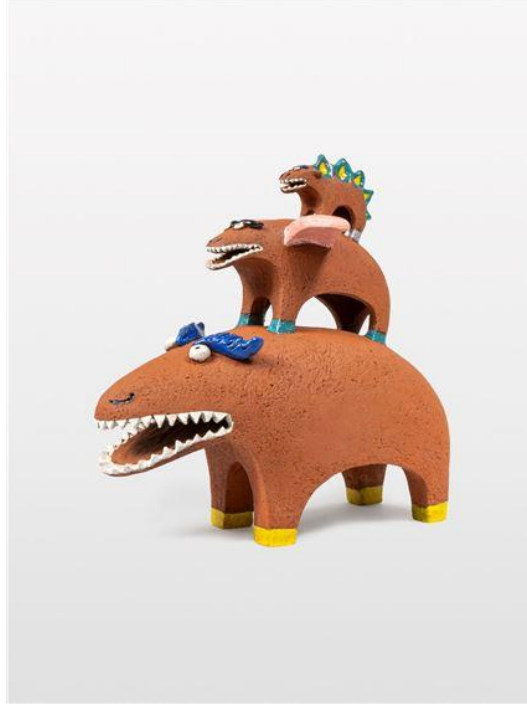
Resim 3: Nie ma Czwartego, 2022

Ağırlıklı olarak illüstratif çalışmalar yapan bir diğer seramik sanatçısı da Yen Yen Lo'dur. Bir grafik tasarımcı olan Yen Yen Lo disiplinler arası çalışma prensibinin iyi bir örneğidir ve seramik çalışmalarında illüstratif üslubu kendini göstermektedir (Resim 4). Sanatçı kendi eserleri için kile sıkıştırarak meydana getirdiği bir illüstrasyon stili tanımlamasını yapmaktadır.