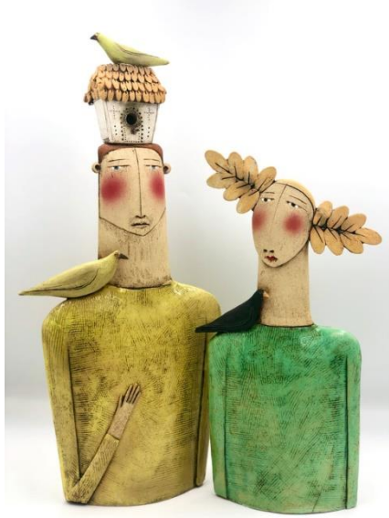
Resim 8: Man With Bird House On His Head And Two Birds / Lady With Black Bird On Shoulder

İllüstratif seramik kullanarak farklı figürler ve hikayeler oluşturmayı seven Sarah Saunders çalışmalarında illüstrasyon etkilerini fazlaca hissettirmektedir. Kullandığı biçim bozma üslubu ile figürlerinde tuhaf oranlar yakalayarak kendine has bir stil oluşturmuştur (Resim 8). Sanatçı formları sadeleştirerek kullanmaktadır.