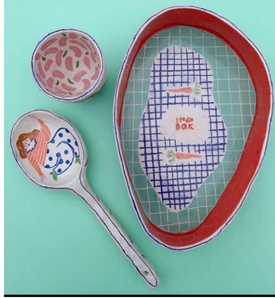
Resim 15: Studio Bak Seramik Tasarımları

ruhuna uygun olarak illüstrasyonlar hazırlamaktadır. Sanatçının illüstrasyon dilinin seramik çalışmaları üzerindeki kullanımı eserlerini özgünleştirmektedir. Dijital illüstrasyon trendlerinin kompozisyon biçimi ve renk paletlerinin özelliklerinin seramik yüzey üzerine taşınması ve seramiğin keyifli illüstrasyonlar için bir çalışma alanı sağlaması Sargın'ın çalışmalarında en öne çıkan özelliklerdir (Resim 15).