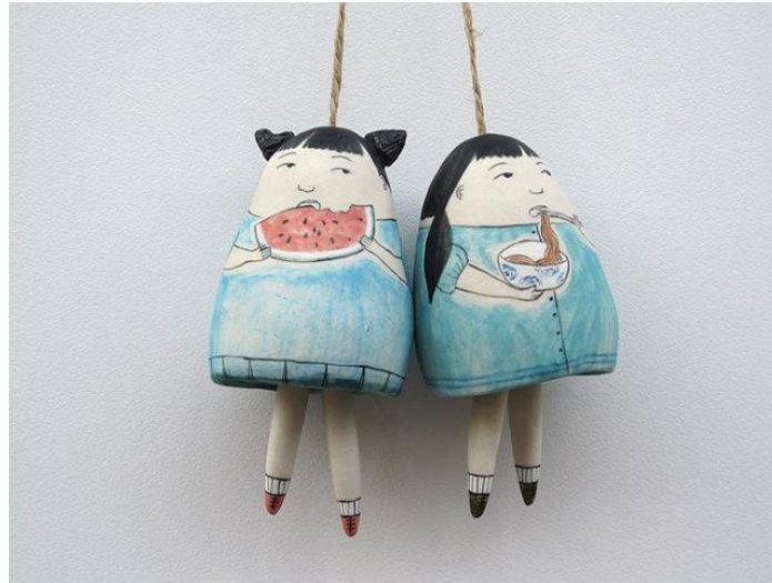
Resim 4: Clay Bells, 2015, Kaynak: URL4

Ağırlıklı olarak illüstratif çalışmalar yapan bir diğer seramik sanatçısı da Yen Yen Lo'dur. Bir grafik tasarımcı olan Yen Yen Lo disiplinler arası çalışma prensibinin iyi bir örneğidir ve seramik çalışmalarında illüstratif üslubu kendini göstermektedir (Resim 4). Sanatçı kendi eserleri için kile sıkıştırarak meydana getirdiği bir illüstrasyon stili tanımlamasını yapmaktadır.