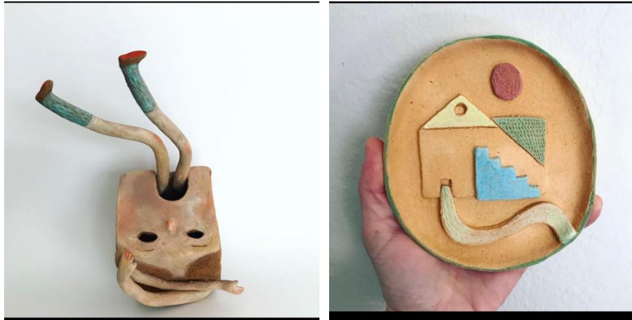
Resim 14: Senta Urgan Seramik Eserleri

Urgan seramik ile çalışmaktan keyif almasını özellikle 2 boyutluluktan 3 boyutluluğa geçişe izin vermesine bağlamakta. Seramikte illüstratif uygulamaların yer yer zorlayıcı olduğunu belirten sanatçı bu çalışma yöntemini kimi zaman daha hesaplı, bir başka zaman ise oldukça spontane ve hızlı hareket etmeyi gerektiren bir pratik olarak tanımlamakta. Disiplinler arasında geçişe imkan olan ve olmayan noktaların farklı çözümler keşfetmeye olanak sağlaması sanatçıyı daha yaratıcı kılmaktadır (Resim 14).