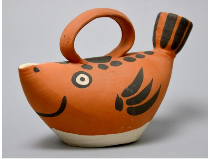
Resim 2: Pablo Picasso, Fish Subject (Sujet poisson), 1954

Kase, bardak, vazo gibi günlük işlevli objeleri hayvan ve insan figürlerine dönüştüren, tabak yüzeylerini sanatsal objelere dönüştüren Picasso seramiğin illüstratif yaklaşımla ele alınması konusunda önemli bir adım atmıştır. 2000 civarında seramik üreten sanatçı, seramiğin sanatsal bir ifade aracı olarak kullanılabilceğini özellikle vurgulamak istemiş ve bu konuda da başarılı olmuştur (Bol,2010: 116).