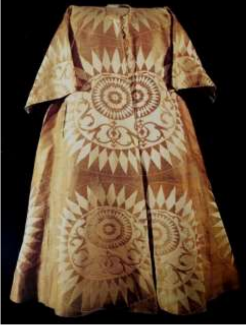
Fotoğraf 10. Seraser kaftan, Sultan II. Selim, TSM 13/177, (Baker, Tezcan&Wearden, 1996: 170)

kumaşın dikilmesiyle yapılan aplike işlemidir. Bunlara ek olarak sıcak baskı, hareli/muharre teknikleriyle müdahale edilen dokumaların Osmanlı saray kaftanlarında kullanıldığı görülmektedir.