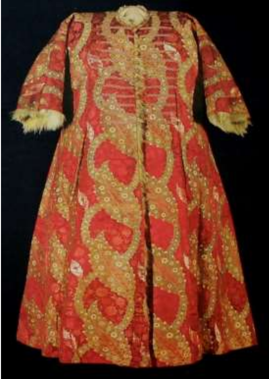
Fotoğraf 17. İçi kürklü kemha kaftan, Sultan II. Bayezid, 16. yüzyıl, TSM 13/35 (Baker, Tezcan&Wearden, 1996: 99)

Osmanlı sarayında kullanılan kaftanlar sağdan sola doğru kapanması önemli bir Türk geleneğidir. Osmanlı sultanlarının kaftanları boyundan bele kadar iliklenecek biçimde çaprastlar dikilmiştir. Bazı kaftanlarda aşağıya kadar bazılarında ise kısa yırtmaçlar, bazılarında ise arka parçaya yırtmaçta uygulanmıştır. Bazı kaftanlarda gizli cep uygulamaları da yapılmıştır.