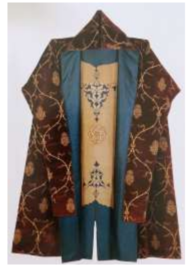
Fotoğraf 26. Sultan Korkud'un sancağa çıkarken giydiği düşünülen dışı İtalyan kadifesi kaftanı, TSM 13/829 (Tezcan, 2006: 18)