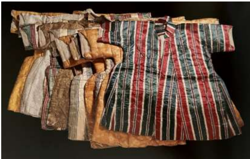
Fotoğraf 25. Topkapı Sarayı Müzesi Koleksiyonunda korunan bebek kaftanı örnekleri (Tezcan, 2006: 76)

Ayrıca Topkapı Sarayında doğan sultan çocukları için de kaftanlar hazırlanarak bebek ve çocuklara giydirilmiştir. Bu kaftanlar dönemin beğeni ve sanat anlayışındaki bütünlüğün her kuşağa nasıl yansıtıldığını göstermektedir. Buradan da anlaşıldığı üzere, bebek, çocuk ve yetişkin elbiseleri aynı model üzerinden yapılmış olduğu ve ayırım yapılmadığı görülmektedir. "Bugün Topkapı Sarayı koleksiyonunda bulunan en seçkin kaftanlar şehzadelere aittir ve muhtemelen sancağa çıktıklarında giydikleri kaftanlardır" (Tezcan, 2006: 18).