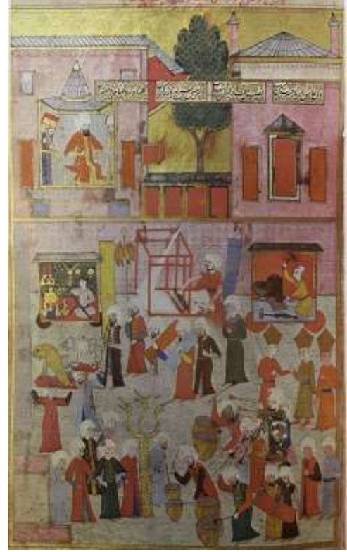
Fotoğraf 4. Surnâme-i Hümayûn'da dokumacı loncasının geçit töreni (And, 1982: 131)

Önceleri oldukça sade olan Osmanlı sarayı kaftanları sonrasında daha çeşitlenmiş ve en iyi malzemeler kullanılarak hazırlanmaya başlamıştır. Kaftanlara samur, kakum, foryum gibi hayvanların kürkleri eklenmiştir. Kürklü kaftanlara "Kapaniçe" adı verilmiş, içinde kürk, dışında ise kemha, seraser, atlas, gezi gibi dokumalar kullanılarak dikilmiştir. Kaftanların soğuk havalarda samur kürklerle birlikte kullanıldığı da bilinmektedir. Osmanlı sultanlarından Kırım hanları ve kendi yanında çalışanlarına iltifat olarak kapaniçe hediye edilmiştir. 1582 yılında yapılan Şehzade Mehmed'in sünnet törenini (Öz, 1946: 61-62) anlatan, günümüzde Topkapı Sarayı Müzesi Koleksiyonu'nda korunan Surnâme-i Hümayûn isimli yazma eserde; çok sayıda iş kolu ve esnafların geçit törenleri minyatürler ile betimlenmiştir.