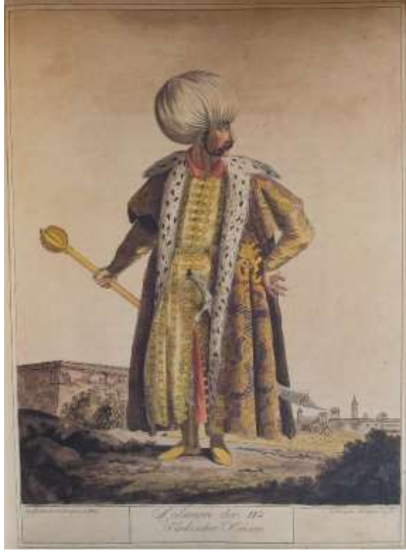
Fotoğraf 3. Kanuni Sultan Süleyman gravürü (Baker, Tezcan&Wearden, 1996: 11)