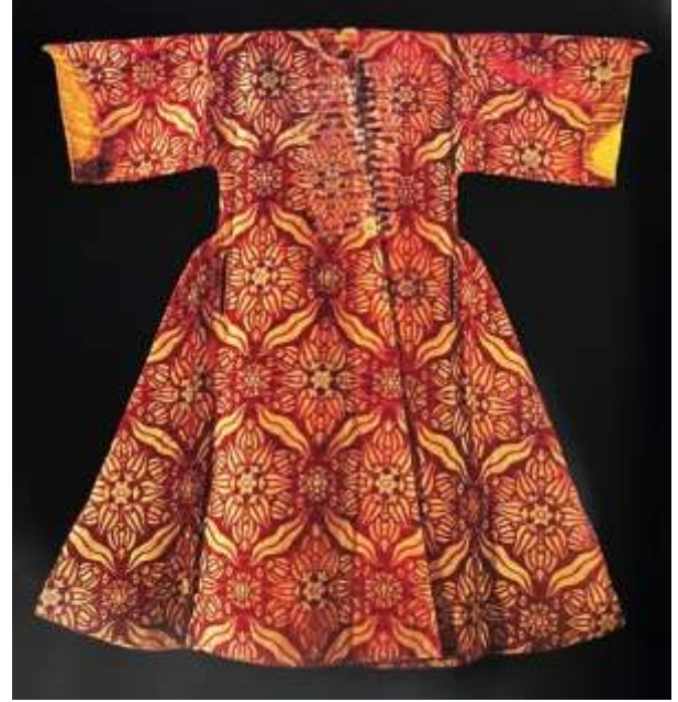
Fotoğraf 16. Çatma kaftan, 16. yüzyıl ortası, TSM 13/8 (Baker, Tezcan&Wearden, 1996: 180)

Kaftanlarda kullanılan motifler iki yüzyılda da farklı olmuştur. 16. ve 17. yüzyıl dokumalarında dokuma enine yalın tek motif sığacak biçimde büyük motifler kullanılırken, 17. yüzyıl sonuna doğru ise küçük motiflerle oluşturulan karmaşık desen kompozisyonları tercih edilir olmuştur.