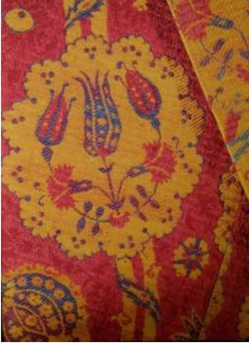
Fotoğraf 19. Kaftan kolunda denk gelmeyen kumaşlar, 16. yüzyıl, TSM 13/664 (Baker, Tezcan&Wearden, 1996: 155)