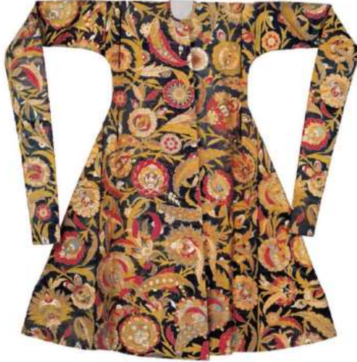
Fotoğraf 14. Gülistani kemha kaftan, Şehzade Bayezid, 16 yüzyıl, (Taşkın&Cangökçe, 2005: 12)

Osmanlı toplumunda giyim, giyenin kültürel kimliğine göre belirlenen kurallarla değişiklik göstermektedir. Osmanlılarda giysi, toplum yaşamının bir ifadesi olmuştur. Giysinin biçimi, kumaşı, dokumanın motif ve desenleri, rengi; giyenin toplum içindeki yerini ve kültürel kimliğini yansıtmaktadır. Saray giyiminde kullanılan renkler daima saraya özgüdür. Osmanlı halkının neler giyebileceği ferman ve nizamnamelerle düzenlenmekte ve halkın herşeyi giymesi yasaklanmaktadır. Hıristiyan, Musevi ve diğer dini inançlara mensup insanlar ile din görevlilerinin giysileri de biçim ve renkleriyle ayrılmıştır. “Ayrıca giyenin mevkii ne olursa olsun, giysileri, giydiği yere ve zamana göre değişmektedir” (Uğurlu, 2019: 167).