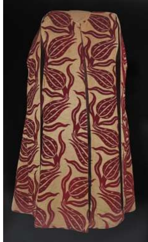
Fotoğraf 18. Aplike kaftan, Sultan İbrahim, 17. yüzyıl ilk yarısı, TSM 13/486 (Baker, Tezcan&Wearden, 1996: 215)

Osmanlı sarayında kullanılmış kaftanların yakaları çok çeşitlidir. Kapalı, yuvarlak, kaytanlı, kürklü, V yaka gibi çeşitler kaftan yakalarına kullanılmıştır. Yaka solunda düğme yerine kullanılan Mevlâna topuzu, sağına ise ilmekler dikilmiştir. Mevlâna topuzları ve ilmekler ise çarpana dokumasından yapılan çaprastlar üzerine dikilmiştir. Kaftan kolları kısa ve uzun olarak dikilmektedir. Kaftanların genellikle uzun, geniş yenleri vardır. Kaftan önü açık bırakılarak genellikle bir kuşak bağlanarak kaftan önü kapatılmıştır. Ayrıca takma kollu kaftanlarda vardır.