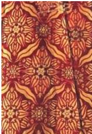
Fotoğraf 7. Çatma kumaşlı kaftan ayrıntısı, 16. yüzyıl ortası, TSM 13/8 (Baker, Tezcan&Wearden, 1996: 180)

Osmanlı sarayında önemli bir gelenek olan kaftanlar, Osmanlı sultanı ve ailesine değerli malzeme kullanılarak özel olarak dokunmuş dokumalar kullanılarak dikilmiş kaftanlar hazırlanmıştır. Kaftan kumaşlarındaki motif ve desenler dönemin karakteristik motifleriyle oluşturulmuştur.