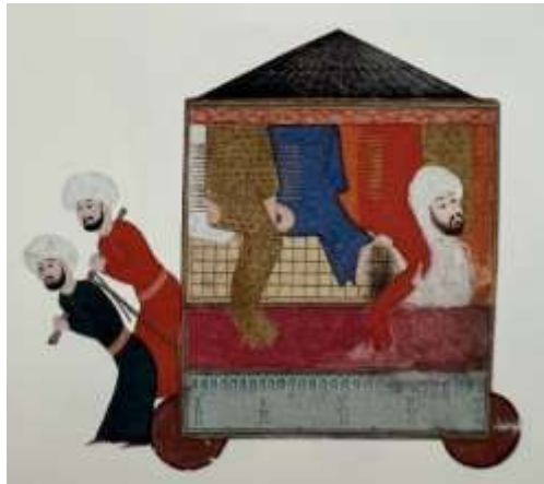
Fotoğraf 5. Surnâme-i Hümayûn'da Kaftancılar loncası ayrıntısı (Atasoy,1997: 91)

Önceleri oldukça sade olan Osmanlı sarayı kaftanları sonrasında daha çeşitlenmiş ve en iyi malzemeler kullanılarak hazırlanmaya başlamıştır. Kaftanlara samur, kakum, foryum gibi hayvanların kürkleri eklenmiştir. Kürklü kaftanlara "Kapaniçe" adı verilmiş, içinde kürk, dışında ise kemha, seraser, atlas, gezi gibi dokumalar kullanılarak dikilmiştir. Kaftanların soğuk havalarda samur kürklerle birlikte kullanıldığı da bilinmektedir. Osmanlı sultanlarından Kırım hanları ve kendi yanında çalışanlarına iltifat olarak kapaniçe hediye edilmiştir. 1582 yılında yapılan Şehzade Mehmed'in sünnet törenini (Öz, 1946: 61-62) anlatan, günümüzde Topkapı Sarayı Müzesi Koleksiyonu'nda korunan Surnâme-i Hümayûn isimli yazma eserde; çok sayıda iş kolu ve esnafların geçit törenleri minyatürler ile betimlenmiştir.