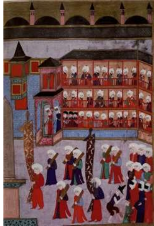
Fotoğraf 2. Kemhacılar loncasının geçit töreni (Atasoy, 1997: 76)

Bizans İmparatorluğunun sınır komşusu olan Osmanlı Beyliğinin gelişme çağında özellikle Orhan Bey döneminde Bizanslılarla sıkı dostluk ve kız alıp kız verme gibi örnekler ortaya çıkmıştır. Osman Gazi sade ve basit elbiseler giyerken (Rasim, 1994: 16) Orhan Bey'den başlayarak Osmanlı yöneticilerinin törene önem vermesi, yöneticilerin giysileri ve kullandıkları süsleri ile zenginlik ihtişam ve güçlerini gösterme fırsatı bulmaları öne çıkmıştır.