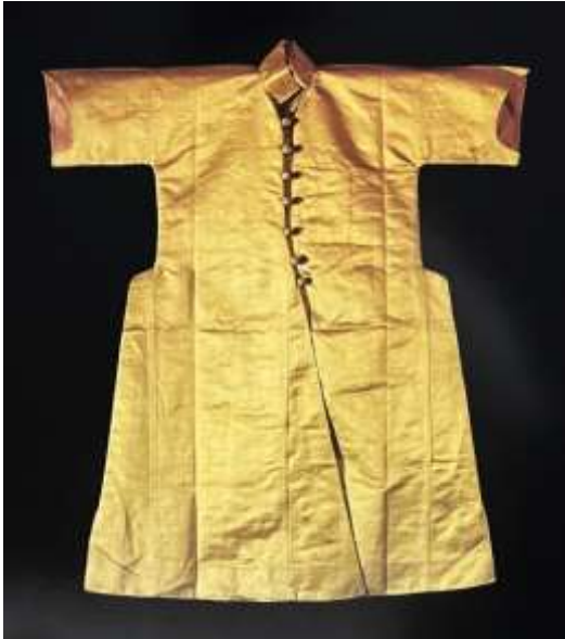
Fotoğraf 21. Tek renk atlas çocuk kaftanı, Sultan Süleyman I, TSM 13/92 (Baker, Tezcan&Wearden, 1996: 205)

Osmanlılar Bursa'nın alınmasıyla saray yaşantısına özenip Orhan Bey zamanında, komşuları Bizans'ın saray yaşantısı etkisinde kalmıştır. Bunun sonucunda geleneksel giysileri yerine ipekli, lüks giysi ve dokumalar kullanmaya başlamışlardır.