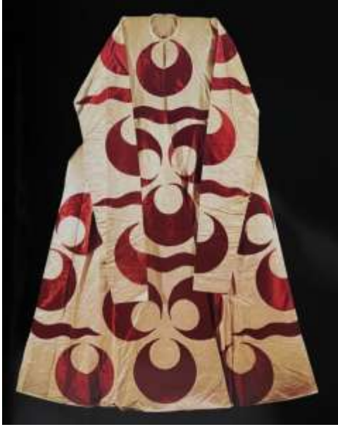
Fotoğraf 23. Aplike kaftan, 17. yüzyıl 2. çeyreği, Sultan İbrahim, TSM 13/558 (Baker, Tezcan&Wearden, 1996: 136)

Osmanlı sarayında kullanılan tören kaftanları ise pahalı malzeme, bileşik yapılu dokuma örgüleri, güçlü tasarım ve gösterişli süslerle oluşturmuşlardır. Günümüze kalan dokuma örneklerinde, minyatür ve yazılı belgelerde dokumalarla ilgili ayrıntıların görselleştirildiği ya da belgelendiği görsel ve kayıtlar vardır. Osmanlı sarayındaki kaftanlar kullanılacakları yerlere göre farklı özelliklerle çeşitlenmiştir.