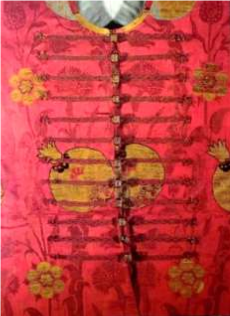
Fotoğraf 12. Kaftan üzerinde Mevlâna topuzu ve Çaprastlar, 16. yüzyıl geç dönem-17. yüzyıl erken dönem, TSM 13/966 (Baker, Tezcan&Wearden, 1996: 127)

Osmanlı sarayındaki kaftanlarda kullanılan kumaş çeşitleri incelendiğinde ise Seraser, Atlas, Kemha, Serenk, Çatma, Altın Telli Çatma, Kadife, Kutnu, Selimiye, Gezi, Sevayi, Telli Sevayi, Hataî ve Çuha olduğu görülmektedir. Osmanlı İmparatorluğu'na bağlı saray atölyelerinde dokunan seraser dokuma Serasercibaşı gözetiminde yapıldığı için en pahalı kumaş olmuştur. Gülistani kemha ve kemha dokumalarda ise renkli ipek ile altın ve gümüş sel, sim, kıllıktan kullanıldığı ve kaftan malzemesi olarak sıklıkla kullanıldığı için Osmanlı sarayının simgesi dokumalar arasında en önemlilerindedir.