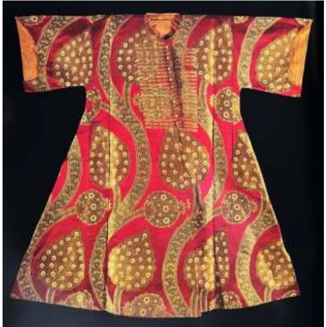
Fotoğraf 13. Kemha kaftan, Sultan Osman III, 16. yüzyıl 2. yarısı, TSM 13/584 (Baker, Tezcan&Wearden, 1996: 146)

“Ehl-i hıref ve saray terzileri bünyesinde farklı dokumalar dokunmuştur. Kemha ve kadife dokuyanlar ise en önemlileri olmuştur. Kemha dokuyucularının grubu Ehl-i Hıref örgütünün bünyesinde kurulmuş, 16. yüzyıl başından 18. yüzyıl sonuna kadar dokumaya devam etmişlerdir. Bu grubun usta ve çıraklarının