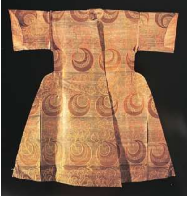
Fotoğraf 15. Seraser kaftan, 17. yüzyıl ilk çeyreği, TSM 13/265 (Baker, Tezcan&Wearden, 1996: 174)

15. yüzyıl Osmanlı saray dokumalarında kullanılan rumi, pars beneği, kaplan çizgileri, bulut, nilüfer çiçeği, palmet, lale ve karanfil çiçekleri ile oluşturulan küçük boyutlu motif gruplarının ½ raportlu kompozisyon sistematiğinde tekrarlarla oluşturulmuştur. Bu kompozisyonlar 16. yüzyılın ikinci yarısından itibaren yerini farklı desen kompozisyonlarına bırakmıştır. Oval biçimli şemselerin tam ya da yarım raporlar halinde yerleştirildiği kompozisyonlarla devam etmiştir. Bazı dokumaların desen kompozisyonlarında ise dikey biçimde dalgalı, zikzaklı ya da kırık dallar tam raporlar halinde yerleştirilmiştir (Uğurlu, 2001: 54-55). Bu dokumaların desen kompozisyonlarında ise lale, nar, karanfil, çintemani, üç benek, içiçe benek, hançer yaprakları, çınar yaprağı, kozalak, bulut, yıldız güneş, hilal motifleri sıklıkla kullanılmıştır. “17. yüzyılda ise lale gonca gül, tavus kuşu tüyü, penç motifleri daha çok tercih edilmiş, şemselerin çevresi çiçek dalları ve yapraklarla süslenmiştir” (Uğurlu, 2019: 168).