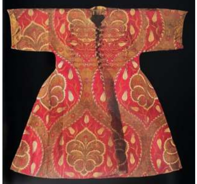
Fotoğraf 24. Kemha çocuk kaftanı, 17. yüzyıl ilk çeyreği, TSM 13/929 (Baker, Tezcan&Wearden, 1996: 117)

Ayrıca Topkapı Sarayında doğan sultan çocukları için de kaftanlar hazırlanarak bebek ve çocuklara giydirilmiştir. Bu kaftanlar dönemin beğeni ve sanat anlayışındaki bütünlüğün her kuşağa nasıl yansıtıldığını göstermektedir. Buradan da anlaşıldığı üzere, bebek, çocuk ve yetişkin elbiseleri aynı model üzerinden yapılmış olduğu ve ayırım yapılmadığı görülmektedir. "Bugün Topkapı Sarayı koleksiyonunda bulunan en seçkin kaftanlar şehzadelere aittir ve muhtemelen sancağa çıktıklarında giydikleri kaftanlardır" (Tezcan, 2006: 18).