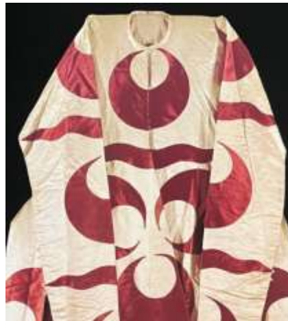
Fotoğraf 8. Aplike teknikli kaftan ayrıntısı, 17. yüzyıl, Sultan Ahmed I, TSM 3/136 (Baker, Tezcan&Wearden, 1996:215)