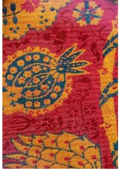
Fotoğraf 20. Kemha kumaşında motifler ve zemindeki dolgu motifleri, 16. yüzyıl, TSM 13/664 (Baker, Tezcan&Wearden, 1996: 157)

Osmanlı saray dokumaları, Osmanlı sarayında sultan, aile fertleri ve saraydaki kişiler kullanılan dokumalardır. Saray ve saraya bağlı atölyelerde dokunmuş bu dokumalar, zengin malzeme ve önemli tekstil teknikleri içermektedir.