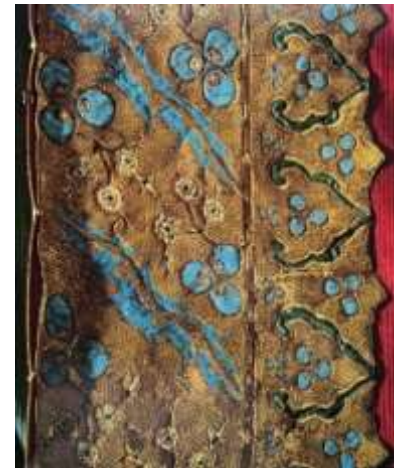
Fotoğraf 9. İşlemeli tören kaftan, 16. yüzyıl ilk çeyreği, Şehzade Mehmed, TSM 13/738 (Baker, Tezcan&Wearden, 1996: 83)

Dokumalarda parlaklık için atlas (saten) dokuma örgüsüne ek olarak kabartma/rölyef yapabilmek için çatma ve kadife türünde teknikler kullanmışlardır. Bezayağı ya da dimi dokuma örgülerindeki ipekli dokumalarda altın ve gümüş tel, sim, kılaptan özellikle tercih edilmiştir. Renkli ipek ipliklerle süzeni, anavata; altın ve gümüş tel, sim, kılaptan ile dival işleme teknikleri kullanılarak süslenmiştir. Bazı kaftanlarda ise applike tekniklerinden oturtma ve kakma teknikleri süslemede kullanılmıştır. Oturtma belirli bir renkteki kumaş parçalarının başka renkteki zemine applike edilmesi, kakma ise zemin kumaşından kesilerek çıkartılmış bölümde kesiklerin altına farklı renkte