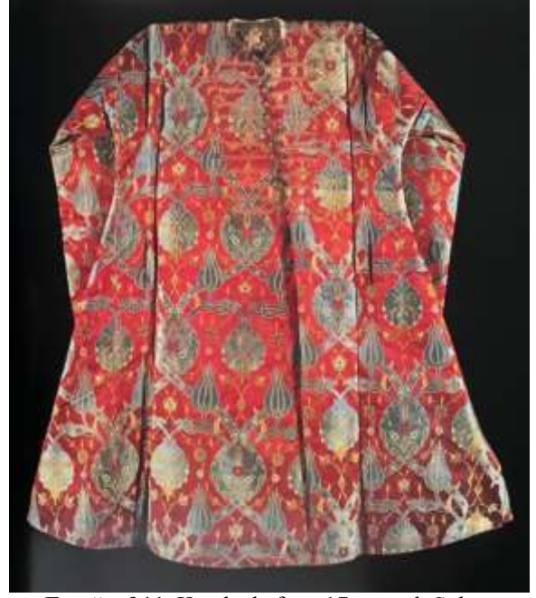
Fotoğraf 11. Kemha kaftan, 17. yüzyıl, Sultan Ahmed I, TSM 13/932 (Baker, Tezcan&Wearden, 1996: 141)

Osmanlı sarayındaki kaftanlarda kullanılan kumaş çeşitleri incelendiğinde ise Seraser, Atlas, Kemha, Serenk, Çatma, Altın Telli Çatma, Kadife, Kutnu, Selimiye, Gezi, Sevayi, Telli Sevayi, Hataî ve Çuha olduğu görülmektedir. Osmanlı İmparatorluğu'na bağlı saray atölyelerinde dokunan seraser dokuma Serasercibaşı gözetiminde yapıldığı için en pahalı kumaş olmuştur. Gülistani kemha ve kemha dokumalarda ise renkli ipek ile altın ve gümüş sel, sim, kıllıktan kullanıldığı ve kaftan malzemesi olarak sıklıkla kullanıldığı için Osmanlı sarayının simgesi dokumalar arasında en önemlilerindedir.