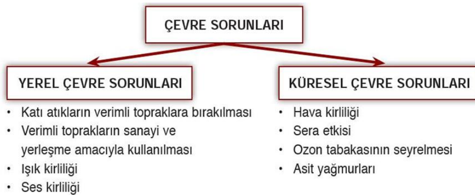
Şekil 1. Çevre Sorunlarının Sınıflandırılması

Bu araştırma tarama modelidir. Geçmişte ya da o anda var olan bir durumu var olduğu şekliyle betimlemeyen, tanımlamayı amaçlayan araştırma yaklaşımıdır. Araştırmaya konu olan her neyse onları değiştirme ve etkileme çabası yoktur bu modelde. Bilinmek istenen şey meydana gelmiştir. Amaç o şeyi doğru bir şekilde gözlemleyip belirleyebilmektir. Asıl amaç değiştirmeye kalkmadan gözlemektir (Karasar,1984,79) . Nitel araştırmayı, gözlem, görüşme ve doküman analizi gibi nitel veri toplama yöntemlerinin kullanıldığı, algıların ve olayların doğal ortamda gerçekçi ve bütüncül bir biçimde ortaya konmasına yönelik nitel bir sürecin izlendiği araştırma olarak tanımlamak mümkündür. Diğer bir deyişle nitel araştırma, kuram oluşturmayı ve anlamayı ön plana alan bir yaklaşımdır (Yıldırım ve Şimşek, 2021).