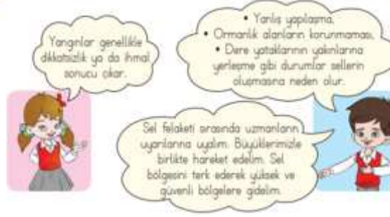
Görsel 3: 1. Sınıf Ders Kitabında Diğer Afet Konularının Anlatımı

Son olarak ünite sonu değerlendirme soruları incelendiğinde afet konusu ile ilgili ders kitabında sadece 3 tane değerlendirme sorusuna yer verildiği tespit edilmiştir. Bu sorular: