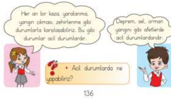
Görsel 1: 1. Sınıf Ders Kitabında Afet Konusuna Giriş

Ders kitabı incelendiğinde afet kelimesi ile ilgili hiçbir tanımlama yapılmadan öğrencilerin 1. Sınıf düzeyinde olmasına rağmen bu terime hâkim kabul edilerek direk konuya giriş yapıldığı, afetin tanımına ya da afetin türlerine dair herhangi bir bilgiye yer verilmediği tespit edilmiştir (Görsel 1). 1,5 sayfalık afet konu anlatımında ise en geniş bilgi verilen afet türünün deprem olduğu tespit edilmiştir. Deprem konusu ortalama 1 sayfa olarak ele alınmıştır. Deprem dışında sadece yangın ve sel afetleri hakkında kısa bilgiler yer verildiği belirlenmiştir. Bu iki konu ise sadece yarım sayfa olarak ele alınmıştır. Bunun dışında ülkemizde sık görülen heyelan, çığ, toprak kayması vb. afetlere kazanımlarda yer verilmediği için ders kitabında da yer verilmediği tespit edilmiştir.