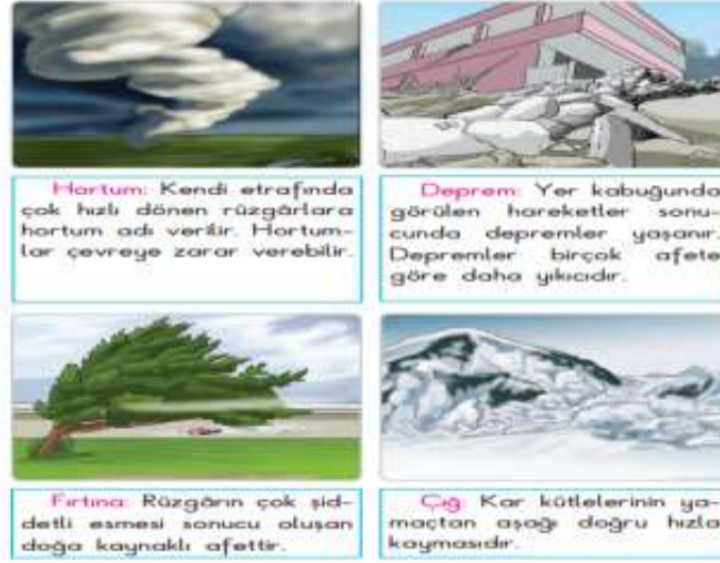
Görsel 6: 2. Sınıf Hayat Bilgisi Ders Kitabı Doğada Hayat Ünitesinde Yer Alan Afet İle İlgili Görseller

görülen deprem, sel, heyelan, çığ, fırtına ve hortum afetini ele aldığı belirlenmiştir. Bu afetler 2. Sınıf öğrencilerinin düzeyine uygun anlaşılır seviyede kısa ve net bilgiler ve görsellerle aktarılmıştır (Görsel 6).