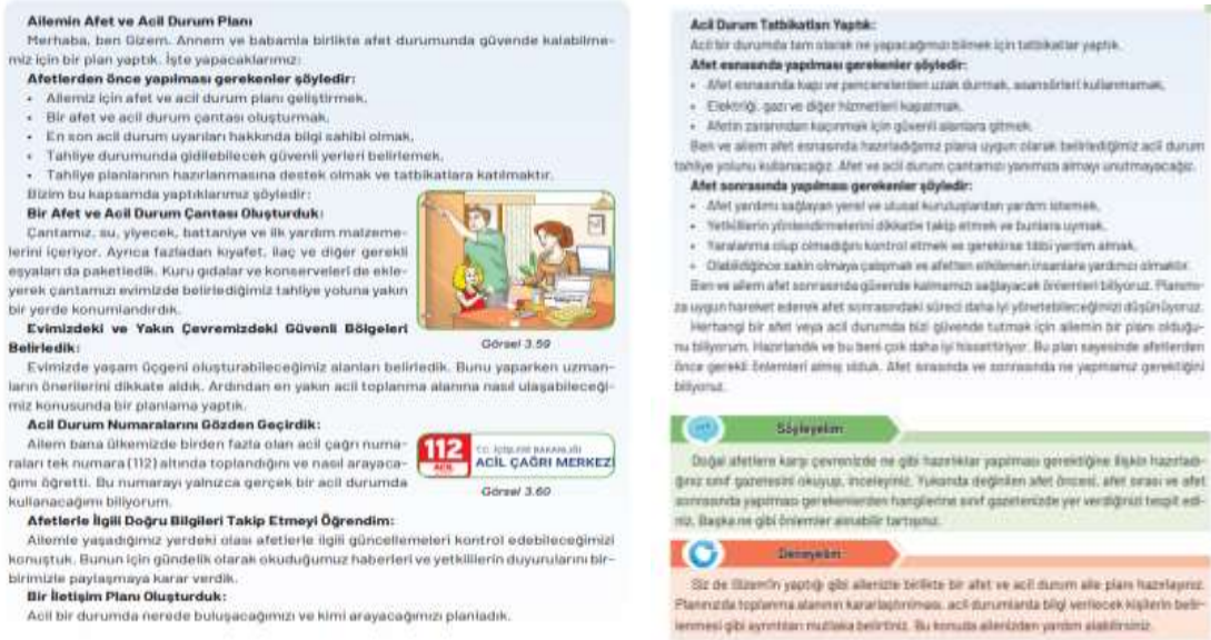
Görsel 17: 4. Sınıf Sosyal Bilgiler Ders Kitabında Afet ve Acil Durum Planının Ele Alınışı