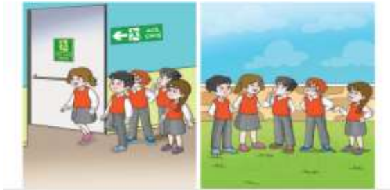
Görsel 10: 3. Sınıf Hayat Bilgisi Ders Kitabında Afet Sonrası Yapılacakların Anlatımı

Günlük yaşamımızda bir olumsuz etkiyen, can ve mal kaybına neden olan bazı olaylarla karşılaşabiliriz. Örneğin yaşadığımız bölgede deprem, sel ya da beş yıl gibi bir afet meydana gelebilir. Dikkatli olmamıza rağmen bulunduğumuz yerde ya da yakınlarımızda bir yangın çıkabilir veya kaza yaşanabilir. Bu tarz durumlara karşılaştığımızda öncelikle telaşa kapılmamalı, sakin olmaya çalışmalıyız. Yaşanan afetin bitmesini beklemeli, alabiliyorsak yanımıza afet ve acil durum çantasını almamız. Acil çıkış tabelalarını takip ederek en yakınımdaki toplanma alanına gitmeliyiz. Toplanma alanına güvenli bir şekilde ulaştıktan sonra orada bulunan yetkililerin yönlendirmelerine göre hareket etmeliyiz. Afet veya acil durum sonrasında dikkatsiz bir şekilde koçmamalı ve bağır-mamalıyız. Çevremizdeki insanların telaşlanmaması için panik hâlinde hareket etmemeliyiz. Bulduğumuz yeri terk ederken sakin ve dikkatli olmalıyız.