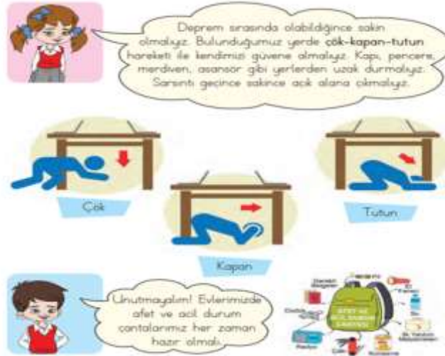
Görsel 2: 1. Sınıf Hayat Bilgisi Ders Kitabında Deprem Konusunun Anlatımı

Afetler konusunun nasıl ele alındığı incelendiğinde en geniş yer tutan deprem konusunda deprem anında yapılması gereken çök, tutun ve kapan vb. hareketlerin görselleri ile aktarıldığı tespit edilmiştir. Bu bilgiler hayat kurtaran önemli bilgilerdir ve ders kitabı bu konuyu görseller ile destekleyerek öğrenci düzeyinde açıkça ele almıştır (Görsel 2). Bununla birlikte afet anında kullanıma hazır olması gereken acil durum çantası ve çantanın içinde olması gereken araç gereçler hakkında bilgiye yer veren (Görsel 2) ders kitabı deprem anında öğrencilerin bilinçli ve hazırlıklı olmasını amaçlamıştır. Fakat bir deprem ülkesi olarak deprem öncesinde alınması gereken önlemlere dair ders kitabında çanta hazırlama dışında herhangi bir veriye rastlanmamıştır.