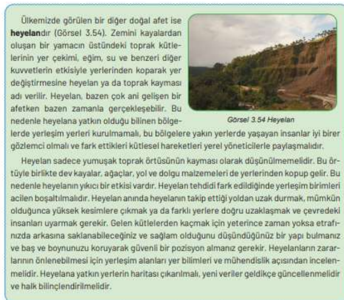
Görsel 14: 4. Sınıf Sosyal Bilgiler Ders Kitabında Afet Konularının Ele Alınışı

İlkokul düzeyinde afetler konusu en kapsamlı şekilde 4. Sınıf ders kitabında yer almaktadır. Ayrıca İlkokul ders kitaplarında ilk defa afetler konusu başlı başına bir konu başlığı olarak 4. Sınıf ders kitabında yer aldığı tespit edilmiştir. Ders kitabı afet tanımının sonrasında ülkemizde görülen deprem, heyelan, orman yangını, çığ ve sel afetlerini tek tek detaylı biçimde ele alarak öncelikle oluşum nedenlerini sonrasında alınacak tedbirleri öğrencilerin farkındalık oluşmasına katkı sağlayacak biçimde ele almıştır (Görsel 14,15).