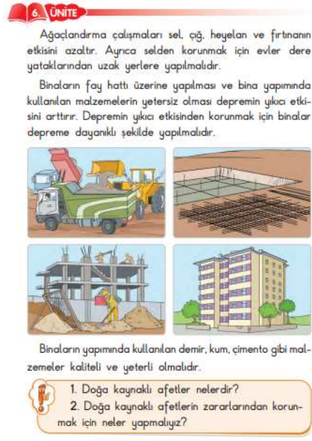
Görsel 7 : 2. Sınıf Hayat Bilgisi Ders Kitabı Doğada Hayat Ünitesinde Afet İlgili Alınması Gereken Tedbirler

Ayrıca konu alanı sadece afetleri tanıtmakla kalmamış doğal afetlerin yıkıcı etkilerinden korunmak için yapılması gerekenler hakkında kısaca bilgiler vererek “Doğa kaynaklı afetlerde insan faktörüne vurgu yapılır.” Kazanımını öğrencilere vermeye çalışmıştır (Görsel 7). Son olarak olarak afet türleri hakkında değerlendirme etkinliği yaparak konu başarılı biçimde ele alınmıştır.