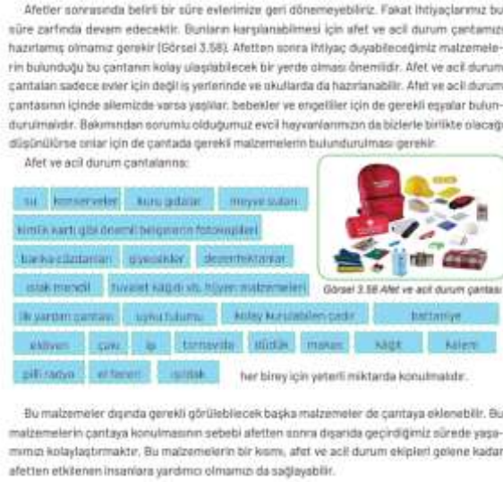
Görsel 16: 4. Sınıf Sosyal Bilgiler Ders Kitabında Afet ve Acil Durum Çantasına Geniş Biçimde Yer Veriliyor.

Ders kitabı Türkiye’de sıklıkla görülen bütün afetleri tek tek anlattıktan sonra afet sonrası için hazırlık konularına geçtiği tespit edilmiştir. Afet sonrası hayat kurtaran en önemli unsurlardan biri olan afet ve acil durum çantası konusu önceki sınıf düzeylerinde olduğu gibi bu ders kitabında da yer almıştır. Fakat 4. Sınıf ders kitabında afet ve acil durum çantası konusunu daha geniş ve daha detaylı olarak ele alındığı belirlenmiştir. Afet ve acil durum çantasında olması gereken her şey öğrencilere tek tek açıklanmış ve konunun ders kitabında ortalama bir sayfa olarak işlendiği tespit edilmiştir (Görsel 16).