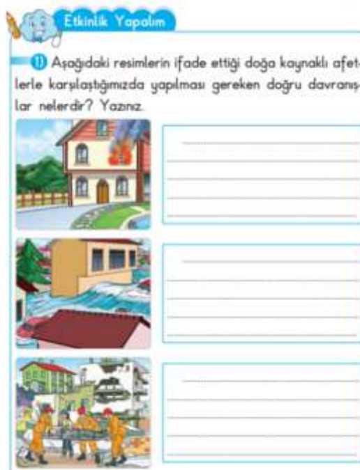
Görsel 5: 2. Sınıf Hayat Bilgisi Ders Kitabı Afet Konuları Etkinliği

Güvenli Hayat ünitesinde çekici nokta ise verilmesi gereken kazanımlardan biri olan “Afet ve acil durumlar sırasında (deprem, sel, yangın) yapılması gereken doğru davranışlar ile ilgili uygulamalar yapılır.” kazanımının ele alınış biçimidir. Ders kitabı bu kazanımı ile ilgili herhangi bir bilgi metnine yer verilmeden öğrencilerin bu konuyu bildiği kabul edilerek kazanım ile ilgili sadece değerlendirme içeren bir etkinliğe yer verilmiştir (Görsel 5). Görselden anlaşılacağı gibi deprem, sel, yangın ile ilgili durumlara, sebeplerine, nelere dikkat edilmesine dair konunun anlatıma yer verilmemiştir. Herhangi uygulama gerektiren bir etkinliğe de yönlendirmemiştir. Bilgi aktarımı ve yapılması gereken uygulamanın ne olabileceği tamamen öğretmene bırakılmıştır. Bu durum ders kitabı için olumsuz bir durumdur. Ders kitaplarının tabi ki her bilginin detaylı ele alındığı bir kaynak olması imkansızdır. Fakat kazanım ile ilgili herhangi bir bilgiye yer vermeden direkt etkinliğe geçiş yapması temel bilgi kaynağı olan ders kitabı için olumsuz bir durumdur.