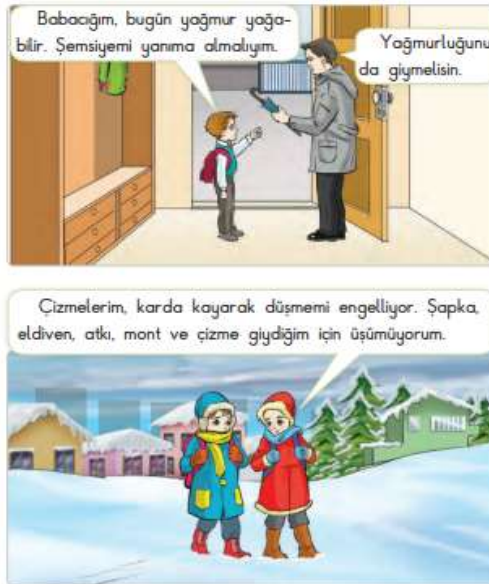
Görsel 9: 2. Sınıf Hayat Bilgisi Ders Kitabında Doğa Olaylarından Korunmanın Yolları Konu Anlatımı