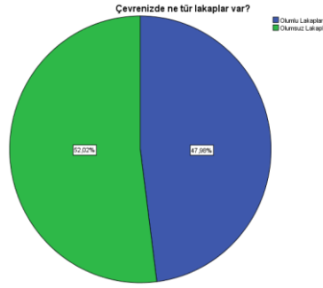
Grafik 3. Çevrenizde Ne Tür Lakaplar Var?

Araştırmaya katılan bir lakabı olan lise öğrencilerinin 129'u (%52) çevresindeki lakapların olumsuz olduğunu, 119'u (%48) ise çevresindeki lakapların olumlu olduğunu söylemişlerdir. Öğrencilerin çevresinde olumsuz lakapların ağırlıkta olduğunu söyleyebiliriz.