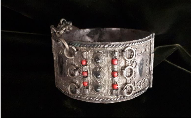
Görsel 6: Bilgi Formu 4, (İlknur Kamiloğlu Arşivi)

Kompozisyon: Astarlı bilezik yuvarlak formda çalışılmıştır. Bir tarafında menteşeli bağlantı yeri, bir tarafında ise sürgü bulunan bilezik iki parçadan oluşmuştur. Eser birbirinin eşi olan iki parçanın merkezinde yay formu verilmiş tellerle yukarıdan aşağıya dört adet çiçek motifi yerleştirilmiştir. Çiçek motiflerinin ortası güverse tekniği ile tamamlanmıştır. Çiçeklerin iki kenarında bir tel üzerine geçirilen kırmızı boncuklar yer almaktadır. Bu boncukların yanında yukarıdan aşağıya gümüş halkalar ile süsleme yapılmıştır. Bileziğin iki ucundan zincir takılmıştır. Bileziğin kenarlarında dairesel formda bezemeler yapılmıştır. Bileziğin bazı yerleri oksitlenmiştir.