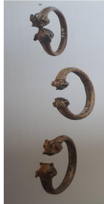
Görsel 2. Van Müzesi'nde Bulunan Açık Halkalı Bronz Bilezikler, M.Ö. 8.yy (Türe,2011:131)

Anadolu'da bilezik çeşitleri, bulunduğu yöreye ve yapım tekniğine göre farklı isimler alabilmektedir. Bilezik çeşitlerini Kuşoğlu (1999:10) şu şekilde sıralamıştır: Kabara bilezik, Diyarbakır hasır bileziği,