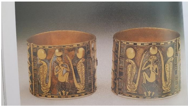
Görsel 1. M.Ö 490. Mısır bilezikleri (Türe,2011:46)

İlk takılar, insanların henüz yerleşik düzene geçmedikleri Paleolitik Çağ'da süslenme yanında, av bereketi ve koruma amaçlı muskalar olarak yaratılmıştır (Köroğlu, 2004:14). Arkeolojik kazılarda daha çok mezar eşyaları arasında küpe ve kolyelerle bir arada bulunduğu görülmüştür. Eski medeniyetlerde özellikle Mısır uygarlıklarında da bilezik örneklerine rastlanmıştır (Görsel:1). Genellikle altın, gümüş, bakır, tunç, demir gibi madenlerden ve camdan yapılmıştır. Seramikten ve ağaçtan yapılanları da vardır. Türkiye'de Prehistorik, Hitit, Frig, Lidya, Urartu, Yunan, Roma Bizans devrine ait ören yerlerinde yapılan arkeolojik kazılarda maden ve camdan çok çeşitli bilezikler bulunmuş, bunlar müzelere kaldırılmıştır (Görsel.2). Anadolu'da İslam dini kabul edildikten sonra, eski Türk kadınları süslenme geleneği Anadolu ve Selçuklu kadınlarında da devam etmiş, bu yolla Osmanlılara ulaşmıştır. Türk kadınlarının süs takıları arasında bileziğin ayrı bir önemi vardır (Önder,1998:35). Bilezikler aynı zamanda kötülüklerden koruyucu bir nazar tılsımıdır.