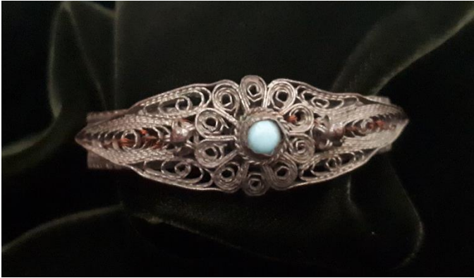
Görsel 7: Bilgi Formu 5, (İlknur Kamiloğlu Arşivi)

Kompozisyon: Astarlı bilezik yuvarlak formda çalışılmıştır. Bir tarafında menteşeli bağlantı yeri, bir tarafında ise sürgü bulunan bilezik iki parçadan oluşmuştur. Eser birbirinin eşi olan iki parçanın merkezinde yay formu verilmiş tellerle yukarıdan aşağıya dört adet çiçek motifi yerleştirilmiştir. Çiçek motiflerinin ortası güverse tekniği ile tamamlanmıştır. Çiçeklerin iki kenarında bir tel üzerine geçirilen kırmızı boncuklar yer almaktadır. Bu boncukların yanında yukarıdan aşağıya gümüş halkalar ile süsleme yapılmıştır. Bileziğin iki ucundan zincir takılmıştır. Bileziğin kenarlarında dairesel formda bezemeler yapılmıştır. Bileziğin bazı yerleri oksitlenmiştir.