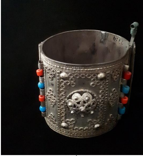
Görsel 4: Bilgi Formu 2, (İlknur Kamiloğlu Arşivi)

Kompozisyon: Bilezik iki ana levha ile gümüş parçaların birbirine eklenmesi yoluyla oluşan beş sıra zincirden oluşmuştur. Bir tarafında menteşeli bağlantı yeri, bir tarafında ise sürgü bulunmaktadır. Dikdörtgen formdaki levhaların üzerinde yuvarlak formda nokta ve çizgi şeklinde kabartmalarla düzenli aralıklarla süslemeler bulunmaktadır. Zincirleri meydana getiren yuvarlak döküm parçaları birbiri içinden geçirildikten sonra birleştirilmiştir. Eserde eksik parça bulunmamaktadır.