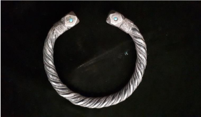
Görsel 8: Bilgi Formu 6, (İlknur Kamiloğlu Arşivi)

Kompozisyon: Bilezik iki parçadan, tamamen telkâri tekniği ile yapılmıştır. Bileğe takılan kısmı 1 cm genişliğinde iç içe geçen yuvarlak formda tellerle (çatı teli) oluşturulmuştur. Merkezine karşılıklı yaprak formu verilen telkâri parçanın üzerine on yapraklı papatya formunda telkâri parça yerleştirilmiştir. Papatya formunun tam ortasına mavi boncuk monte edilmiştir. Eserde eksik parça yoktur, bazı yerlerinde ezilme olmuştur.