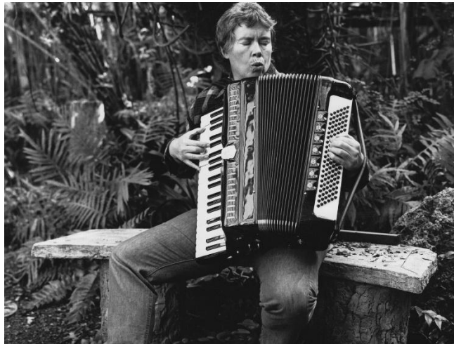
Resim 1. Pauline Oliveros (Roulette, 2023)

Amerikalı besteci ve akordeon sanatçısı Pauline Oliveros, 20. yüzyılın ikinci yarısında gelişen deneysel müzik hareketinin önemli temsilcilerinden biri olarak kabul edilmektedir. Özellikle elektronik müzik, doğaçlama ve ses araştırmalarına dayalı çalışmalarıyla Oliveros, müziğin geleneksel kompozisyon anlayışını genişleten sanatçılar arasında yer almıştır. Kariyerinin erken dönemlerinde San Francisco Tape Music Center çevresinde yürütülen deneysel müzik çalışmalarına katılan Oliveros, elektronik ses üretimi ve doğaçlama pratikleriyle deneysel müzik ortamının şekillenmesinde etkili olmuştur (Kahn, 2001, s.151). Bu çalışmalar, sesin yalnızca müzikal bir materyal olarak değil, aynı zamanda araştırılması gereken bir deneyim alanı olarak ele alınmasına katkı sağlamıştır.