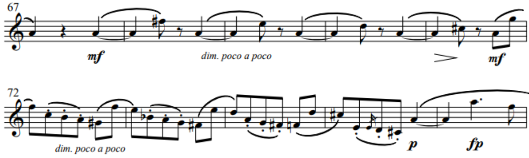
Resim 5. Obua ve Piyano için üç Romans “Birinci Romans” (Schumann, 1851)

67. ölçüden itibaren piyanonun sol elinde, bas partisinde uzun süre boyunca sürdürülen La sesi , üst seslerde meydana gelen armonik değişimlere rağmen sabit kalmaktadır. Üst seslerde akorlar ve melodik hareketlilik devam ederken, bas partisindeki bu durağanlık güçlü bir tonal merkez algısı oluşturmaktadır.