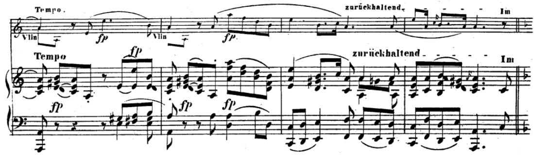
Resim 16. Obua ve Piyano için üç Romans Üçüncü Romans A Teması içindeki küçük c

Piyano ve obua, B temasının başlamasıyla birlikte etkileşimli bir diyalog oluşturmaktadır. Bu bölümde piyano, melodik çizgiyi üstlenmektedir (Knowlton, 2016, s. 8). Bu yapı, şarkının iç dünyasında doğadaki değişen unsurlar ile insanın duygusal dalgalanmaları arasında bir benzetme kurulmasına olanak sağlamaktadır. Müzikal açıdan Orta Kısım, A bölümünde kullanılan temalardan farklı bir melodi ve armonik yapı içermektedir. Bu bölümde tonalite değişimi ve müziğin duygusal ifadesi, A bölümünden belirgin biçimde ayrılan bir atmosfer oluşturmaktadır. Schumann, bu karşıtlık aracılığıyla dinleyiciyi A bölümünde tanıtılan tematik malzemeden uzaklaştırarak farklı bir duygusal alana yönlendirmektedir.