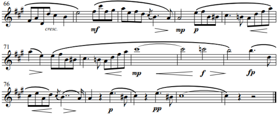
Resim 12. Obua ve Piyano için üç Romans İkinci Romans Coda teması (Schumann, 1851)

Son olarak 69. Ölçüde başlayan Coda bölümüyle parça sona erer.