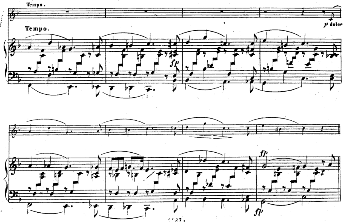
Resim 17. Obua ve Piyano için üç Romans Üçüncü Romans B Teması (Schumann, 1851)

Piyano ve obua, B temasının başlamasıyla birlikte etkileşimli bir diyalog oluşturmaktadır. Bu bölümde piyano, melodik çizgiyi üstlenmektedir (Knowlton, 2016, s. 8). Bu yapı, şarkının iç dünyasında doğadaki değişen unsurlar ile insanın duygusal dalgalanmaları arasında bir benzetme kurulmasına olanak sağlamaktadır. Müzikal açıdan Orta Kısım, A bölümünde kullanılan temalardan farklı bir melodi ve armonik yapı içermektedir. Bu bölümde tonalite değişimi ve müziğin duygusal ifadesi, A bölümünden belirgin biçimde ayrılan bir atmosfer oluşturmaktadır. Schumann, bu karşıtlık aracılığıyla dinleyiciyi A bölümünde tanıtılan tematik malzemeden uzaklaştırarak farklı bir duygusal alana yönlendirmektedir.