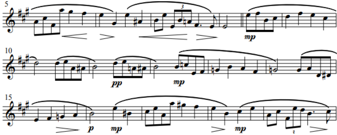
Resim 8. Obua ve Piyano için üç Romans İkinci Romans A Teması içindeki küçük b (Schumann, 1851)