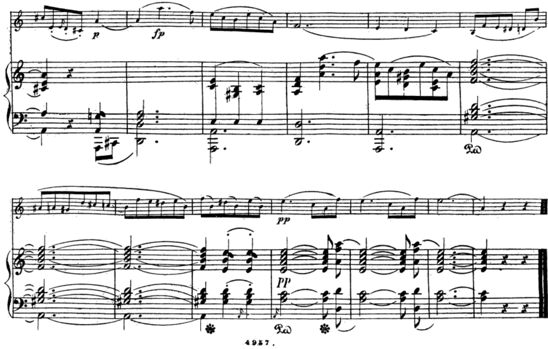
Resim 6. Obua ve Piyano için üç Romans “Birinci Romans” (Schumann, 1851)

67. ölçüden itibaren piyanonun sol elinde, bas partisinde uzun süre boyunca sürdürülen La sesi , üst seslerde meydana gelen armonik değişimlere rağmen sabit kalmaktadır. Üst seslerde akorlar ve melodik hareketlilik devam ederken, bas partisindeki bu durağanlık güçlü bir tonal merkez algısı oluşturmaktadır.