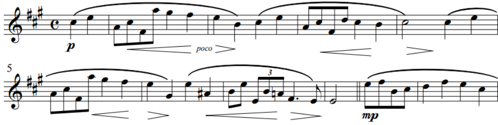
Resim 7. Obua ve Piyano için üç Romans İkinci Romans A Teması içindeki küçük a (Schumann, 1851)