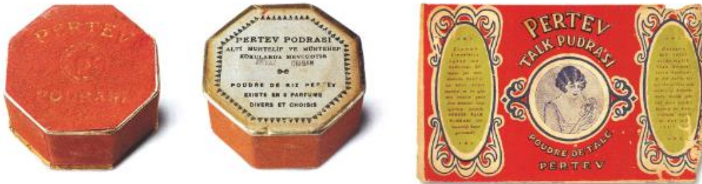
Görsel 5. Pertev Pudrası Ambalaj Tasarımı/ Pertev Talk Pudrası Kağıt Etiket Tasarımı.