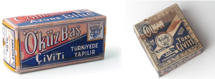
Görsel 16. Öküzbaş (Colman) Marka Renkli Ambalaj Tasarımı/ Colman Karton Çivit Ambalaj Tasarımı.

Yirminci yüzyıl öncesi yaşanan karmaşık dönem, kültürel olarak günümüzde de yaşanmakta olan döneme benzer özellikler göstermektedir. Batıya özenen tasarım modelinin, köklerini doğudan alan kimliği ile iç içe geçmesi ya da geçiş sağlayamamasından kaynaklı tasarım çözüm yöntemlerinin, geçmişte de de tasarımlara yansıdığı görülmektedir. Örnek çalışmalarda kimyasal temizleyicilere oranla çok daha berrak ve beyaz bir temizlik için eritilerek kullanılan çivit tozu ambalaj tasarımları görülmektedir. Günümüzde kullanımını neredeyse yok denecek kadar azalmıştır. Ürünün kullanımının azalması sonucu, ambalaj tasarımı da buna bağlı olarak alt raflardaki yerini başka ürünlere üzeredir. Yirminci yüzyıl öncesi yaşanan karmaşık dönem, kültürel olarak günümüzde de yaşanmakta olan döneme benzer özellikler göstermektedir.