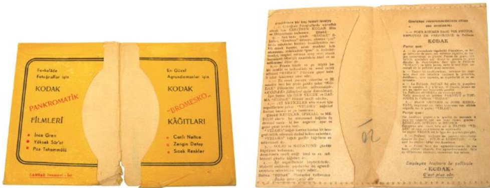
Görsel 20. Kodak Fotoğraf Saklama Zarfı İç Tasarım Örneği.

Kaybolmaya yüz tutmuş ambalaj tasarımlarından birisi de, kurutma aşamasından sonra, ütülemeden önce yapılan, geleneksel bir yöntem olan kolalamaya ait, pirinç kola ambalaj tasarımlarıdır. Atlı markasına ait halis pirinç kola markası, içinde bulunduğu döneme uygun olarak markasının isminden çıkış yolu bularak, bir atlı görseli kullanılmıştır. Çamaşırların daha kolay şekil alması, yenilenmesi, parlaması için pirinç ve plastik malzemeden yapılan katkı malzemesi olan pirinç kolası, günümüzde çok kullanılan bir ürün olmadığı için ürünle birlikte, ambalajı da yok olmaya yüz tutmuştur.