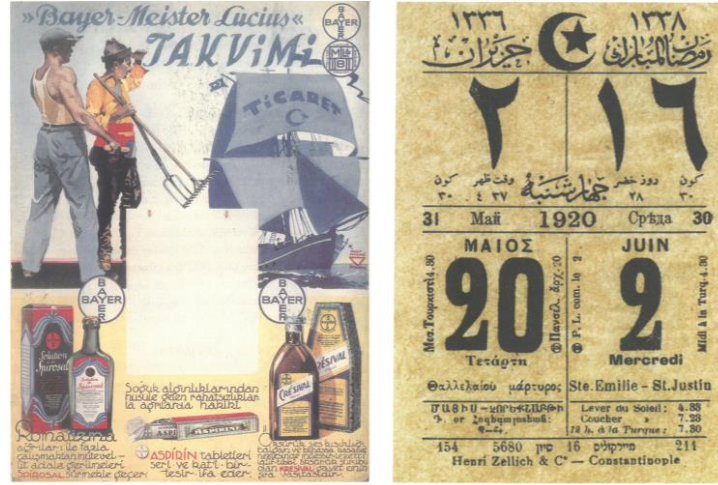
Görsel 10. Meister Lucus Takvim Altlığı / Takvim Yaprığı Örneği. Kaynak: Akçura, 2002, s.156 / Dündar, 2013, s.164.

Bayer markasına ait ambalaj tasarımlarının yer aldığı takvimler de ambalaj tanıtım çalışmalarının destekleyici bir promosyonu olarak kullanılmaktadır. Sadık Karamustafa arşivinde bulunan, 1920 yılında İstanbul Galata'daki Henri Zelliger Matbaası tarafından basılan takvim yaprağı örneği, İstanbul'da konuşulan, farklı dört dili barındıran tasarımı ile dönemin izlerini gözler önüne sermektedir (Dündar, 2013, s.164). Bayer firmasının Cumhuriyet'le birlikte Türkiye pazarına sunduğu diğer bir ürün olan Aspirin'in 1925 yılında başlayan tanıtım ve ilan çalışmaları, 1940'lı yılların sonuna kadar sürmüştür. Bayer ambalaj tasarımlarının yer aldığı Meister Lucus Takvim Altlığı, 1931 yılında İhap Hulusi Görey tarafından tasarlanmıştır.