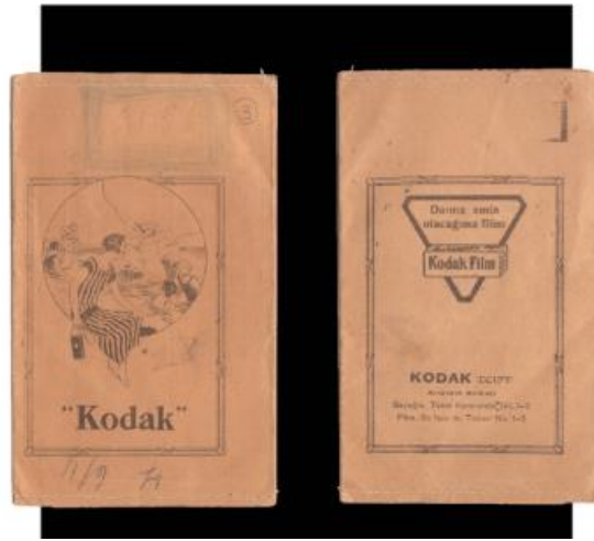
Görsel 19. Kodak Fotoğraf Saklama Zarfı Örneği.