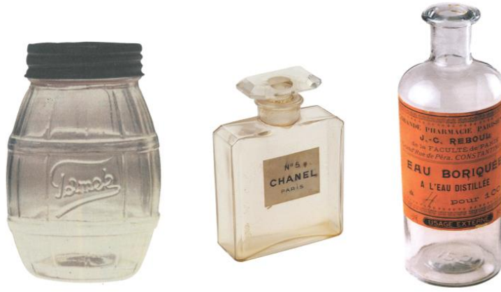
Görsel 3. Tamek Marka Cam Kavanoz Marmelat Ambalaj Tasarımı / Chanel Cam Şişe Ambalajı/ Borik Asit Cam Şişe Ambalajı.