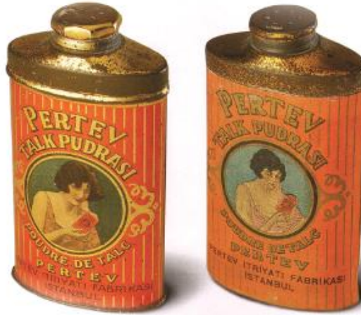
Görsel 4. Pertev Talk Pudrası Metal Ambalaj Tasarım Örneği.

“Osmanlı döneminde reklamlarıyla dikkat çeken kozmetik markalarının başında gelen Pertev markasının, tasarımlarına verdiği önem ürünlerinde görülmektedir. Ambalaj tasarımlarını Avrupa’da yaptırarak, ilgi çekici tasarımları ile döneme damgasını vurmaktadır. Dönemin öne çıkan kozmetik markaları arasında, Nivea, Tokalon markaları da bulunmaktadır” (Akçura, 2002, s.27). Tüketici bir ürünü satın alırken bir anlamda o ürünün ambalajına da inanarak, ürünü almaktadır. Bu bağlamda “Ürün, kullanıcısının toplumsal konumunu, sosyal ve politik dünya görüşünü, teknik anlayış ve yaklaşımlarını, eğitim düzeyini ve kültürel bağlılıklarını görsel olarak iletmek zorundadır” (Hakan, 1993, s.23). Tarihte de ambalaj tasarım fikrine, bu doğrultuda temeller atıldığı gözükmemektedir.