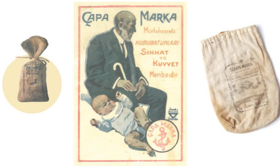
Görsel 9. Bozkurt Marka Pirinçunu Ambalaj Tasarımı/ TCHAPA Marka Çuval Bezi Ambalaj Örneği Çapa Marka/ İhap Hulusi Görey İmzalı İlan Örneği.

Yine ambalaj tasarımında döneminin önde gelen markalarından biri de ilanlarında İhap Hulusi Görey imzası görülen Çapa Markasıdır. Döneminin önemli bir markası olarak ürünleri ile ilgili birçok tanıtım yaptığı, ambalaj tasarımları ile dikkat çektiği görülmektedir. Bozkurt marka pirinç unu markasının da ambalaj malzeme seçiminde o dönemlerde sık kullanılan, çuval bezi malzemesini tercih ettiği görülmektedir.