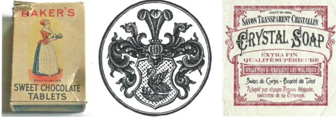
Görsel 1. Çikolata Ambalajı (1780)/ Wagner Ailesi Hanedan Arması (1873)/ 19. Yüzyıl Tipografi Baskı Tekniği ile Yapılmış Sabun Etiketi Kaynak: Becer, 2017, s.32-42.

“Sümerlerin İ.Ö. 2500 yıllarında geliştirdiği çivi yazısı, görsel betimlemenin; İ.Ö. 1500 yıllarında bir ticaret toplumu da sayılan Fenikelilerin bulduğu her harf için oluşan her işaret de ilk marka oluşumlarının, dönüm noktasını oluşturmuştur” (Becer, 2017, s.29). Toprakta yapılan şişe, kavanoz gibi en temel ambalaj ürünlerinin ises daha ilerideki süreçlere dayandığı tahmin edilmektedir. Tarih öncesinin ilk ambalaj örnekleri şarap ve zeytinyağları için kullanılan amforalardır.