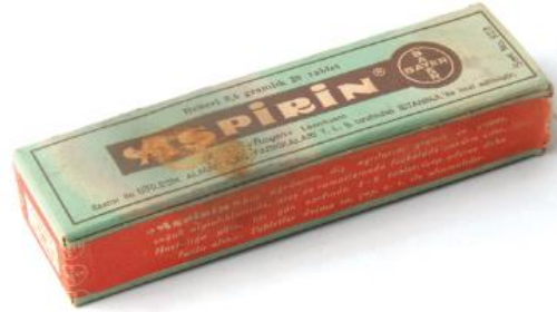
Görsel 11. Aspirin Markası İlan Örneği / Aspirin Marka Karton Kutu Ambalaj Tasarımı.

“Bu dönemde önemli gazete ve dergilerin birçoğunda Aspirin markasının özenli grafik tasarım çalışmaları ve reklam anlayışıyla oluşturulmuş tasarımları göze çarpmaktadır” (Akçura, 2002, s.147). Aspirin markasının Türkiye’de bu kadar tutunan ve aranan bir marka olmasının bir nedenini de Bayer, Türkiye Temsilciliği’nin yapmış olduğu bilinçli reklam anlayışına bağlamaktadır. Markaların ve ambalaj tasarımlarının taklitlerine geçmiş dönemlerde de rastlanmaktadır. Türkiye’de ilaç sektöründe yaşanan taklit edilen markalar, aslında dünya ölçeğinde de rastlanan bir durumdur. “İsrarla Aspirin İsteyiniz” sloganı ve “Taklitlerinden Sakınınız” uyarısı ile reklamlarını başarıyla devam ettiren aspirin