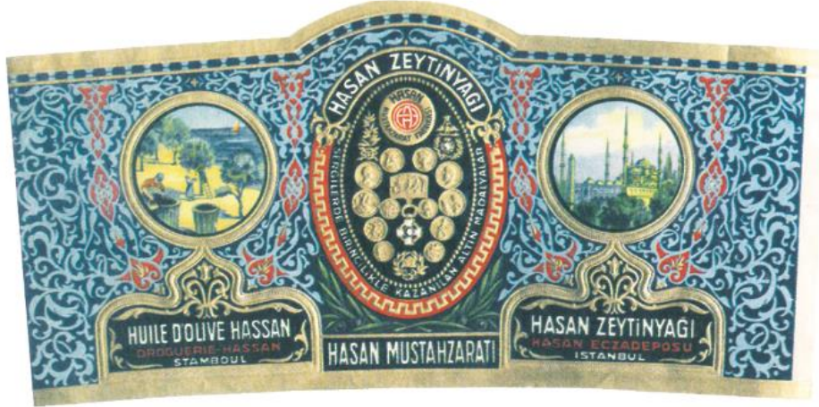
Görsel 2. Hasan Zeytinyağı Taş Baskı Etiketi (Cumhuriyet'in ilk yılları)

“Ambalaj tasarımında başka bir dönüm noktası da İ.S.105 yıllarında T'sai Lun tarafından kağıdın bulunmasıdır. O yıllarda kağıt, yazı yüzeyi olmasının yanında, paketlenme ve sarma malzemesi olarak da ambalaj görevi görmektedir” (Becer, 2004, s.29). “1796 yılında taş baskı (litografi) tekniğinin Bavyeralı sanatçı Alois Senefelder tarafından bulunmasıyla birlikte karton kutular, tahta baskılar, şişe ve teneke ambalajlarının üzeri için tasarlanan ambalajlar, taş baskı tekniği ile basılmaya başlamıştır” (Becer, 2004, s.32).