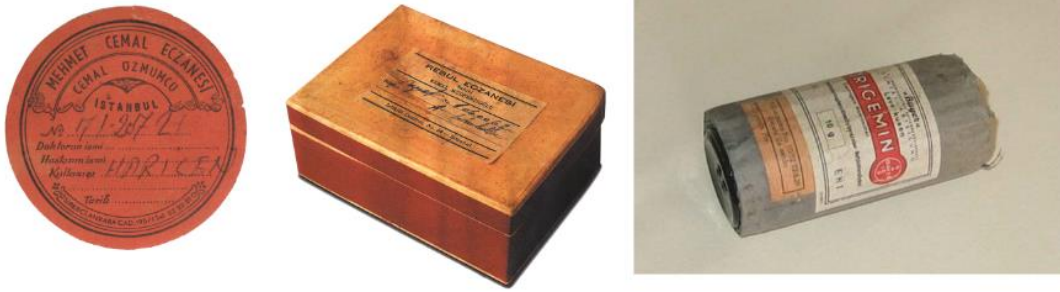
Görsel 8. Bayers Markasına ait Ambalaj Tasarımı/ Eczane Ürünü Etiket Tasarımı/ Rebul Eczanesine Ait Ahşap Ambalaj Kutusu.

Bir başka ambalaj tasarım ürünü de yaşayan en eski ambalaj tasarım malzemelerinden biri olan ahşaptır. 1980'li yıllar sonrasında Rebul Eczanesinin kullandığı, ahşap kutu üzerine yerleştirilen etiket örneği görülmektedir. Ahşap malzeme türevleri, günümüzde dayanıklı oluşu nedeniyle özellikle hassas, cam tasarım ürünlerinin koruyucu ambalaj tasarımlarında kullanılmaktadır. Geçirgen, nefes alan özelliği ile tazeliğini koruması gereken ürünlerin ambalaj tasarımlarında da tercih edilebilmektedir. Gelişen teknolojilerin getirdiği çözümler yeni problemleri de beraberinde getirebilmektedir. Örneğin artık ambalaj tasarımında kullanılan ahşap türlerinin özelliklerinin sayısının çoğalmış olması ve ahşabın yaşayan bir ürün olmasından kaynaklı olarak özellikleri ile ilgili resmi belgelendirme işlemlerine ihtiyaç duyulabilmektedir. Ancak ahşap üzerinde kullanılan, el yazısı ile doldurulan etiket kullanımı neredeyse sona ermiştir.