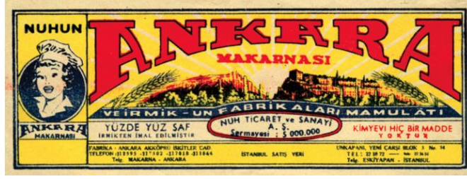
Görsel 14. Nuh'un Ankara Makarnası Etiket Tasarımı.