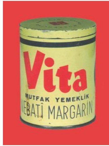
Görsel 6. Singer Dikiş Makinesi Alet Kutusu Ambalaj Tasarımı/ Vita Marka Ambalaj Tasarım Örneği.