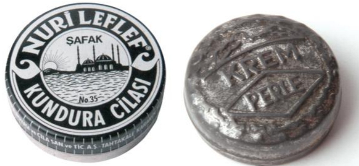
Görsel 7. Nuri Leflef Kundura Cilasası Ambalaj Tasarımı/ Krem Perle Ambalaj Tasarımı.

Metal ambalajların hammaddesi alüminyum, sac ve çelikten oluşmaktadır. Üretim hammaddelerinin ekonomik ve kolay elde edilebilir olması açısından, tercih edilen bir ambalaj türüdür. Kimyasal ürünler için kullanıldığı gibi işlenmiş gıda sektörlerinin de sıklıkla kullandığı bir ambalaj türüdür. İkonlaşmış bir ambalaj tasarım örneği de Nuri Leflef Kundura Cilasası ambalajıdır.