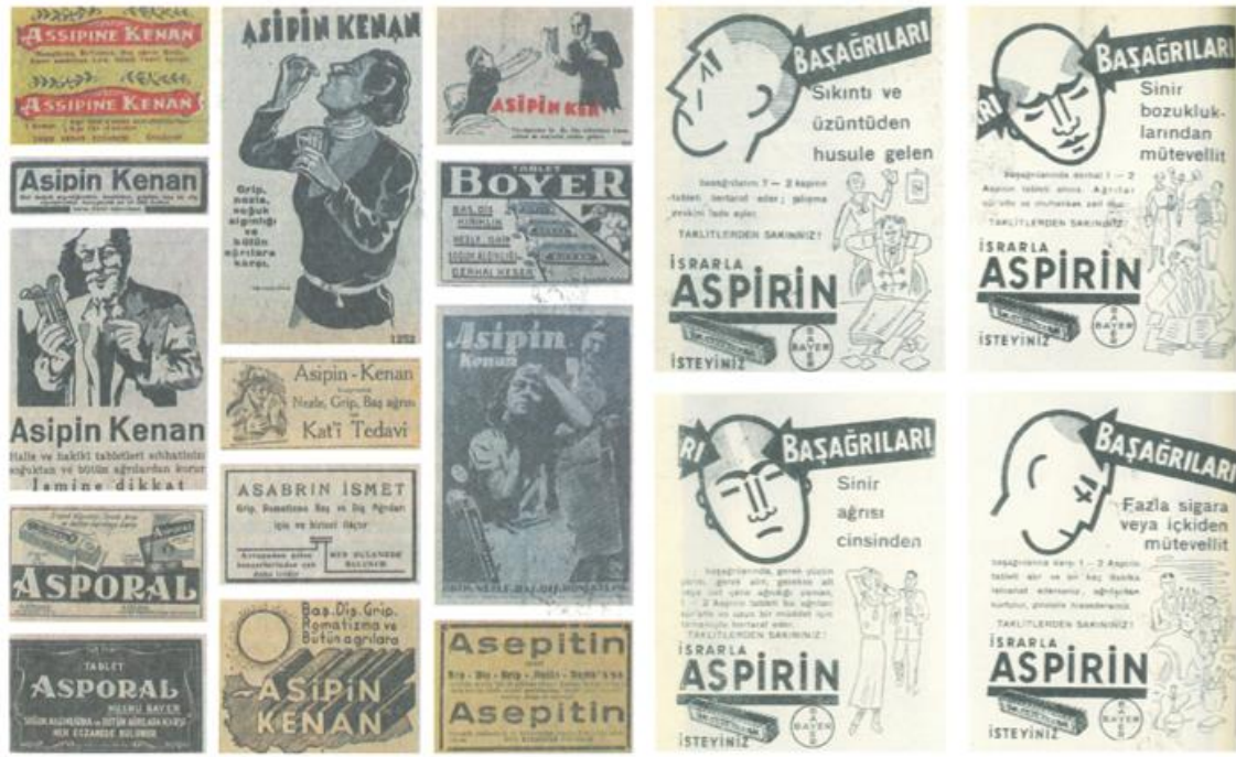
Görsel 12. Aspirin, Asipin, Asporal, Aseptin, Asabrin Markalarına Ait Duyuru ve Ambalaj Örnekleri.

markasının, ürünün ilanlarını sürekli geliştirerek ve yenileyerek, ürününü rakiplerinden koruma anlamında, reklamlarını artırmış olduğu bir dönem geçirdiği görülmektedir.