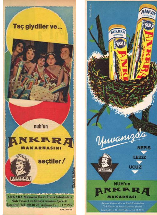
Görsel 15. Nuh'un Ankara Makarnası İlan ve İlan Ambalaj Örneği.