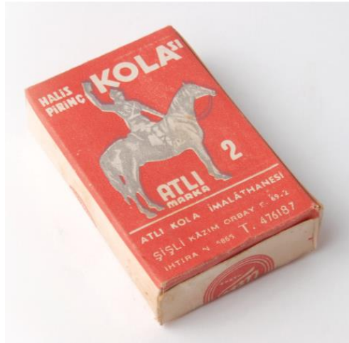
Görsel 21. Halis Marka Pirinç Kolası Ambalaj Tasarım Örneği.

Kaybolmaya yüz tutmuş ambalaj tasarımlarından birisi de, kurutma aşamasından sonra, ütülemeden önce yapılan, geleneksel bir yöntem olan kolalamaya ait, pirinç kola ambalaj tasarımlarıdır. Atlı markasına ait halis pirinç kola markası, içinde bulunduğu döneme uygun olarak markasının isminden çıkış yolu bularak, bir atlı görseli kullanılmıştır. Çamaşırların daha kolay şekil alması, yenilenmesi, parlaması için pirinç ve plastik malzemeden yapılan katkı malzemesi olan pirinç kolası, günümüzde çok kullanılan bir ürün olmadığı için ürünle birlikte, ambalajı da yok olmaya yüz tutmuştur.