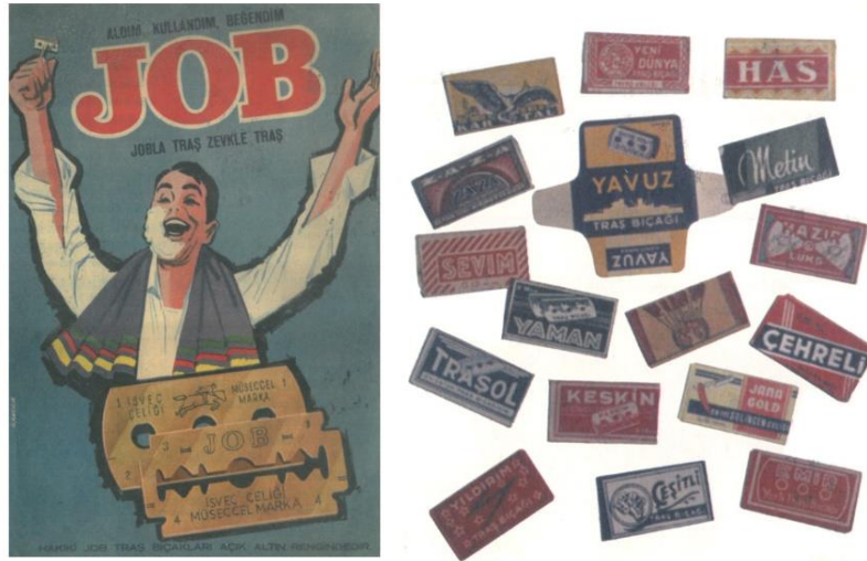
Görsel 13. Çeşitli Markalara Ait Jilet Ambalajı Tasarım Örnekleri.

“Cumhuriyetle birlikte jiletler de yeni bir reklam unsuru, öznesi haline gelmiştir. Halis İsvaç çeliğinden yapıldıklarını iddia eden bir dizi yerli traş bıçağı da bu dönemde ortaya çıkmıştır” (Akçura, 2002, s. 33). Yamam, Has, Metin, Sevim, Keskin, Zaza, Altun markaları dönem içerisinde göze çarpan ürünlerin ambalaj tasarımlarını oluşturmaktadır.