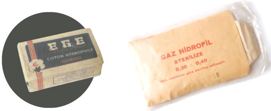
Görsel 17. Ege Hidrofил Pamuk Ambalaj Tasarımı/ Steril Hidrofил Gaz Bezi Ambalaj Tasarımı.

Döneminin eski örneklerinden birisi de steril hidrofил gaz bezi ambalaj tasarımıdır. Küçük çaplı yaraların temizlenmesinde, sarılmasında kullanılan, genel ihtiyaca yönelik bir medikal ürün olarak pratik bir ambalaj içerisinde satılmaktadır. Sadece ürüne ait bilgilerin genel olarak verildiği, kağıt üzerine tek renk baskı yöntemi ile hazırlanan bir ambalaj tasarımıdır. Bu ambalaj tasarım türünün de yavaş yavaş yok olmaya başladığı görülmektedir. Steril hidrofил gazlı bez ürünleri, çeşitli markaların özelinde farklı hedef kitlelere yönelik oluşturulmuş, farklı tipte ve özellikte, karton kutuların içerisinde pazarlanmaktadır. Görsellerin, illüstrasyonların kullanıldığı, renkli yeni ambalaj tasarım türleri içerisinde, medikal sektördeki yerini almıştır.