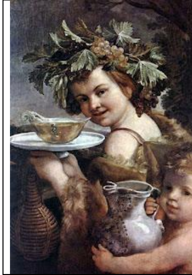
Resim 1. Junior Bacchus - Guido Reni

Amerikalı araştırmacılar tarafından yapılan arkeolojik kazılar sonucunda, tanrının Latince isminin Bacchus olduğu ve özellikle Yunanistan'da ve diğer topraklarda şarap tanrısı olarak anıldığı saptanmıştır (Taşlıklıoğlu, 2011, s. 182). Tanrı Dionysos adı dışında; Bakkhus (dinin surlarına erişmek) bazen Iobakkhos (bildiren olarak da bilinen), Euhios (kadın takipçileri tarafından ayinlerde "euhoy" veya "euhay" söylemlerinden türemiştir), Bromios (haykıran), Iakkhos (çığlık), Eleutheros (özgür) ve Dithyrambos (iki kez doğan anlamlarında) isimleri ile de bilinmektedir (Güzel, 2006, s. 2-3). Tanrı birçok farklı şekilde tasvir edilmektedir. Bazen elinde Thyrsos (asa), bazen şarap testisi bazense sakallı olarak betimlenmektedir (Kara, 2021, s. 13).