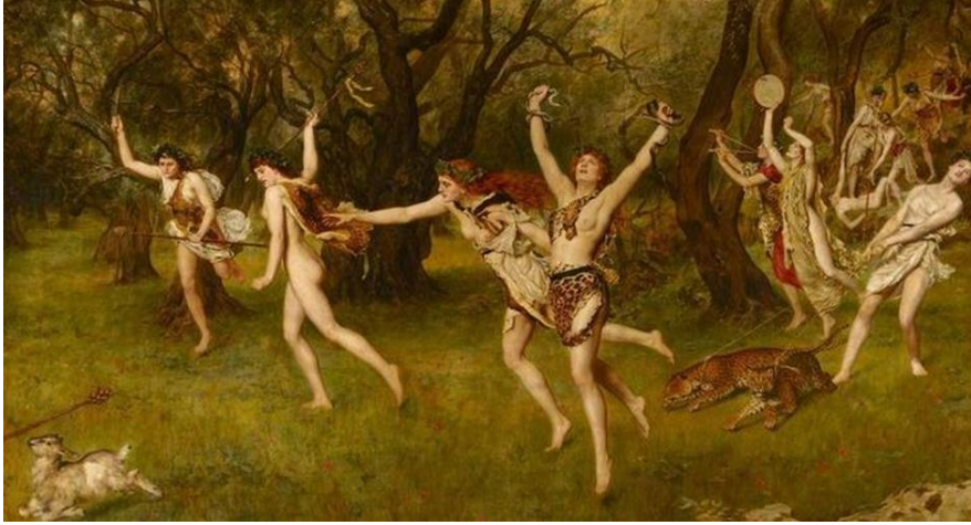
Resim 12. John Collier, Deliler, Kaynak: Pinterest, 2021b

yapılmış taçlar, ellerinde tanrının simgesi olan thyrsos geç vakitlerde tanrıyı aramak için dağlara çıktıkları söylenmektedir. Bu kadınlar sakin ve olgun bir ruh halindeyse thyas ismini almaktadır. Tam tersi aşırılık ve delilik halindeyse mainad olarak adlandırılmaktadır (Güzel, 2006, s. 25).