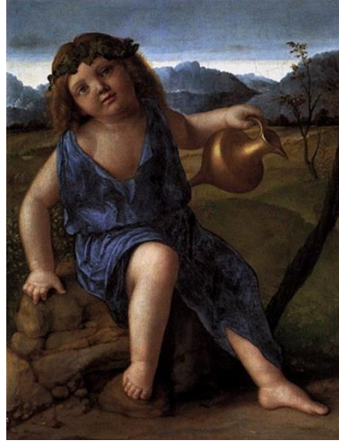
Resim 5. Bebek Bacchus, (c. 1505–1510), Giovanni Bellini