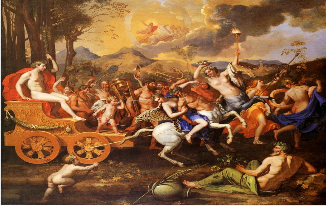
Resim 10. Bacchanalia, Sebastian Bourdon, Kaynak: Güzel, 2006

Bu birleşmeden Skaphylos (üzüm salkımı) meydana gelmiştir. Dionysos çiftçiye teşekkür etmek için şarap armağan etmiştir. İkarıa verilen şarabı yakınlarıyla paylaşmıştır. Şarabın verdiği kendinden geçiş haliyle ilk kez tanışan insanlar öldürülmeye çalıştıklarını zannedip çiftçiye öldürmüştür. Babasının ölümü üzerine çiftçinin kızı (Erigone) da kendisini ağaca asarak öldürmüştür. Tanrı bu olayın üzerine Atina'daki tüm kızları delirtmiş ve kızlar da kendilerini tıpkı Erigone gibi öldürmüştür. Bu olay tanrı tarafından çiftçi ve kızına verilen bir lanet olarak yorumlanmıştır. Bu deliliğin son bulması için Erigone onuruna bir şenlik düzenlenmesi gerekmiştir. Bu nedenle hasat zamanı Dionysos, çiftçi ve kızı adına bayram düzenlemeye başlanmıştır. Bu bayrama Aiora denmektedir. Asteria bayramının üçüncü günü ile bağlantılı olduğu söylenmektedir. Şenlikte gizemli bir hava ile Atina'daki kızlar Erigone'nin ölümünün yasını tutmak için ağaçlara kurulan salıncaklarda sallanmaktadır (Dökü, 2002, s. 24; Pişkin, 2007, s. 34).