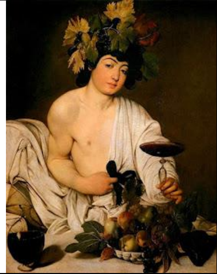
Resim 3. Dionysos - Caravaggio