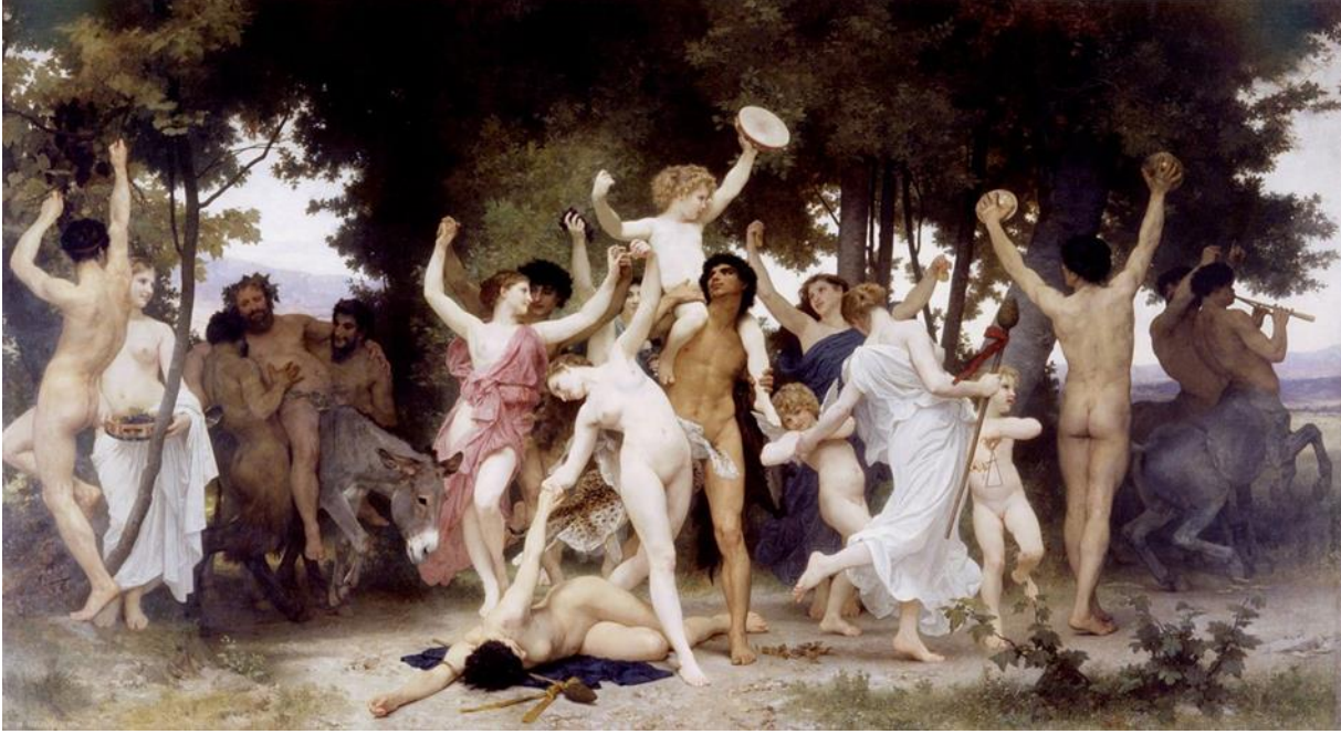
Resim 13. Dionysos'un gençliđi, Adolphe Bouguereau

yarıřmaları yapılmaktadır (Çağlayan Takımcı, 2016, s. 37-38). 13.gün festivalin üçüncü gününde ise Khyro (Resim 13) (bitki tohumlarının piřirildiđi kap) yeryüzünde dolařan ruhlar için yemek yapıp onları memnun etmeye çalıřıp evlerine girmesin diye kapılarının önüne zift sürölmektedir. Günün sonuna gelindiđinde ise Anthesteria bitti diyerek ruhların yer altına dönmesi beklenmektedir (Piřkin, 2007, s. 33).