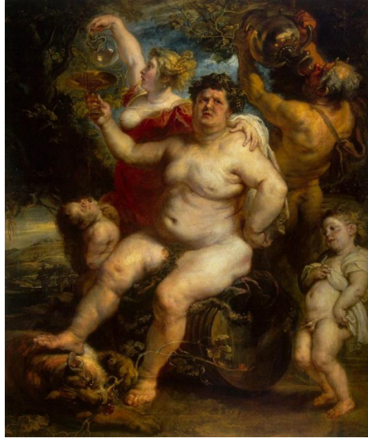
Resim 6. Pieter Poul Rubens, Dionysos, Kaynak: Pinterest, 2021c