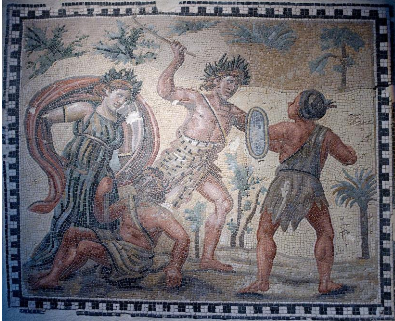
Resim 9. Dionysos'un Hint'liler ililer ile kavgası 4. yy Villa Rufinella i Tusculum

Yunanistan'ı gezdiği yolculuk sırasında annesinin ülkesi Thebai'ye yolu düşmüştür. Tanrının alayının coşkunu ve taşkınlığı karşısında Kral Pentheus ülkesinde Dionysos törenlerini yasaklamış ve tanrıyı hapsedmiştir. Demir parmaklıklar kendiliğinden açılmıştır. Bakkhaların öncüsü kralın annesidir. Kral bakkhaları izlerken annesi tarafından vahşi bir hayvan sanılarak öldürülmüştür (Estin ve Laporte, 2008, s. 141-142). Dionysos'un şarabı halkla tanıştırmaya ise bir çiftçi (İkaria) sayesinde olmuştur. Yunanistan'a gelen Dionysos bu çiftçi tarafından ağırlandı. Bu sırada çiftçinin kızı Erigone ile birlikte olmuştur.