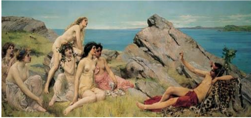
Resim 7. Dionysos ve nemfler, John Reinhard Weguelin, Kaynak: Wikiwand, 2021

Dionysos'un doğum söylencelerinde de görüldüğü üzere tanrının yer altı dünyası ile bağlantısı bulunmaktadır. Bunu destekleyen diğer bir unsur ise Mısırlılar yer altı dünyasının tanrıları olarak Hades ve Dionysos'u göstermektedir (Gerçek, 2016, s. 81). Dionysos büyüdükçe mağaranın etrafındaki asmada büyümekteydi. Dionysos mağaranın etrafındaki asmadan topladığı üzümlerden elde ettiği üzüm suyunu onu büyüten periler ve ona eşlik eden kafilesi ile paylaşmasıyla hissettikleri mutluluk ve kendinden geçişle şarabın doğuşu da gerçekleşmiştir (Can, 2020, s. 179).