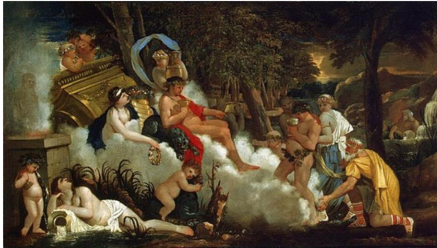
Resim 8. Sébastien Bourdon, Bacchanalia, 17. yy.

Dionysos'un doğum söylencelerinde de görüldüğü üzere tanrının yer altı dünyası ile bağlantısı bulunmaktadır. Bunu destekleyen diğer bir unsur ise Mısırlılar yer altı dünyasının tanrıları olarak Hades ve Dionysos'u göstermektedir (Gerçek, 2016, s. 81). Dionysos büyüdükçe mağaranın etrafındaki asmada büyümekteydi. Dionysos mağaranın etrafındaki asmadan topladığı üzümlerden elde ettiği üzüm suyunu onu büyüten periler ve ona eşlik eden kafilesi ile paylaşmasıyla hissettikleri mutluluk ve kendinden geçişle şarabın doğuşu da gerçekleşmiştir (Can, 2020, s. 179).