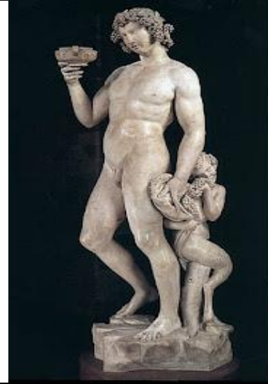
Resim 2. Michelangelo Buonarroti - Sarhoş Bacchuss