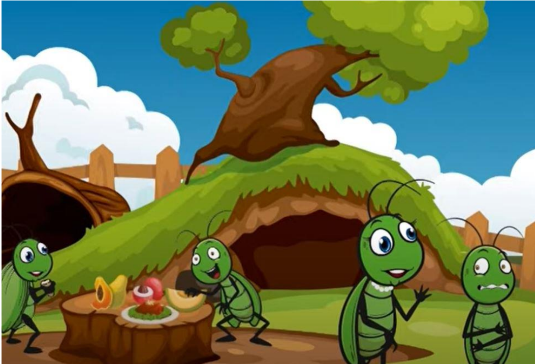
Resim 3. Mızımız Sinek Adlı Videodan Bir Kesit

2018 yılında YouTube’a katılan Türkçe Masallar çocuklar için eğitici, öğretici ve eğlenceli içerikler hazırlayan bir yayın evidir. Kanal içerisinde iki boyutlu hazırlanmış animasyon videoları bulunmaktadır.