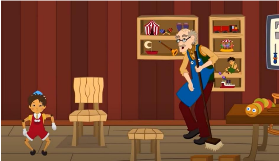
Resim 1. Pinokyo Adlı Videodan Bir Kesit

Türkçe Masallar – Turkish Fairy Tales kanalında hazırlanan “Pinokyo” masalının 3 Aralık 2019 tarihinde yüklenerek 14.213.024 görüntülemeye ulaştığı görülmektedir.