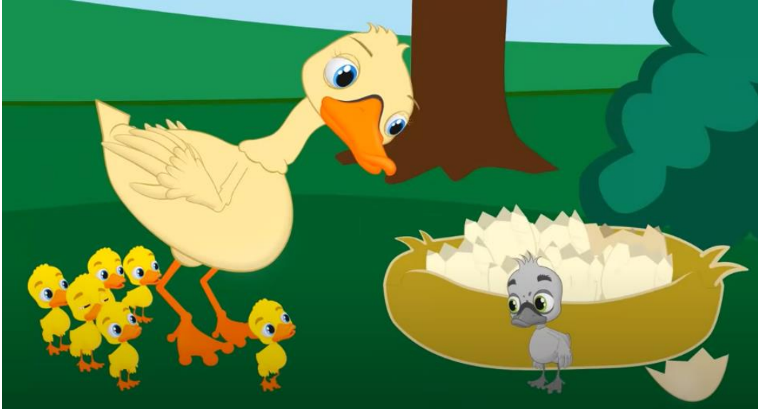
Resim 2. Çirkin Ördek Yavrusu Adlı Videodan Bir Kesit

Adisebaba Masal kanalında hazırlanan “Çirkin Ördek Yavrusu” masalının 24 Ocak 2021 tarihinde yüklenerek 3.860.663 görüntülemeye ulaştığı görülmektedir.