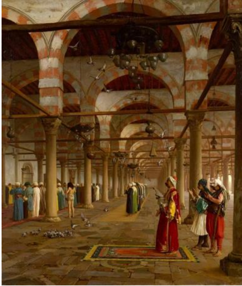
Görsel 5. Gerome, Camide Namaz Kılanlar. 1871, 88,9 x 74,9 cm, Metropolitan Museum New York, (URL5).