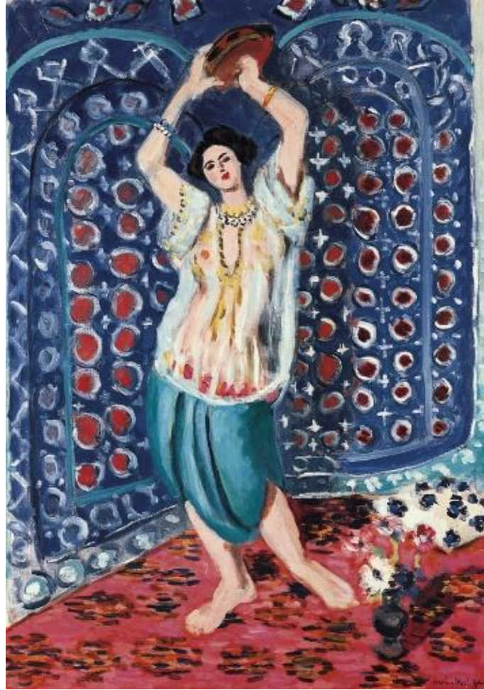
Görsel 10. Matisse, Tef ile Odalık (Mavi Uyum),1926, Norton Simon Sanat Vakfı, (URL10).