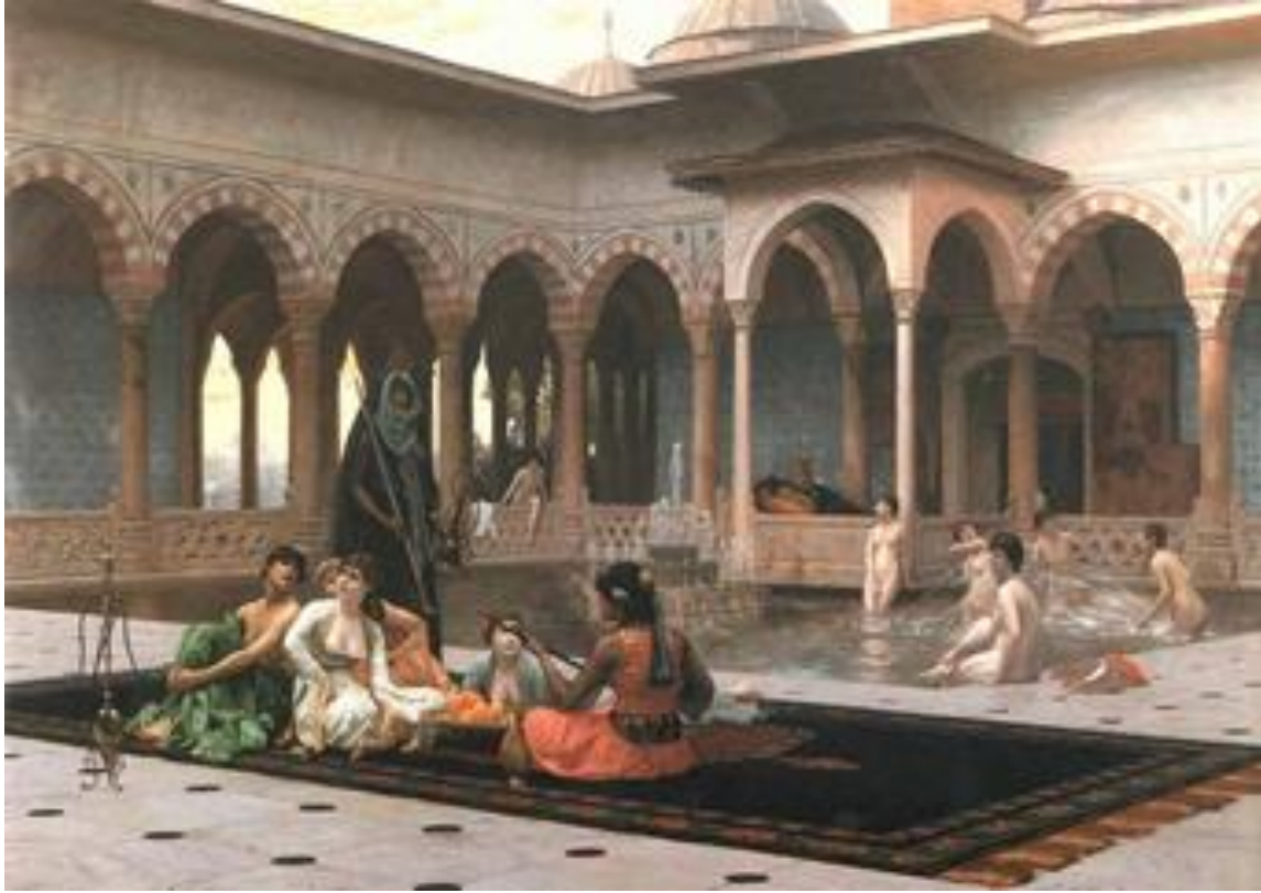
Görsel 6. Gerome, Saray Terasında, 1886, Tuval Üzeri Yağlı Boya, 82 X 122 Cm, Özel Koleksiyon, (URL6).