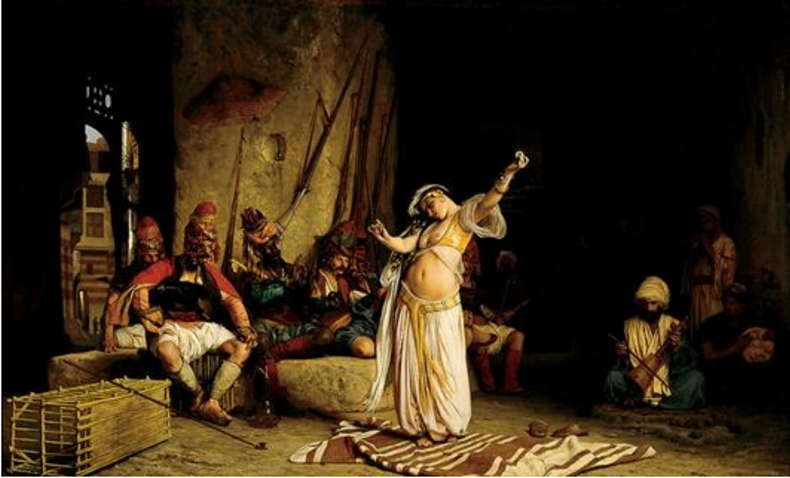
Görsel 4. Gerome, “The Dance of the Almeh” tuval üstüne yağlıboya, 1863, 63 x 84.3 cm, Dayton Art Institute, (URL4).