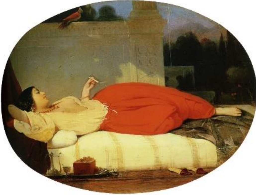
Görsel 9. Odalık, 1830, 35,22,9 X 31,8 cm, Norton Simon Sanat Müzesi, Pasadena, (URL9).