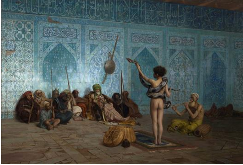
Görsel 3. Gerome, “Yılan Oynatıcısı”, 82.2 × 121 cm. yak. 1879, The Clark Art Institute, (URL3).

Gerome'un bu resmi tamamen Doğu'ya ait bir sahneyi betimlemekle birlikte Batılı gözün bakışının gücünü hissetmemek mümkün değildir. Bu ve benzeri resimlerde Doğu'nun özellikle birbirlerine yönelik, vahşetine sık sık rastlanırken, savaş sahnelerinde dahi Batının vahşetine ve acımasızlığına dair izlere kesinlikle rastlamaktayız. Bu resimde zaman kavramı da görülmemektedir. Çünkü döneme ait hiçbir teknolojik araç gerece rastlanmamaktadır. Resimde zaman belirsiz bir yerde durmuş gibidir. Bununla da Batının dinamizmi karşısında, Doğu'nun durağanlığı ve Batılıların Doğulular karşısındaki üstünlüğünü vurgulamayı amaçlamaktadır. Böylelikle Doğu sembolik olarak yönetilmesi gereken bir şey olarak yeniden oluşturulmuştur. Politik yaklaşımların yanı sıra resimde cinsellik vurgulanarak Batının erotizm arzusunu, kendisini uzak bir kültürün temsili şeklinde göstermektedir.