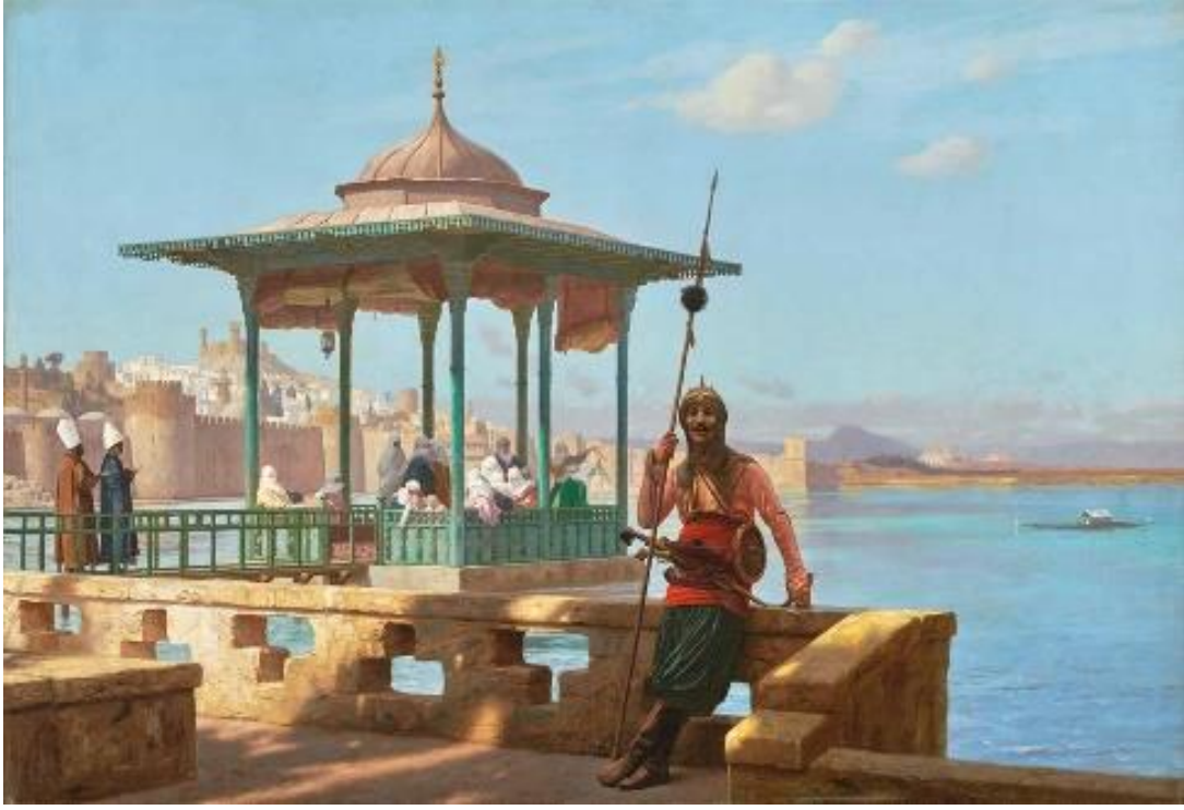
Görsel 2. J. L. Gerome, Sarayda Harem'den, 1886, 82 X 122 cm. Tuval Üzerine Yağlıboya, (URL2).