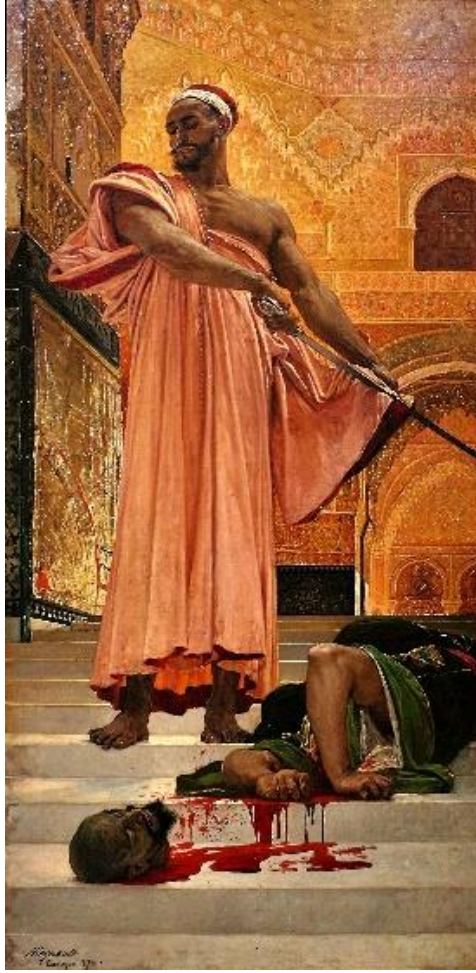
Görsel 8. Yargısız İnfaz, 1870, Tuval Üzerine Yağlıboya, Müze d'Orsay, Paris, (URL8).