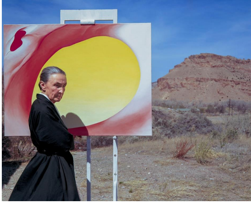
Resim 2: Yayoi Kusama'nın Hayran Olduğu Georgia O'Keffe ve Dalgalı Çiçekleri

1957 yılında büyük uğraşları sonucu ABD'ye gidebilmiştir. O dönem sanatın merkezi Amerika'dır. Resim sanatı bağlamında galeriler, sergiler büyük ilgi görmekte ve sanatçılar piyasada var olurlarsa çok da para kazanmaktadır. Avangart birçok akımın da kendini gösterdiği yıllarda o tam da kendini ve bilinçaltı psiko sanatını göstermek için hayali olan Amerika'ya ulaşmıştır.