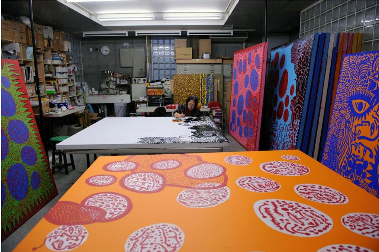
Resim 4: Yayoi Kusama'nın Akıl Hastanesi Yanında Yer Alan Stüdyosu/Atölyesi

Hayatındaki iniş çıkışlar, akıl hastalığının artışı üzerine bu derin üzüntü de gelince, Japonya'ya dönerek kendi isteğiyle akıl hastanesine yatıyor (Örnek, 2016) (Resim 4).