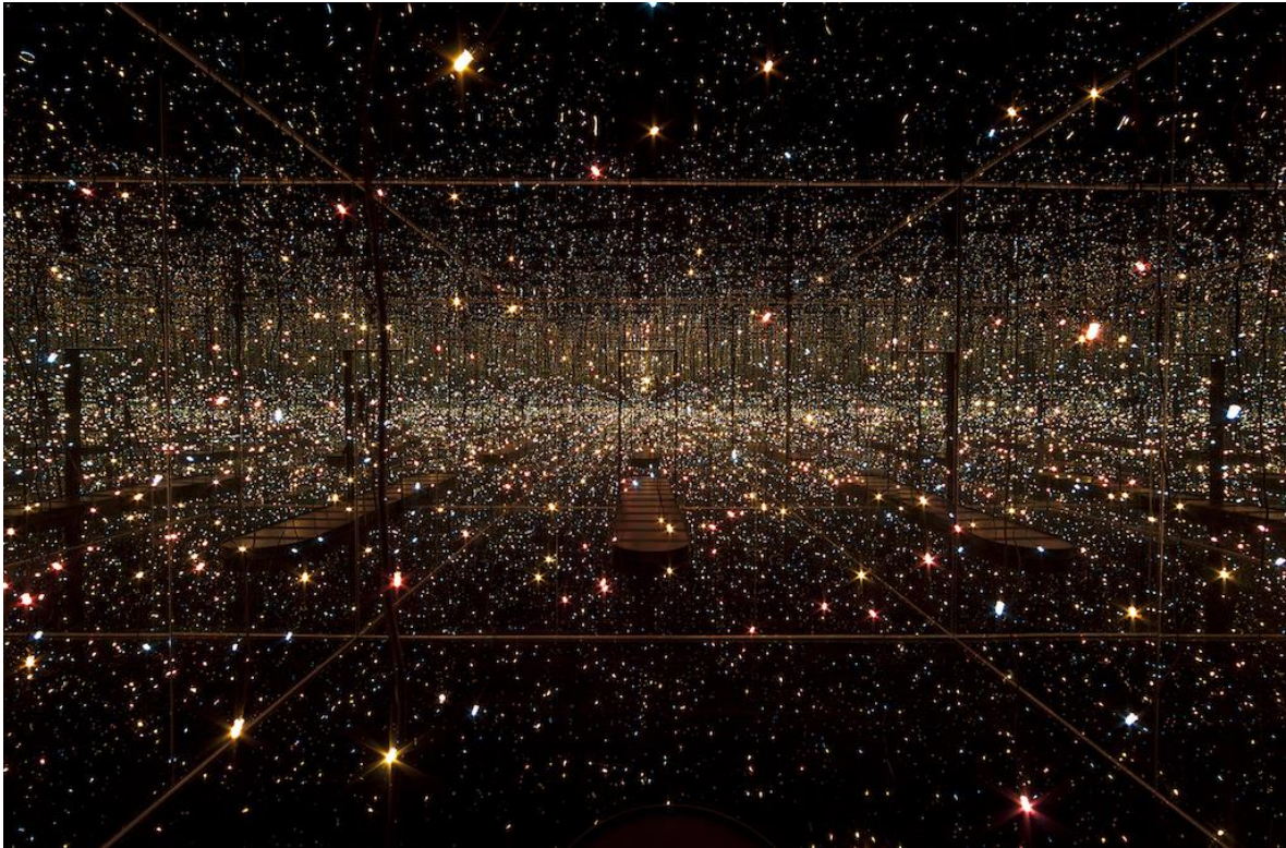
Resim 6: Yayoi Kusama, Silinmişlik Odası, Suda Ateşböcekleri, Aynalar, Pleksiglass, Işıklar, Su, 2002, Toledo Müzesi Kaynak: URL 7

Olağanüstü çalışma azmi, işlerinin güncel sanat anlayışında kabul görmesi, onu hep zirveye taşımıştır. İlk ciddi çalışmalarından biri olan Çocuklar için tasarladığı “Silinmişlik Odası” ile bunu izleyen diğer projeleriyle adeta bir fenomen haline gelmiştir.” (Kıran, 2013: 119; Monro, 2012: 78) (Resim 6).