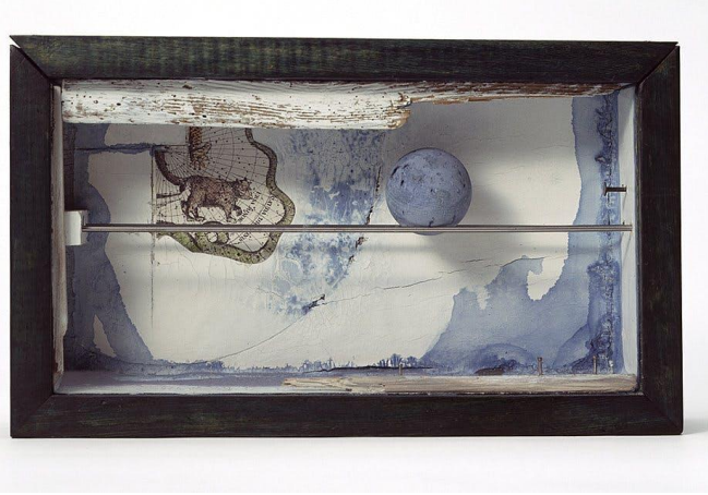
Resim 3: Joseph Cornell ve Çalışmaları; Kolajlar ve Assemblajlar

Hayatındaki iniş çıkışlar, akıl hastalığının artışı üzerine bu derin üzüntü de gelince, Japonya'ya dönerek kendi isteğiyle akıl hastanesine yatıyor (Örnek, 2016) (Resim 4).