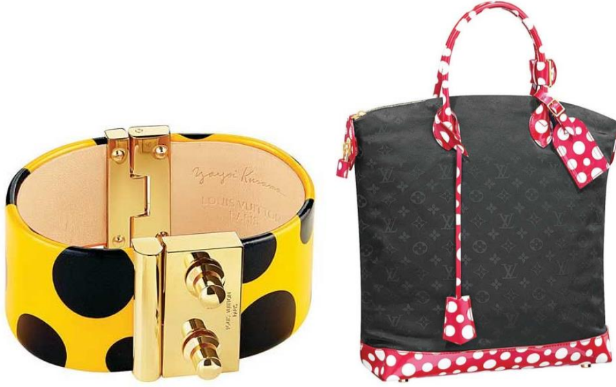
Resim 5: Louis Vuitton & Yayoi Kusama Tasarımları

öldüreceğini ve aslında sanatının onu tedavi ettiğini sürekli dile getiren sanatçı hastanenin yanındaki atölyesinde çalışmalarına devam ediyor (Resim 5).