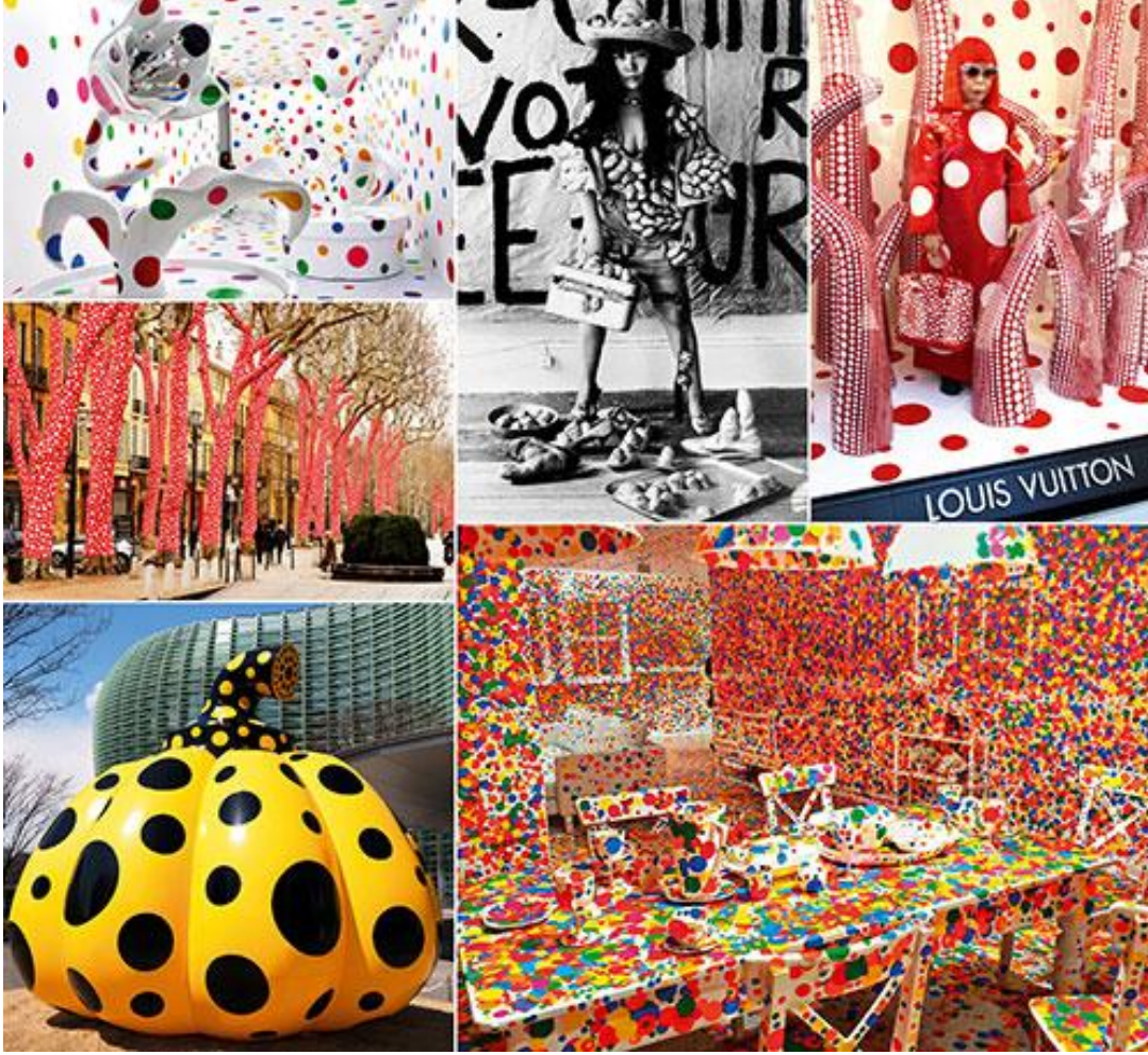
Resim 1: Yayoi Kusama ve Sanatı, Kolaj Fotoğraf