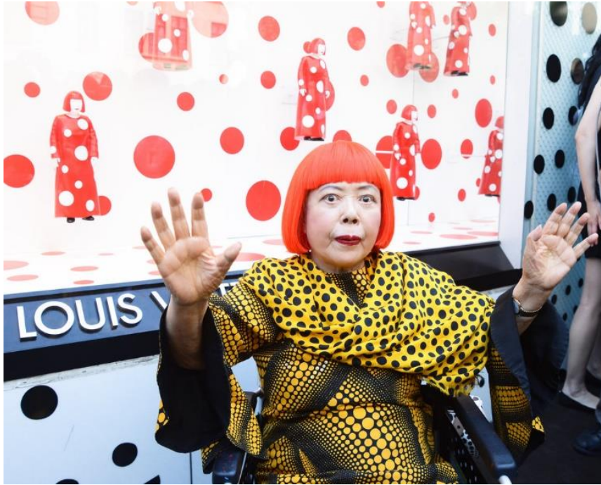
Resim 7: Yayoi Kusama ve Kendine Has Tarzı Çalışmalarıyla Bütünlük İçindedir

Kusama sanatın terapötik sürecini yaşayarak öğrenmiştir. Onun sanatı, benekleri (Polka Dots), görülerindeki dalgaları, ateş böcekleri, ışıkları aslında onun terapisi olmuştur. Sanatla terapinin iyileştirici gücü, kişinin kendini keşfi günümüz Türkiye’inde bile 2012 yılı itibariyle dernekleşme ve eğitimlerin oluşturulması ile kendini ciddi anlamda sanat alanında ve sağlık alanında göstermektedir. O, terapisini sanat ile gerçekleştirerek kendi sağaltımını-katarsisini yaşamaktadır ve yaşamıştır da. Art Brut sanat hareketinde de durum benzerdi. O sebeple aslında Kusama, Art Brut hareketinin bir temsilcisi olarak da yer alabilir. Tıpkı Art Brut sanatçıları gibi –ki sanat eğitimi almış olma şartı orada da yoktu– o da kendi psikolojik ve psikiyatrik hastalığının dışavurumunu en duru şekilde sanatıyla ortaya çıkarmıştır. Onu bu denli ünlü ve bilinen yapan da bu rahatsızlığı ile sanatını birleştirmesi olmuştur (Resim 7).