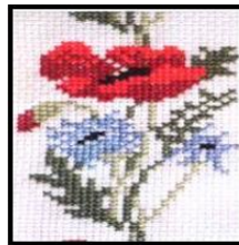
Görsel 7: Etamin Kanaviçe İşleme