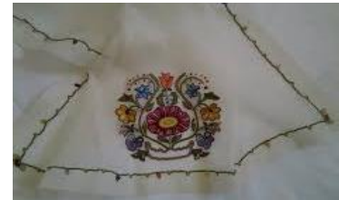
Görsel 8: Ödemiş İpeği