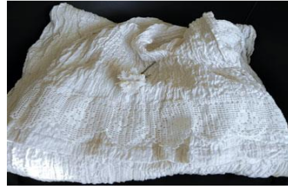
Görsel 4-5: Özkavruk Adanır, Kuleli ve Dikkaya Gökür, t.y.

Bir diğer el sanatı olan kanaviçe işinin tarihine bakıldığında, İbrani tarihi Nuh peygamber zamanında kanaviçe ile işlenmiş çeşitli eşyaların bulunduğunu yazmaktadır. Bu durum kanaviçe sanatının Asya'dan Avrupa'ya geçtiğini ve 16. yüzyılda ise sevilen el sanatlarından biri olduğunu açıklamaktadır (URL 12). Kanaviçe işleme tekniği Türklerde 16.yüzyıl itibariyle kullanılmaya başlanmış, 19. Yüzyıl itibariyle Anadolu Türk Halk işlemleri arasında yer almıştır (URL 13). TDK sözlüğünde kanaviçe sözcüğü; el işleri için kullanılan seyrek dokunmuş keten bezi ve bu bezin üzerine yapılan işlemdir (URL 2). Kanaviçe (kanava), dikiş ve nakışın dekoratif bir şekil almasıyla oluşan bir işlemin adıdır. İtalyanca Canavaccio sözcüğünden dilimize geçmiş olan kanaviçe, seyrek dokunuşlu, keten kumaşlar üzerinde çapraz iğneyle yapılan işlemeye denir. Kanaviçe tekniğinin desenleri, kareli veya milimetrik kâğıtlara çizilerek renklendirilir. Kanaviçe işinde daha çok geometrik ve çiçek desenleri tercih edilmektedir. Kanaviçe, yatak ve mutfak takımlarında, seccade, havlu, yastık, panolar ile giyim süslemelerinde kullanılan bir işleme türüdür. Kanaviçe işleminde kullanılan kumaşlar; Keten, Patiska, Saten, Ödemiş İpeği, Terilen ve Etamin vb. olarak sıralanabilir (URL 12).