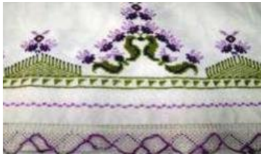
Görsel 6: Yatak Takımı

Üretim sanayinde meydana gelen teknolojik gelişmeler ile oluşan seri üretim ve moda el sanatlarını ve dolayısıyla kanaviçe işini de olumsuz etkilemiştir (Köşker ve Karacaoğlu, 2019: 993). Somut olmayan kültürel miras ürünlerinden el sanatları ve kanaviçe işi de sınırlı sayıda kişinin çabalarıyla yaşatılmaya çalışılmaktadır (URL 14).