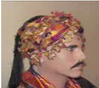
Görsel 1: Alfes

Ödemiş geleneksel el sanatlarından iğne oyası TDK sözlüğünde, iğneyle değişik biçimli veya düğümlü ilmekler oluşturularak ve bunlar birleştirilerek yapılan oya (URL 2) olarak tanımlanmaktadır. İğne oyaları ise, ipek, pamuk ve sentetik ipler kullanılarak yapılmaktadır (URL 10). Ödemiş iğne oyaları geleneksel olarak, yazma ve çember kenarlarında, değirme adı verilen namaz örtüleri kenarlarında, göynek denilen giysilerin kol ve yaka uçlarında, para ve altın keselerinde, karyola takımlarında, efelerin baş giysisi olan alfes (yünden yapılmış keçe başlık) saran çemberin, kefiye adı verilen ve boyuna sarılan bir tür fuların ve saat kesesinin süslemeleri ve kadınların kullandığı, pamuklu ya da ipekli kumaşlardan yapılan ve tek bir kenarında iğne oyası bulunan dikdörtgen bir başörtüsü olan değirme ile dört tarafı oya ve kare şeklinde olan yazmada kullanılmaktadır (Evecen vd., 2017: 325).