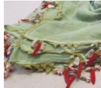
Görsel 3: Yazma (Biber Oyası)