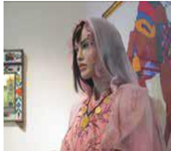
Görsel 2: Değirme