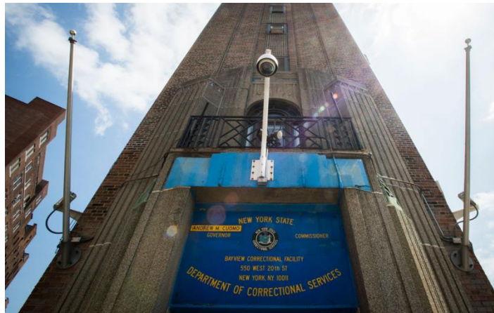
Görsel 10: Site Blok Girişleri Kamera ve Kartlı Kayıt ve Denetim Sistemleri III (http 4).

Site içinde uygulanmakta olan tüm bu sistemlerle yetinilmeyip , farklı bireysel önlemlerin de daire sahipleri tarafından alındığı tespit edilmiştir. Adeta kendi bir hücreye kapatılarak , disipline etme çabasında olan bir mahkum gibi daire girişlerine özel güvenlik alarmı taktiranların durumunda bir hücreye kapatılarak dışarıdan tehir edilmiş bir hükümlüden farklı değildir.