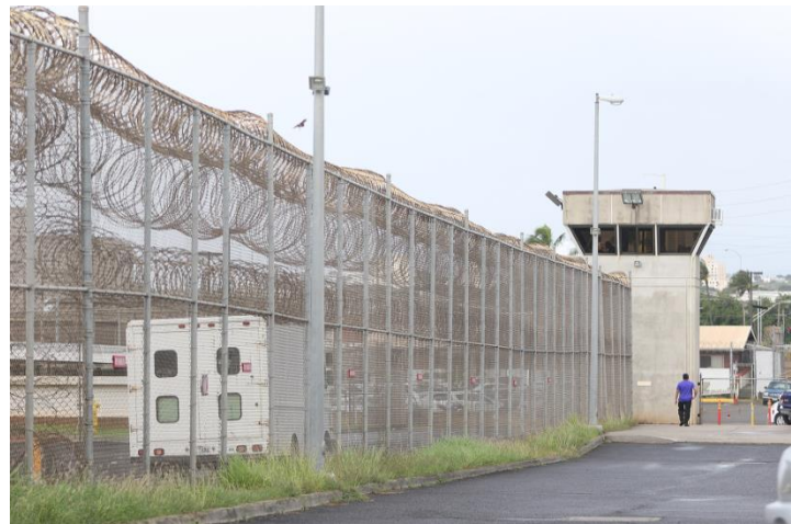
Görsel 4 : Oahu Community İslahevi ( http 3).