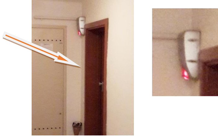
Görsel 11: Daire İçin Özel Alarm Sistemi

Site ve blok giriş kapılarında ki gözetim ve denetim unsurları otoparklarda ve açık alanlarda artarak tekrarlanmakta ve sürekli gözetilerek içeride yaşanan insanların belirli bir disiplin içinde hareket etmeleri sağlanmaya çalışılmaktadır.