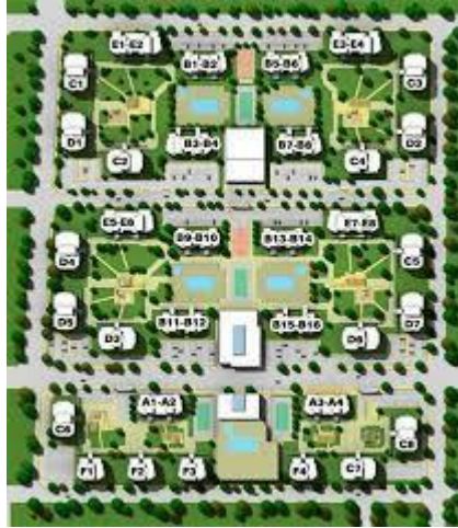
Görsel 1: Kentplus Sitesi 3.Etap Vaziyet Planı (http 1)

Kentplus sitesi 3.Etap kısmının vaziyet planı incelendiğinde düşük güvenlikli modern bir Amerikan hapishanesinin vaziyet planıyla benzer olduğu, en azından binaların yerleşim şekli ve ortak yaşam alanlarının konuşlandırılması bakımından birbirlerine benzerlik gösterdikleri Görsel 1 ve 2'de görülmektedir.