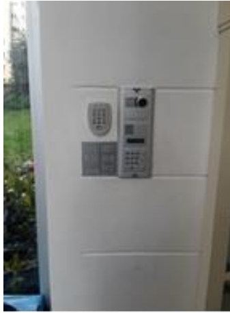
Görsel 9: Site Blok Girişleri Kamera ve Kartlı Kayıt Ve Denetim Sistemleri II