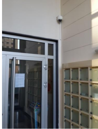
Görsel 8: Site Blok Girişleri Kamera ve Kartlı Kayıt Ve Denetim Sistemleri I

sistem okuması ile kapının hangi kart sahibi tarafından günün hangi zamanında açılmış olduğunda denetlenebilmekte ve kontrol edilmektedir. Benzer bir uygulamaya New York Eyati Bayview hapishanesinin blok girişinde de rastlamak mümkündür.