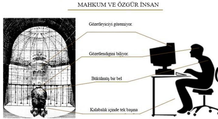
Görsel 15 : Panoptikon ve İnternet (http 8)

Bahsedilen bu durum bireylerin ve toplumların gözetlenebilir ve hatta kontrol edilebilir bir duruma gelmelerine yol açmıştır. Poster'a göre internet ortamı, adete bir süper panoptikon olarak tanımlanmaktadır. Bu ortamda aynı bir panoptikondaki gibi gözetleyeler, duvarlar, pencereler ve kuleler bulunmamaktadır. Burada gerçekleşen temel fark ise internet kullanıcılarının bu gözetlenmeyi ve denetimin bilincinde olmaları ve bu bilinçle dahi bu ortamları kullanmaya devam etmeleridir (Poster, 2004).