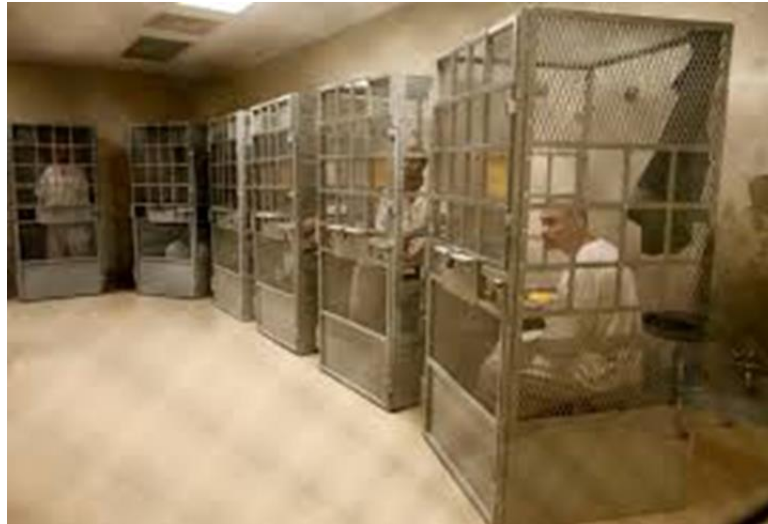
Görsel 12 : San Quentin Hapishanesi (http 5)

Tüm bu sayılan güvenlik unsurları, sözde dışarıdan site içerisine gelebilecek tehditleri engellemeye yönelik olarak tasarlanmış olsa da, istemsiz olarak site sakinlerini sürekli bir gözetim altında tutmaktadır. Bu kadar yoğun gözetim ve denetim olduğu bir yaşam alanında , insanların kendilerine bir disiplin vermeleride doğal olarak karşılanmaktadır.