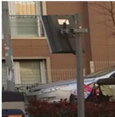
Görsel 7 : Site Giriş Kapılarındaki Teknolojik Gözetim ve Denetim Araçları III.

Site ana giriş kapılarına ek olarak her apartman bloğunun giriş kısımlarında hem içerden hemde dışardan olmak üzere kamera sistemleri ile denetlenerek kayıt altına alınmaktadır, ayrıca blok kapı girişlerinde kartlı