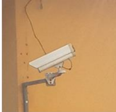
Görsel 6 : Site Giriş Kapılarındaki Teknolojik Gözetim ve Denetim Araçları II