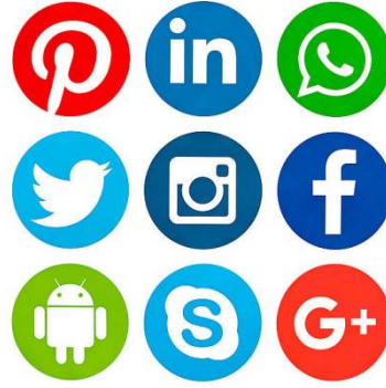
Görsel 14 : Populer Sosyal Ağlar (http 7)

Bahsedilen bu durum bireylerin ve toplumların gözetlenebilir ve hatta kontrol edilebilir bir duruma gelmelerine yol açmıştır. Poster'a göre internet ortamı, adete bir süper panoptikon olarak tanımlanmaktadır. Bu ortamda aynı bir panoptikondaki gibi gözetleyeler, duvarlar, pencereler ve kuleler bulunmamaktadır. Burada gerçekleşen temel fark ise internet kullanıcılarının bu gözetlenmeyi ve denetimin bilincinde olmaları ve bu bilinçle dahi bu ortamları kullanmaya devam etmeleridir (Poster, 2004).