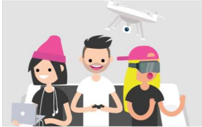
Görsel 13: Dijital Yerliler (http 6)

Özellik 1980 sonrası doğan nesil , literatürde dijital yerliler olarak tanımlanmaktadır. Bu dijital yerliler sosyal medyada gündelik yaşamlarına dair tüm resimleri, kişisel verilerini ve bilgilerini herhangi bir kısıtlamada bulunmadan, serbestçe paylasabilmektedirler. Bu durum mahremiyet derecesinin sorgulanmasının gerekliliğini ortaya koymaktadır (Yıldız, 2012).