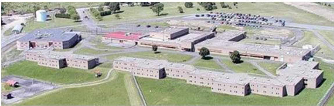
Görsel 2: Jamesville Hapishanesi / Syracuse, NY Vaziyet Görünüşü (http 2)