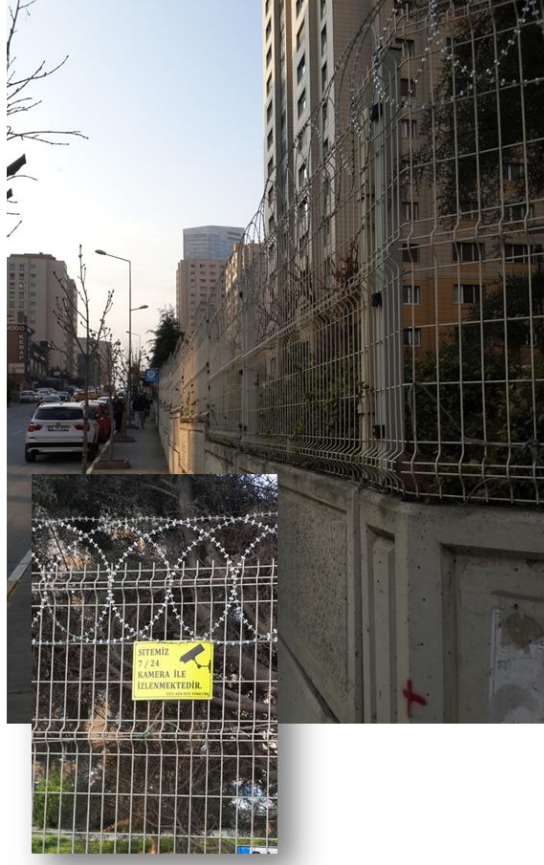
Görsel 3: Site Dış Duvarları ve Jiletli Tel Uygulaması

Genel site güvenliğini sağlayan dış duvarlar sitenin çevresini sarmakta ve jiletli teller ile güvenlik kuvvetlendirilmektedir. Bu tarz bir güvenlik hem dışardan gelebilecek tehditlere karşı koruma ve denetim sağlamakta hemde içerden dışarıya geçişi mümkün kılmayacak hale getirerek bir disiplin aracı olarak kullanılabilir. Hapishanelerde de aynı durum söz konusudur, Amerika Birleşik Devletleri'nin Hawaii eyaletinde yer alan Oahu Community İslahevi incelendiğinde bu güvenli siteyi dış duvarlarına benzer bir yapı gözlemlenebilmektedir.