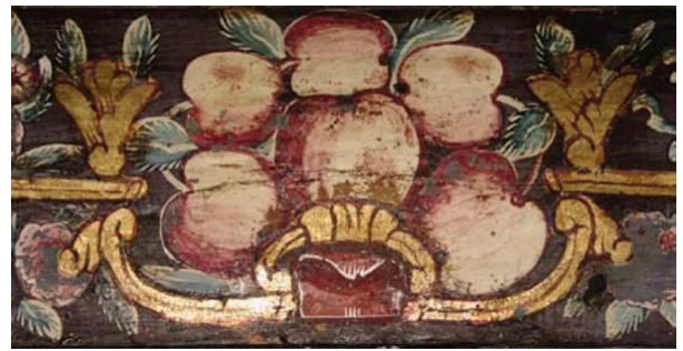
Fotoğraf: 6: Berat Şeyh Hasan Halveti Tekkesi semahanesindeki meyve tasviri