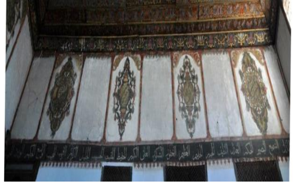
Fotoğraf 10: Berat Şeyh Hasan Halveti Tekkesi semahane doğu duvar süslemeleri