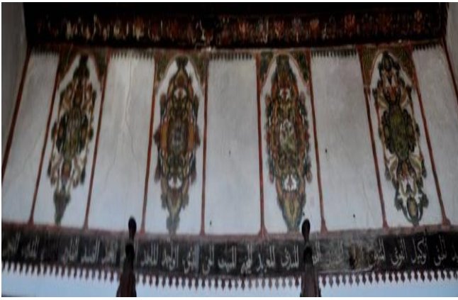
Fotoğraf 11: Berat Şeyh Hasan Halveti Tekkesi semahane kuzey duvar süslemeleri