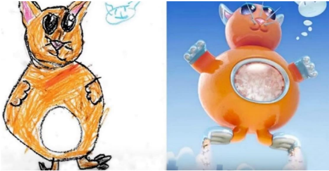
Görsel-4, Bir Çocuk Resminden Dönüştürülen Illüstratif Karakter Tasarımı, (Erişim)

Görsel-3’teki çocuk resminin, “illüstratif yöntemlerle dönüştürülmüş olduğu karakter tasarımına” gelindiğinde ise sonuç başarılıdır. Dönüştürme işlemlerinde yapılan küçük değişiklikler resmin özünü, genel karakterini bozmamıştır. Ağız ve gözün belirgin bir biçimde yapılmış olması, saç karakterinin belli bir düzen içerisinde verilmiş olması, mümkün olabilecek değişim sınırları içerisinde kalabilmiştir. Elde edilen illüstratif karakter ile, orijinal resim karşılaştırıldığında, aralarında bir dil birliği olduğu rahatlıkla anlaşılabilir. Bu çalışmanın amacı da, söz konusu dil birliğini mümkün olan en etkili seviyede yansıtabilmektir.