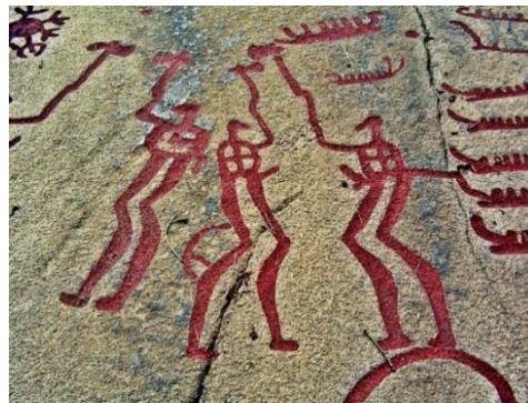
Görsel-2 , İsveç Tanum ve Venezuela’da Bulunan Petroglif Örnekleri, (Erişim)

Yukarıda Görsel-2’deki kaya resimlerinde ise ilkel estetiğin farklı iki örneği görülmektedir. Birinci resimde, o dönemin biçimsel algılamasına göre çok ilginç bir resmetme kavrayışı söz konusudur ki, burada resmedilmeye çalışılan hayvanlar çok ilginç ve hassasiyet ruhu gerektiren bir kavrayışla