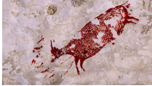
Görsel-1 , Endonezya'daki Bir Mağaranın Duvarında Bulunan ve Kırkdört Bin Yıllık Olduğu Düşünülen Bir Resim, (Erişim)

İlkel estetiğin görsel özelliklerini taşıyan bir mağara duvarı resmi, Görsel-1’de incelenebilir.