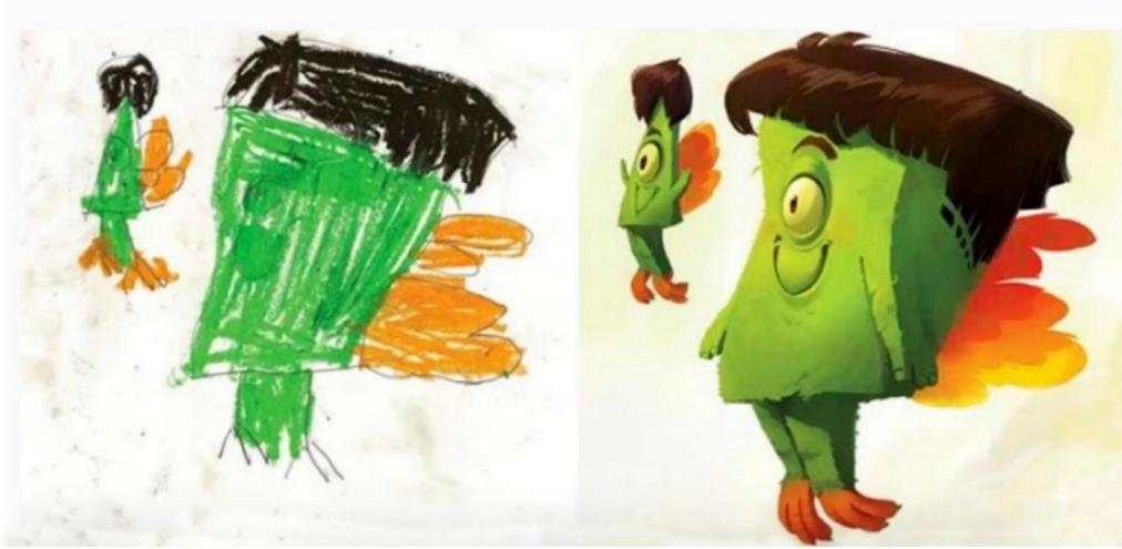
Görsel-3, Bir Çocuk Resminden Dönüştürülen İllüstratif Karakter Tasarımı. (Erişim)

Bu illüstratif tasarım çalışmanın en önemli özelliği; model olarak seçilen çocuk resminin, illüstratif karakter tasarımına çevrilirken, resmin orijinal özelliklerinin tamamının korunması yönündedir. Yani ilkel estetiğin görsel değerlerini taşıdığı için seçilmiş olan söz konusu çocuk resminin sahip olduğu görsel karakter hiçbir biçimde değiştirilmez. Fakat söz konusu model resim; köklü değişikliklere uğratılmadan bazı takviye uygulamalarla işlenerek, illüstratif bir karakter tasarımına dönüştürülmeye çalışılır.